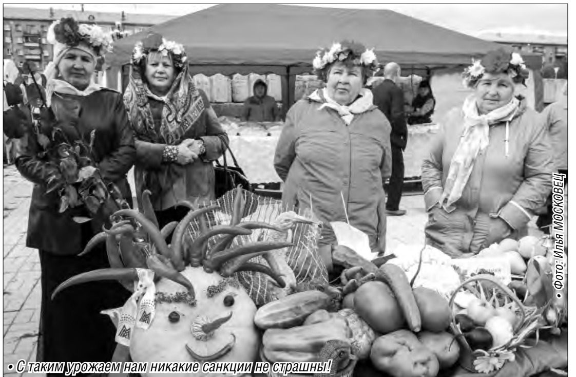
• С таким урожаем нам никакие санкции не страшны!

Юбилей газеты «МР» насытили овощами и подсластили фруктами.