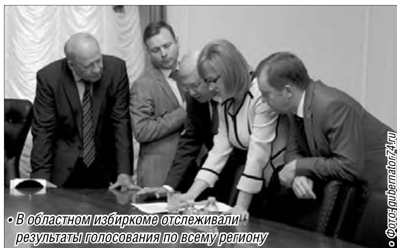
В областном избиркоме отслеживали результаты голосования по всему региону

– У политической партии «Единая Россия» – 56,2 процента, у