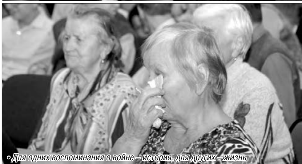
Для одних воспоминания о войне – история, для других – жизнь