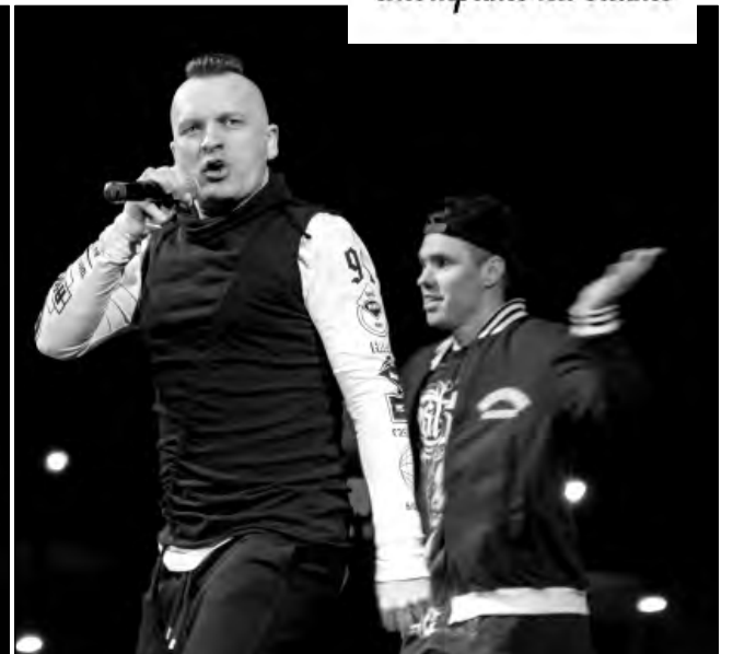
• Розыгрыш юбилейных подарков длился целый день, а завершила праздничный марафон группа «Кар-Мэн»

Ожидаемое торжество, которое мы анонсировали все последнее время, привлекло на площадь Народных гуляний множество горожан.