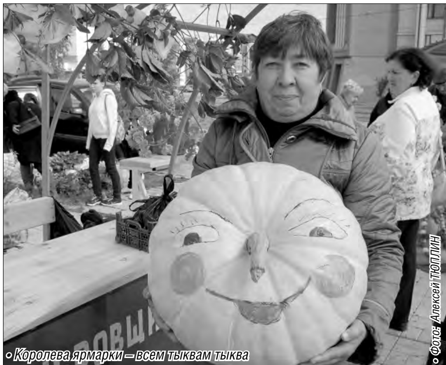
• Королева ярмарки – всем тыквам тыква

Дары осени можно было пробовать на вкус и уносить домой