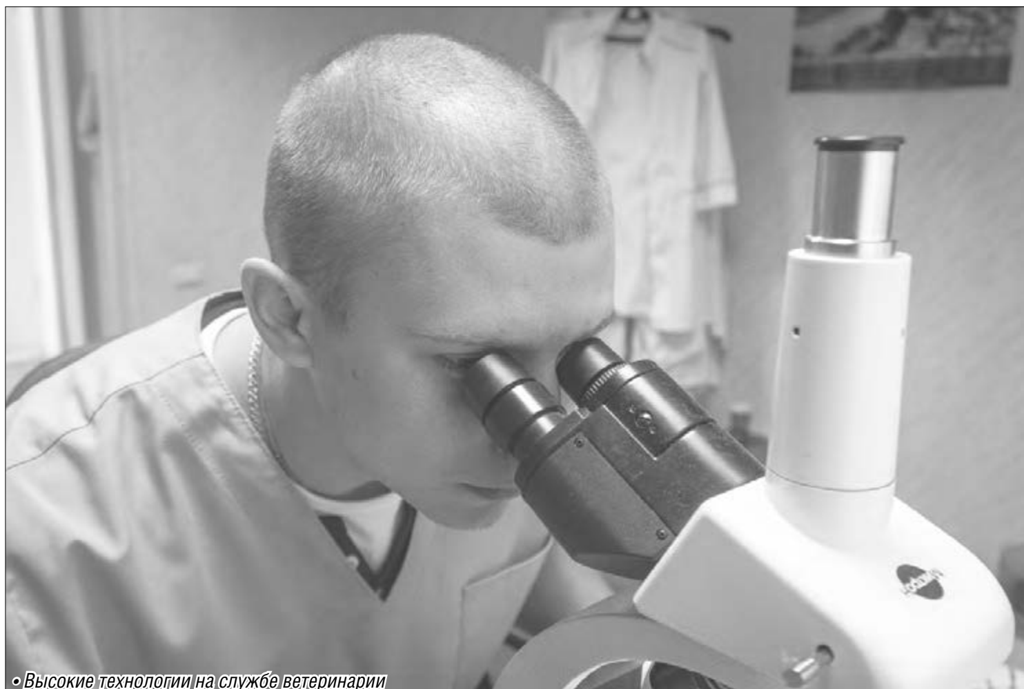
• Высокие технологии на службе ветеринарии

Даже бешенство, опасность занесения которого дикими животными сохраняется всегда, в нынешнем году Магнитогорск миновало. Для профилактики этого заболевания регулярно проводится так называемая «оральная» вакцинация – препарат разбрасывается работниками ветстанции в окрестностях города, где достается лисам и другим диким животным. Домашние питомцы получают прививки от бешенства