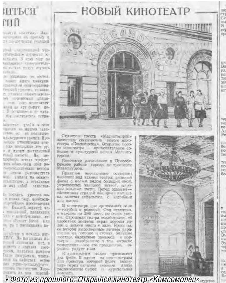
• Фото из прошлого. Открылся кинотеатр «Комсомолец»