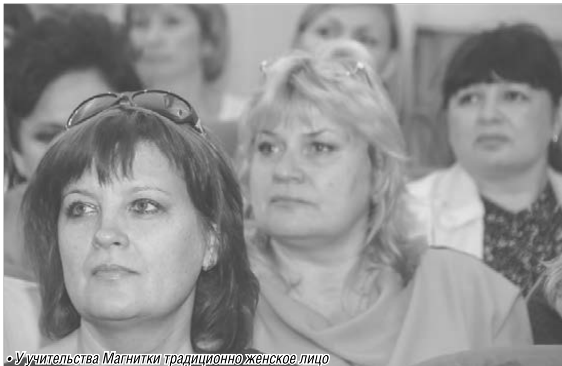
Учительства Магнитки традиционно женское лицо

На общероссийском уровне сегодня активно призывают переводить школы на обучение в одну смену. В Магнитогорске доля школьников, занимающихся с утра, составила 84 процента, в то время как в целом по региону этот показатель – 81 процент. Поможет решить проблему строительство новой школы в юго-за-