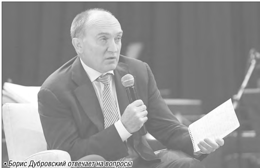
• Борис Дубровский отвечает на вопросы

Южноуральские пенсионеры получают единовременную выплату ко Дню пожилого человека