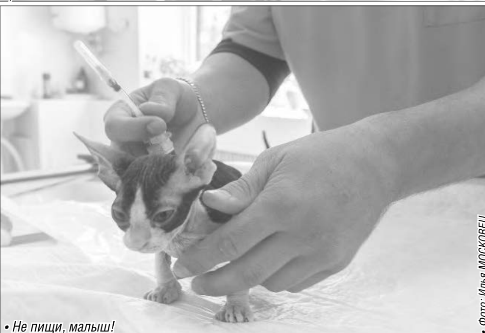
• Не пици, малыш!

Наши ветеринары, а в эту профессию идут обычно фанаты, активно интересуются прогрессивными научными достижениями.