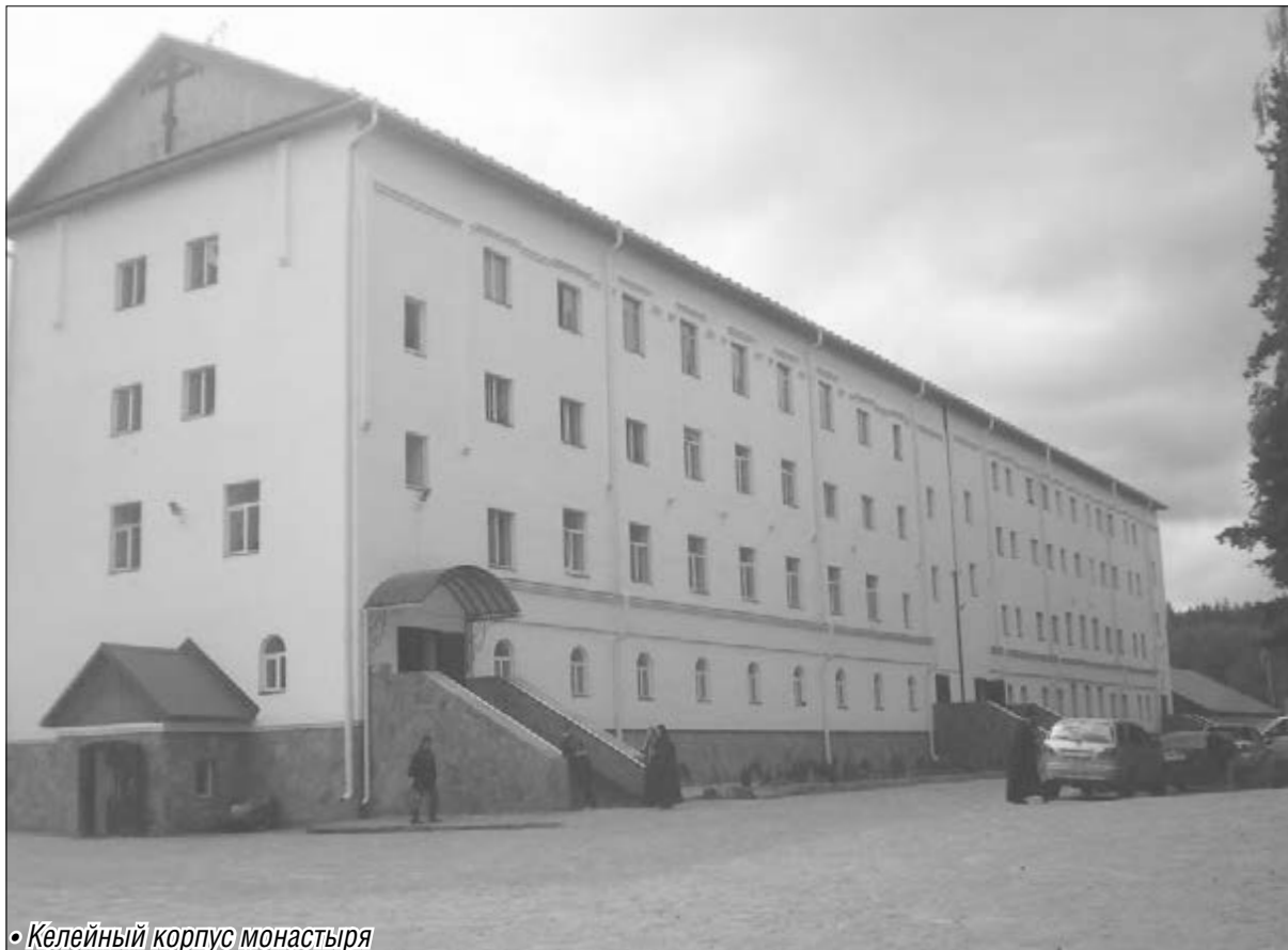
• Келейный корпус монастыря

Многие россияне предпочитают зарубежным турам отдых на родине