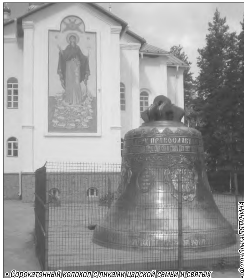
• Сорокаторный колокол с ликами царской семьи и святых