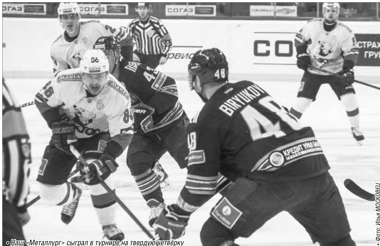
Наш «Металлург» сыграл в турнире на твердую четвёрку

Завершился традиционный хоккейный турнир на Кубок губернатора