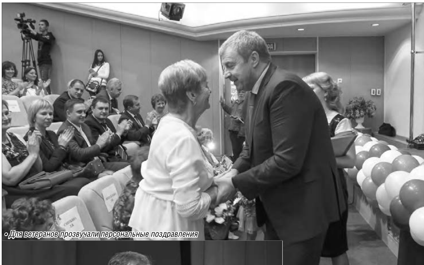
• Для ветеранов прозвучали персональные поздравления

Финансовой системе Магнитогорска исполнилось 85 лет