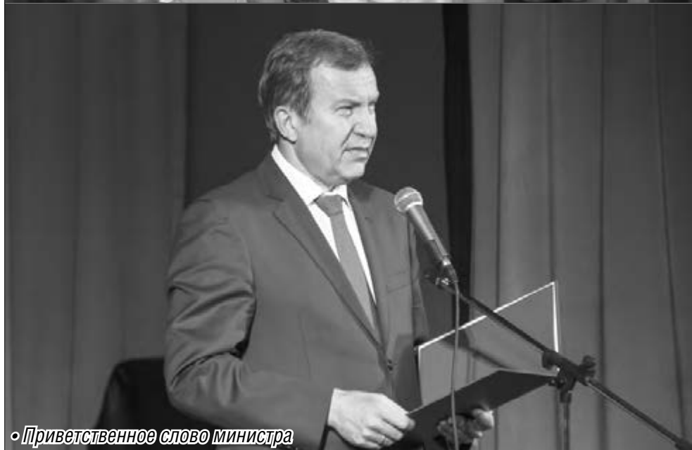
• Приветственное слово министра

деятельности. Благодаря четкому планированию и исполнению бюджета достигнуты многие успехи.