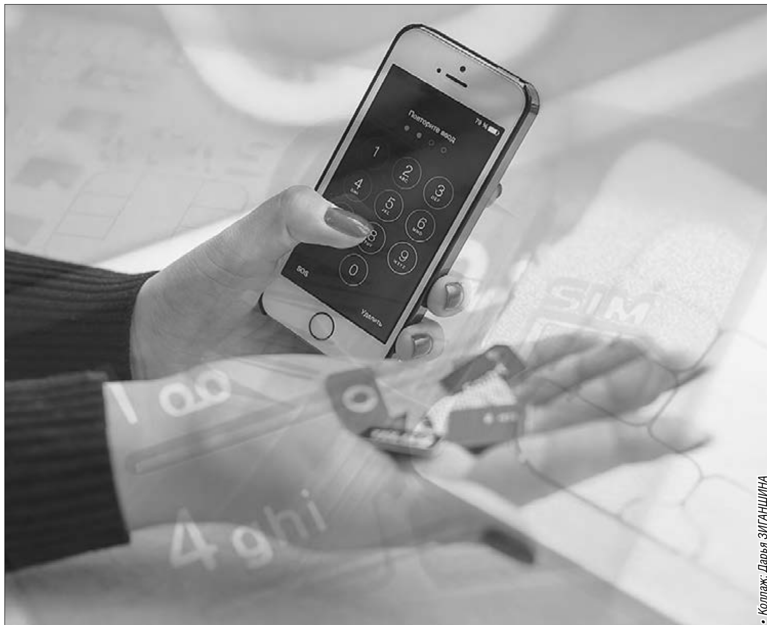
• Коллаж: Дарья СИГАНШИНА

В Минэкономразвития признают наличие проблемы незаконного выведения денег через счета сотовых операторов. Но новация, по мнению министерства, не позволит искоренить мошенничество, поскольку