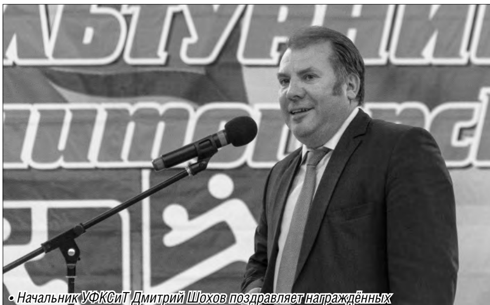
• Начальник УФСКИТ Дмитрий Шохов поздравляет награждённых

День физкультурника отмечается в России во вторую субботу августа на основании указа Президиума Верховного Совета СССР «О праздничных и памятных днях» от 1 октября 1980 года.