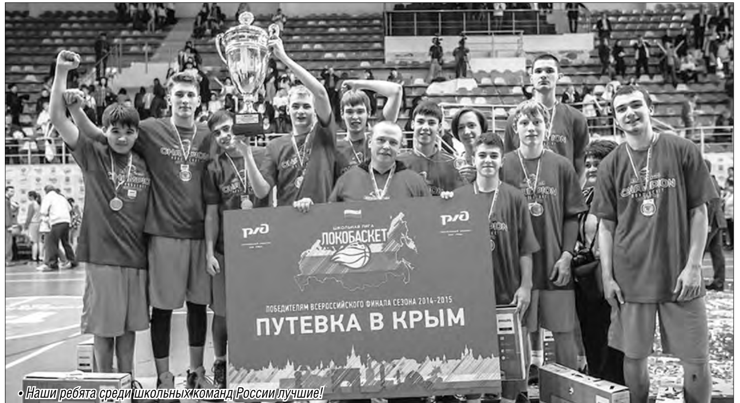
• Наши ребята среди школьных команд России лучшие!

В течение двух недель магнитогорцы соблюдали строгий спортивный режим: ранняя утренняя пробежка, завтрак, тренировка, купание в море, обед, снова тренировочное поле стадиона, и только после ужина – свободное время. На баскетбольных площадках олимпийского центра «Спартак» магнитогорцы провели несколько дружеских встреч с другими школьными командами. Нашлось время и для экскурсий,