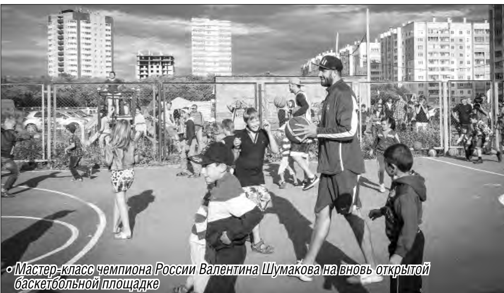
• Мастер-класс чемпиона России Валентина Шумакова на вновь открытой баскетбольной площадке