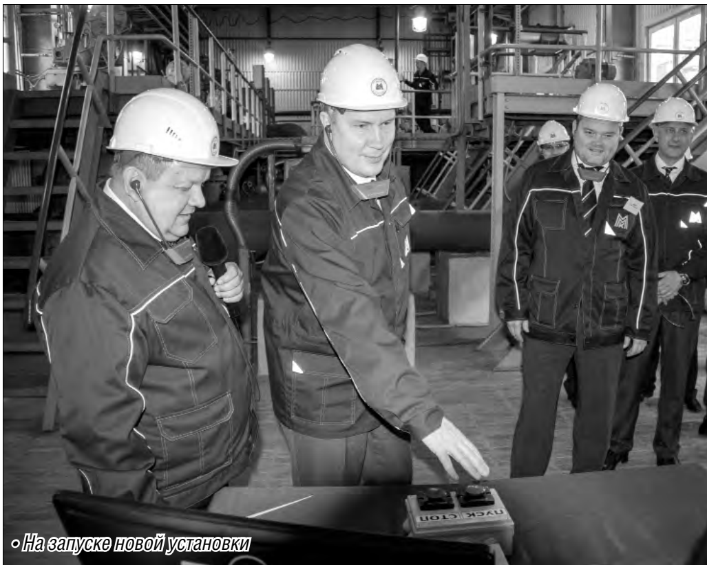
• На запуске новой установки

К своему главному профессиональному празднику металлурги подготовились качественно