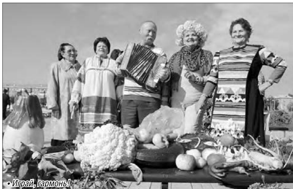
• Играй, гармонь!