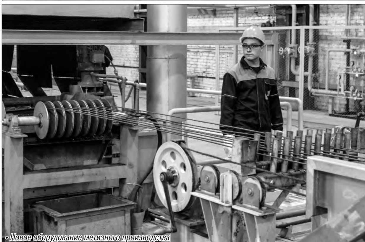
• Новое оборудование метизного производства