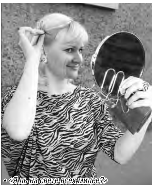
• «Яль на свете всех милее?»

Снижение цен на продукты питания обусловлено ростом доли товаров местных производителей, расширением ассортимента их продукции, сезонностью для овощных культур. Одним из факторов сдерживания роста цен стало заключение восьми соглашений о сотрудничестве между правительством Челябинской области и торговыми сетями.