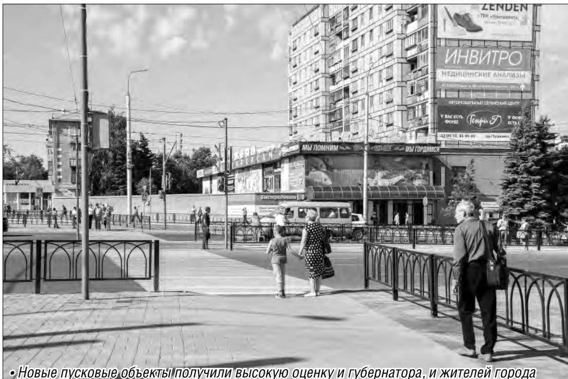
• Новые пусковые объекты получили высокую оценку и губернатора, и жителей города