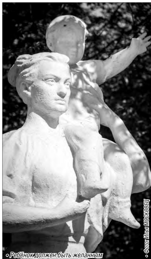
«Ребёнок должен быть желанным»

В Магнитке завершилась акция «Подари мне жизнь»