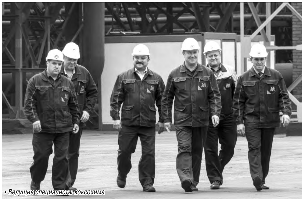
• Ведущие специалисты коксохима