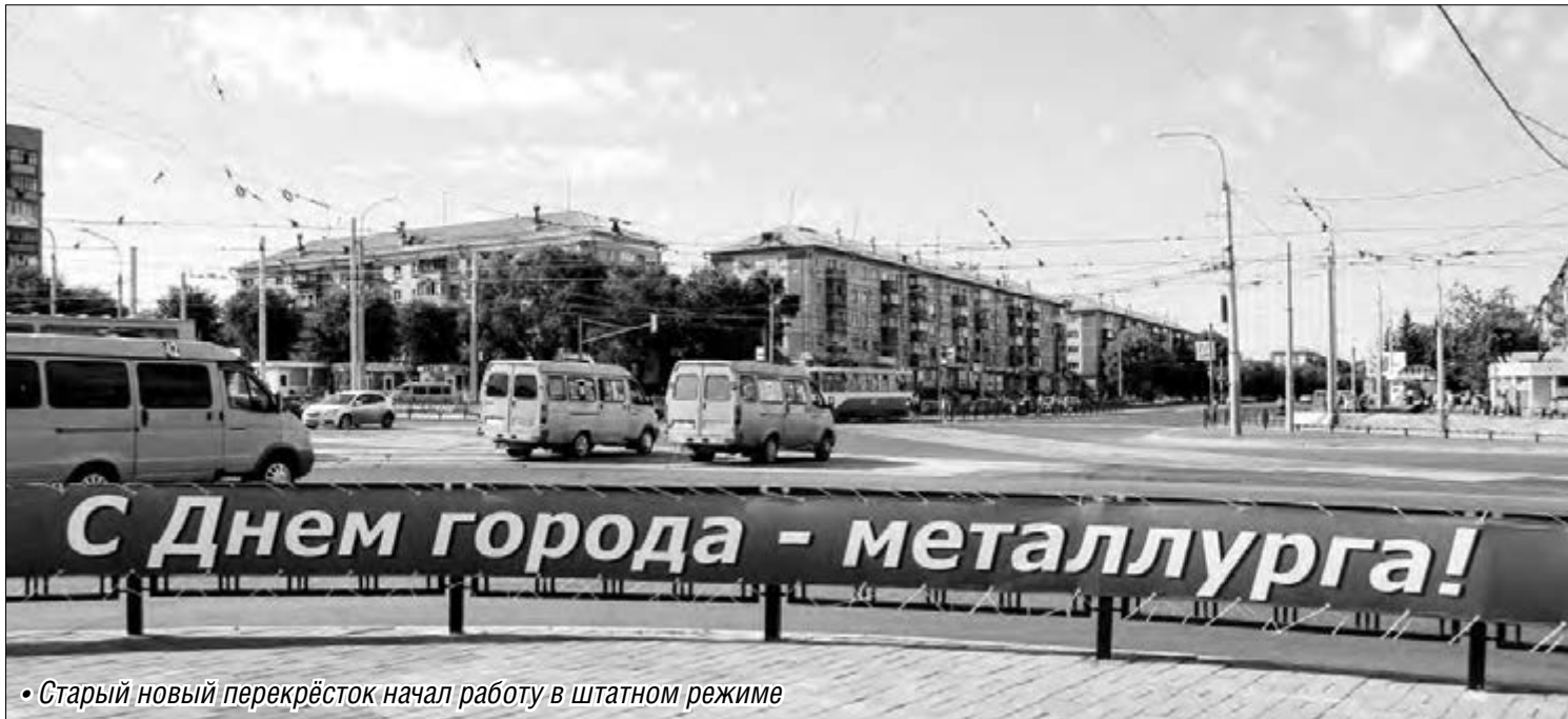
• Старый новый перекрёсток начал работу в штатном режиме

В День металлурга все жители Магнитогорска получили подарки