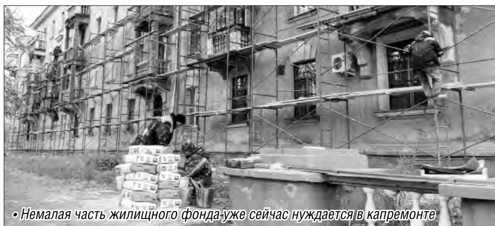
• Немалая часть жилищного фонда уже сейчас нуждается в капремонте

По данным областного подразделения жилищно-коммунального хозяйства, из-за отсрочки в проведении капитальных ремонтов объем ветхоаварийного жилья на Южном Урале составляет практически миллион квадратных метров. Для расселения жильцов таких домов требуется более 26 миллиардов рублей. В России подобный показатель достиг колоссальных размеров – почти