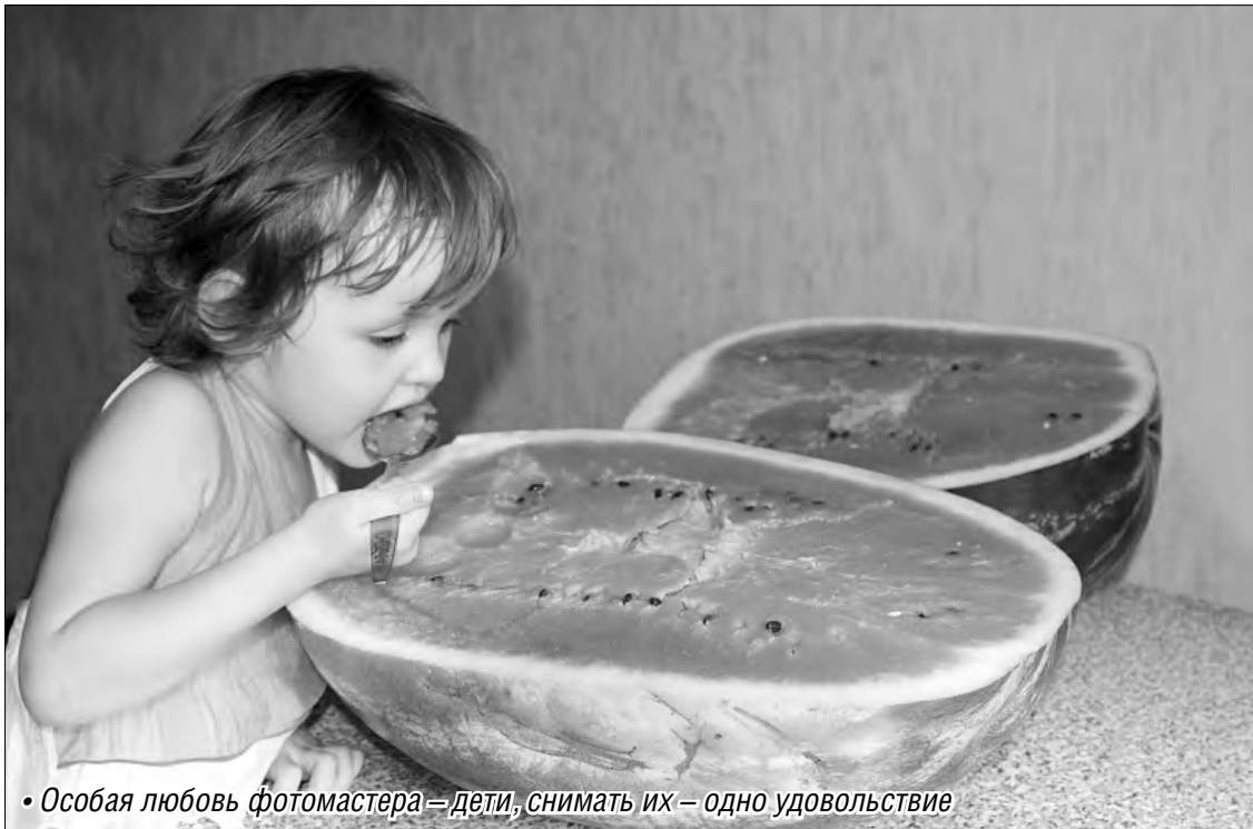
• Особая любовь фотомастера — дети, снимать их — одно удовольствие

В воскресенье отмечают Всемирный день фотографии