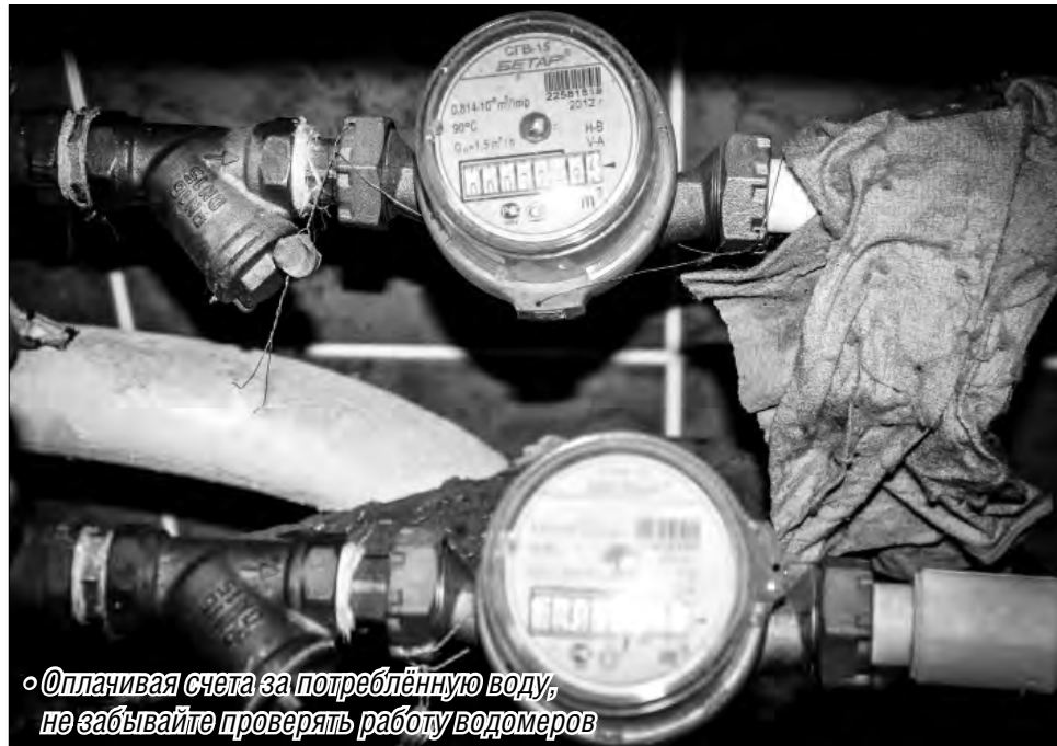
«Оплачивая счета за потреблённую воду, не забывайте проверять работу водомеров»

Срок службы счётчиков воды зависит от многих условий