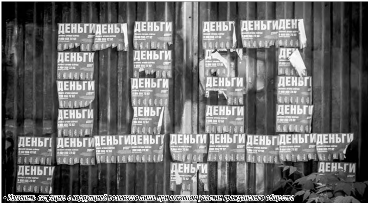
«Изменить ситуацию с коррупцией возможно лишь при активном участии гражданского общества»