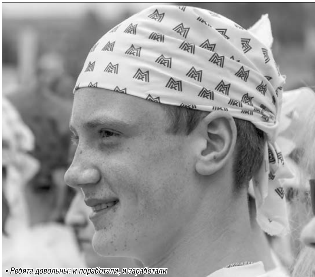
• Ребята довольны: и поработали, и заработали