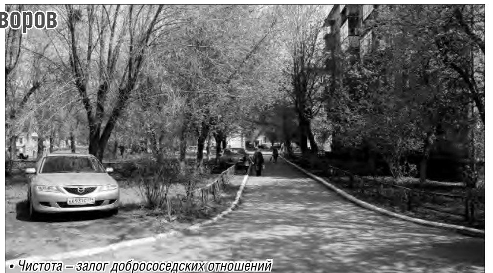
• Чистота – залог добрососедских отношений