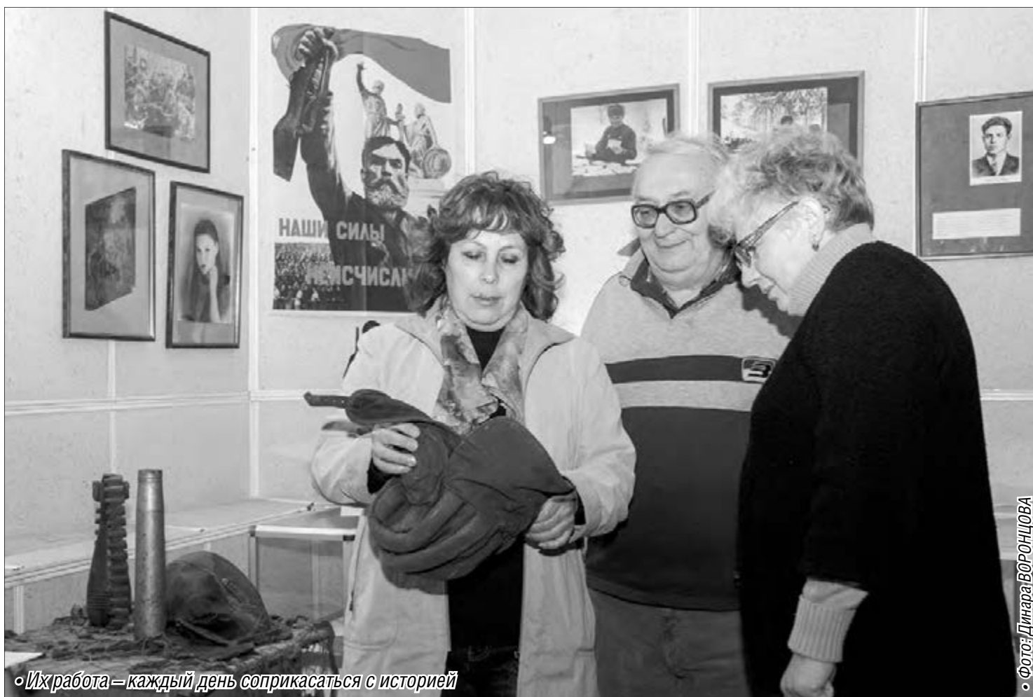
• Их работа – каждый день соприкасаться с историей

Вчера профессиональный праздник отметили сотрудники музеев