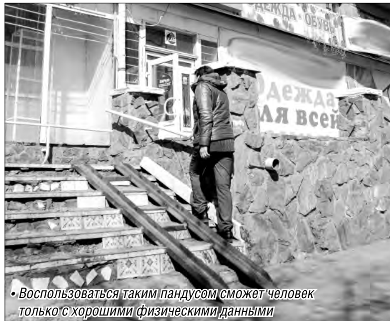
• Воспользоваться таким пандусом сможет человек только с хорошими физическими данными

Ладно бы только это. Несколько лет назад в Магнитогорске произошел вопиющий случай: девушку с физическим недостатком не пустили на дискотеку. Как же, она портит «красивую картинку». Пришлось тогда общественникам «пошуметь» в прессе. В результате владельцы заведения принесли извинения. Больше подобных случаев вроде бы не было.