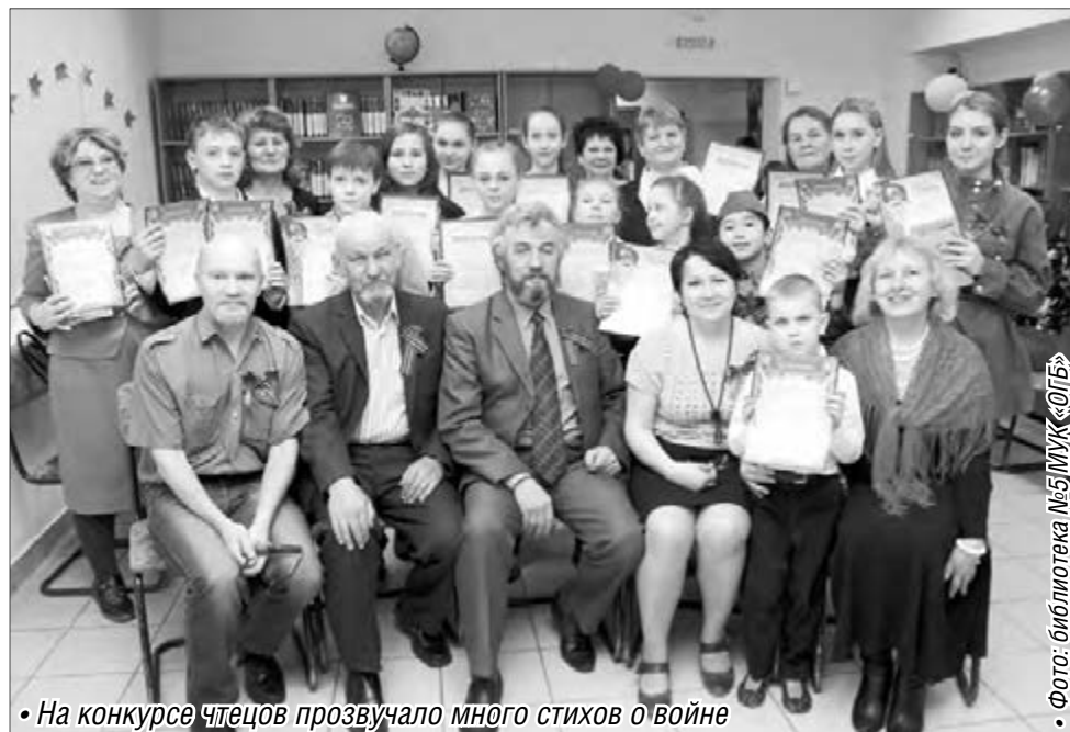
• На конкурсе чтецов прозвучало много стихов о войне