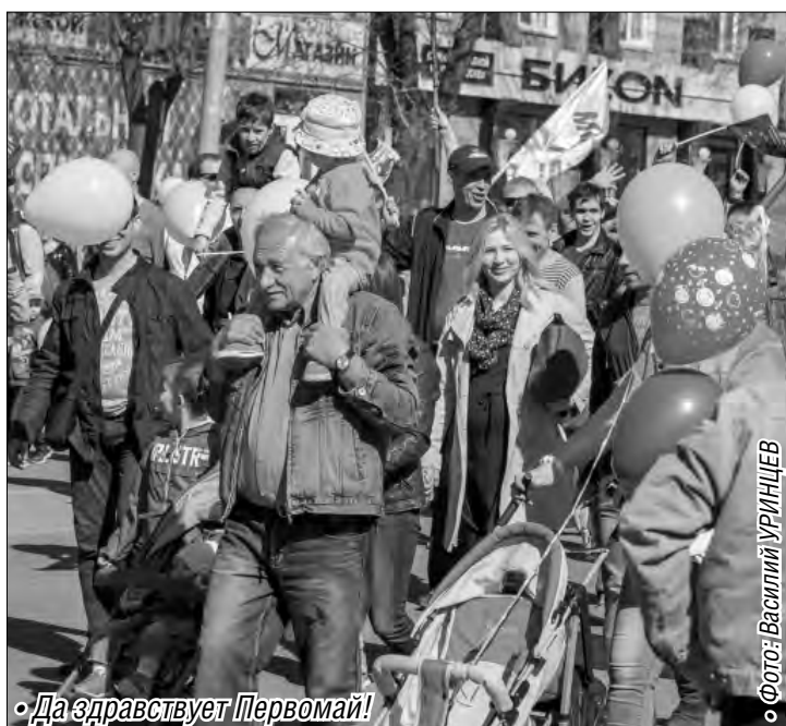
• Да здравствует Первомай!

Руководители города и градообразующего предприятия заняли трибуну, оборудованную у Дворца творчества детей и молодежи, откуда приветствовали и поздравляли с праздником представителей