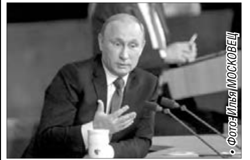
• Фото: Илья МОСКОВЕЦ

7 мая Владимир Путин отметит 15-летие с момента вступления в должность президента.