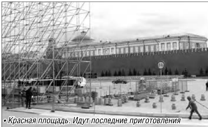
• Красная площадь. Идут последние приготовления

В центре днем и ночью работала строительная и уборочная техника – накануне священной даты в «парадный вид» приводили Красную площадь и примыкающие к ней здания, мемориал Могилы Неизвестного Солдата. 21 апреля днем вход на главную площадь страны был перекрыт – шла подготовка к вечерней пешей репетиции водителей военной техники –