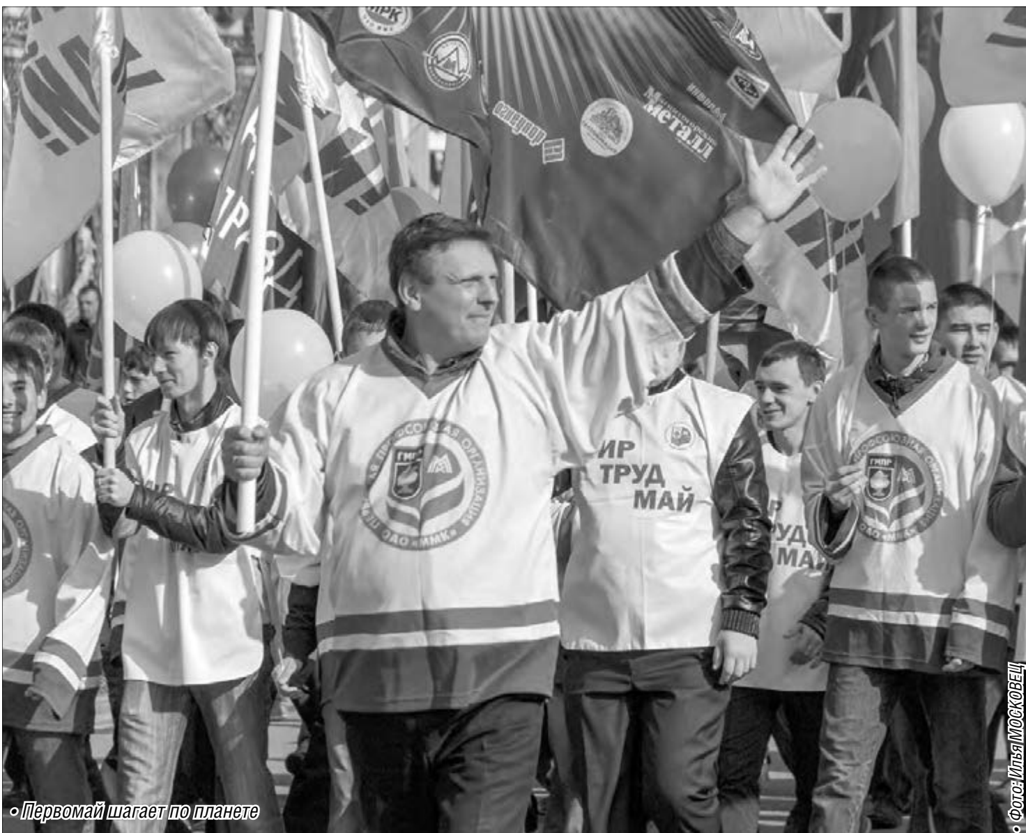
Первомай шагает по планете

Первомайская демонстрация соберёт около шестидесяти тысяч магнитогорцев