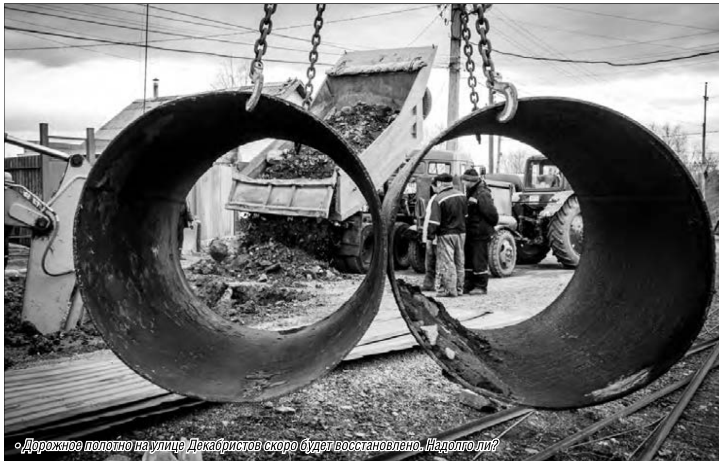
«Дорожное полотно на улице Декабристов скоро будет восстановлено. Надолго ли?»

На одной из улиц левобережья произошла техногенная катастрофа