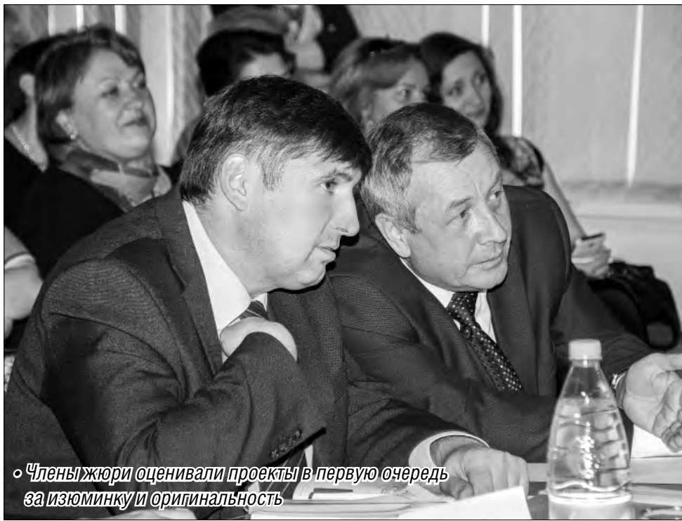
Члены жюри оценивали проекты в первую очередь за изюминку и оригинальность

Назван обладатель гранта главы города «Вдохновение»