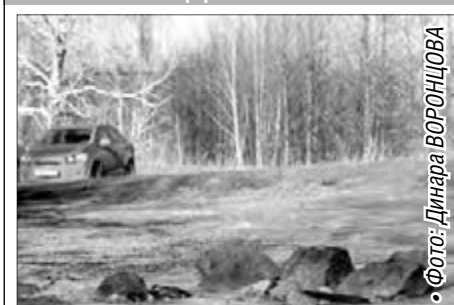
• Фото: Динара ВОРОНЦОВА

Переменная облачность, без осадков Ветер: северный, 2-3 м/сек. Температура: ночь -2° +2° день +8° +11°