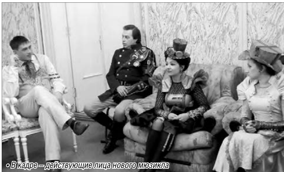
В кадре – действующие лица нового мюзикла

В магнитогорском варианте спектакля зрители увидят традиционный для него синтез музыки, слова, актерского мастерства, а яркой отличительной чертой будет большая роль танца и активное участие в постановке артистов балета, исполняющих самостоятельные роли. Вообще танцевать и широко применять на сцене возможности пластики пришлось исполнителям всех ролей спектакля, в этом-то и заключалась