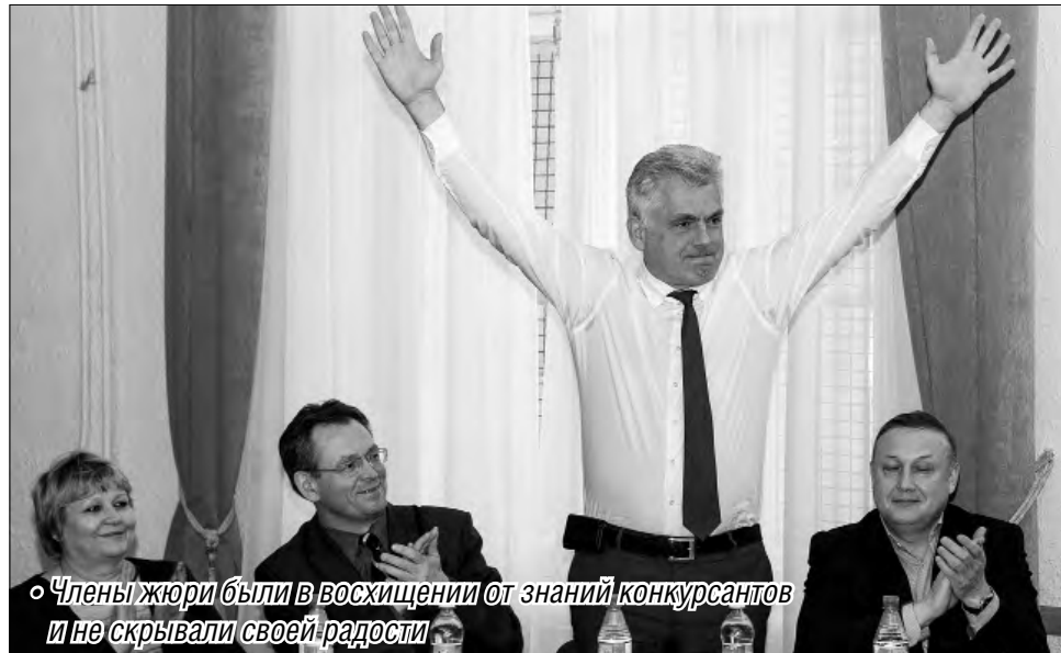
• Члены жюри были в восторжении от знаний конкурсантов и не скрывали своей радости

В этом году уровень знаний школьников оценивали председатель Собрания де-