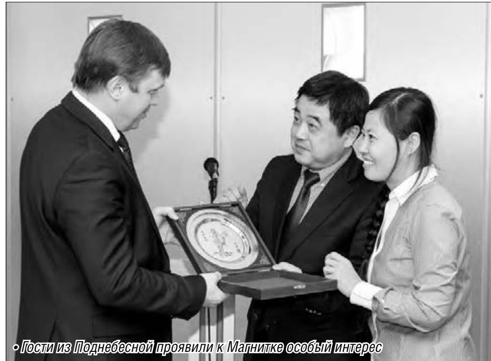
Гости из Поднебесной проявили к Магнитке особый интерес

На прошлой неделе в администрации Магнитогорска прошла двусторонняя встреча