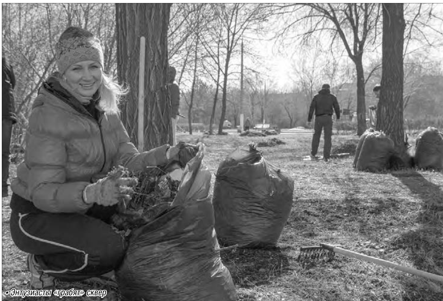
• Энтузиасты «грабят» сквер

Магнитогорцы вышли на всероссийский субботник