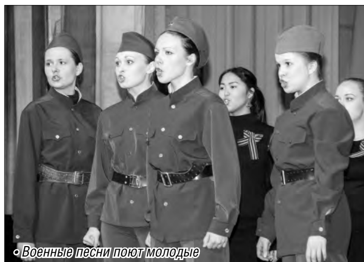
Военные песни поют молодые

Именно в этом районе зародилась традиция передача Знамени Победы, которую поддержал весь город. По инициативе совета ветеранов района была приобретена точная копия знаменитого штурмового флага 150-й ордена Кутузова второй степени Идрицкой стрелковой дивизии, который был водружен в ночь с 30 апреля на 1 мая 1945 года на крыше здания рейхстага в Берлине тремя солдатами Красной Армии