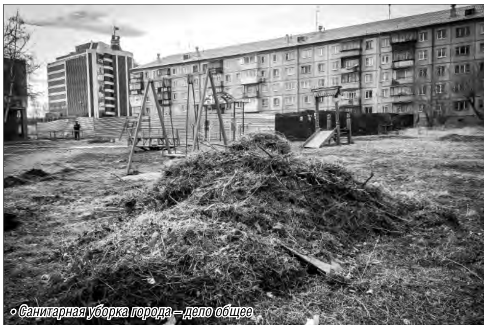
«Санитарная уборка города – дело общее»