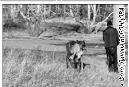
• Фото: Динара БОРОНЦОВА

Переменная облачность, без осадков Ветер: юго-западный, 2-5 м/сек. Температура: ночь -1° +1° день +5° +7°