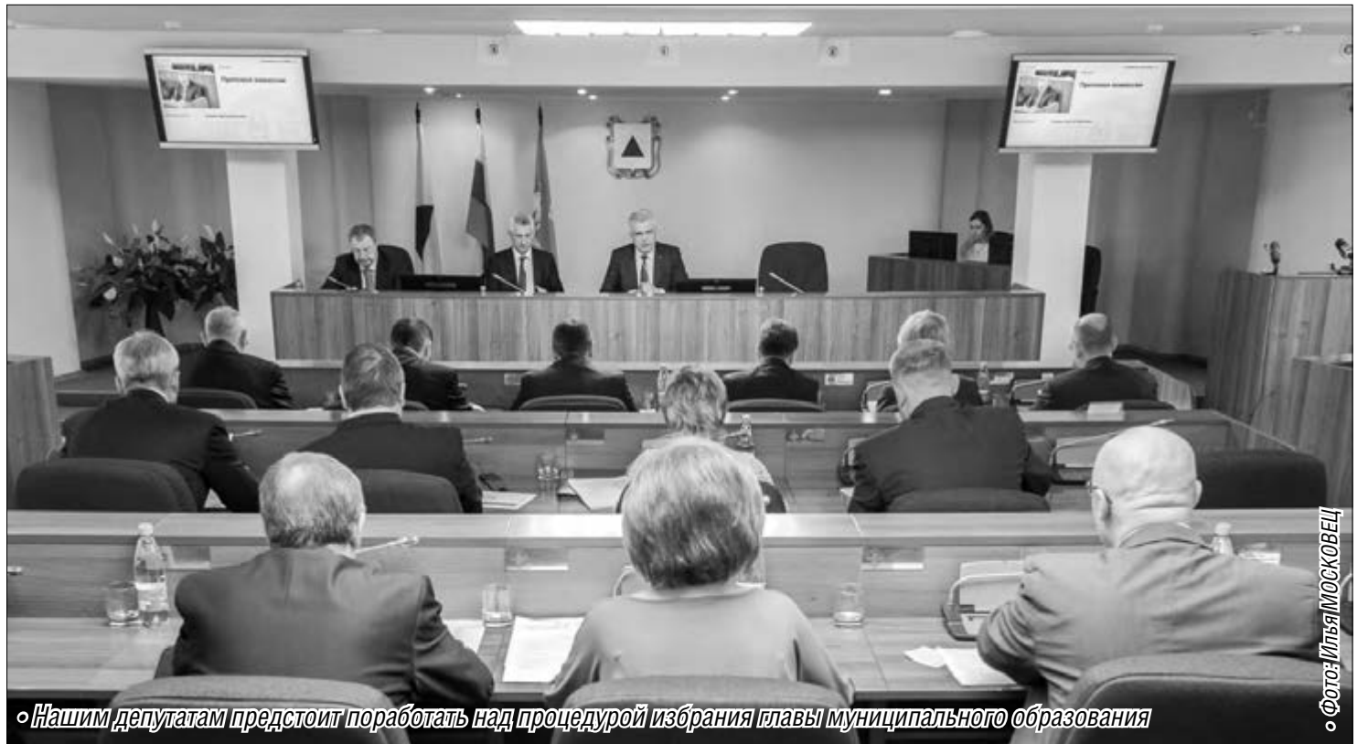
◦ Нашим депутатам предстоит поработать над процедурой избрания главы муниципального образования

Депутаты определяют градоначальникам «проходной балл»