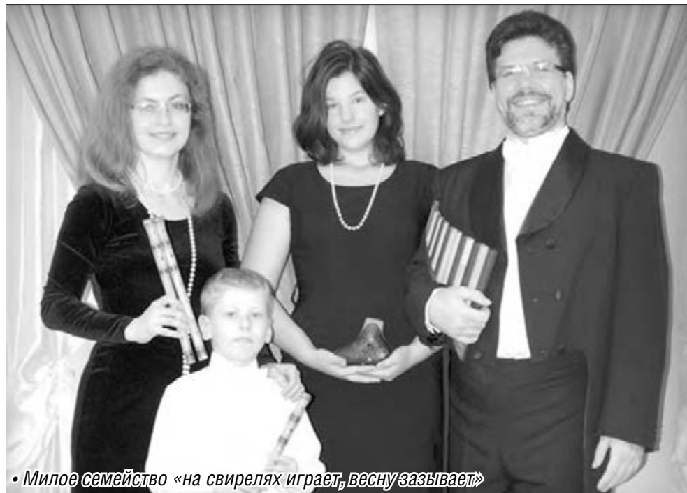
• Милое семейство «на свирелях играет, весну зазывает»

Кроме славянских свирелей различных размеров – от пикколо до баса – участники ансамбля владеют искусством игры на редких инструментах многочисленного семейства флейт – сопилке, окарине. Им подвластны также популярные в мире панфлейта, кена – латиноамериканская «флейта печали», литовский лумдзялис, кельтский вистл, армянский блур. Большой интерес у публики обычно вызывают двойная окарина, состоящая из двух камер, на которых исполнитель играет по очереди, и самый сложный инструмент – «двуденцивка», или «жоломыга», уникальная