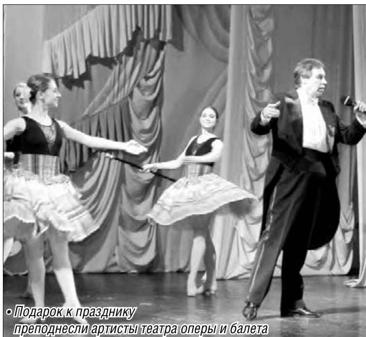
• Подарок к празднику преподнесли артисты театра оперы и балета

Сто тридцать пять приглашений мамам, чьи сыновья бы-