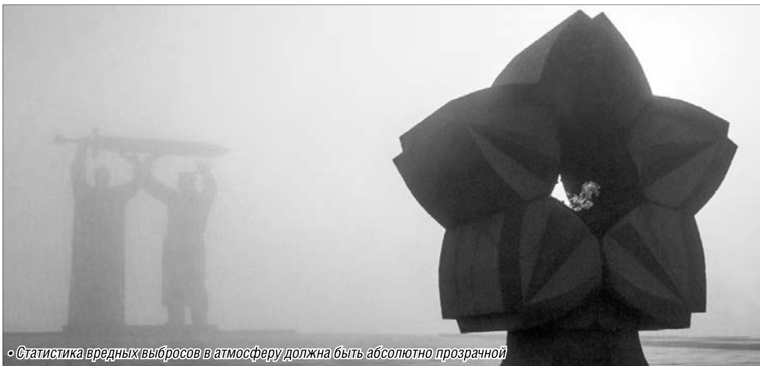
• Статистика вредных выбросов в атмосферу должна быть абсолютно прозрачной

Заботу об окружающей среде необходимо начать с себя