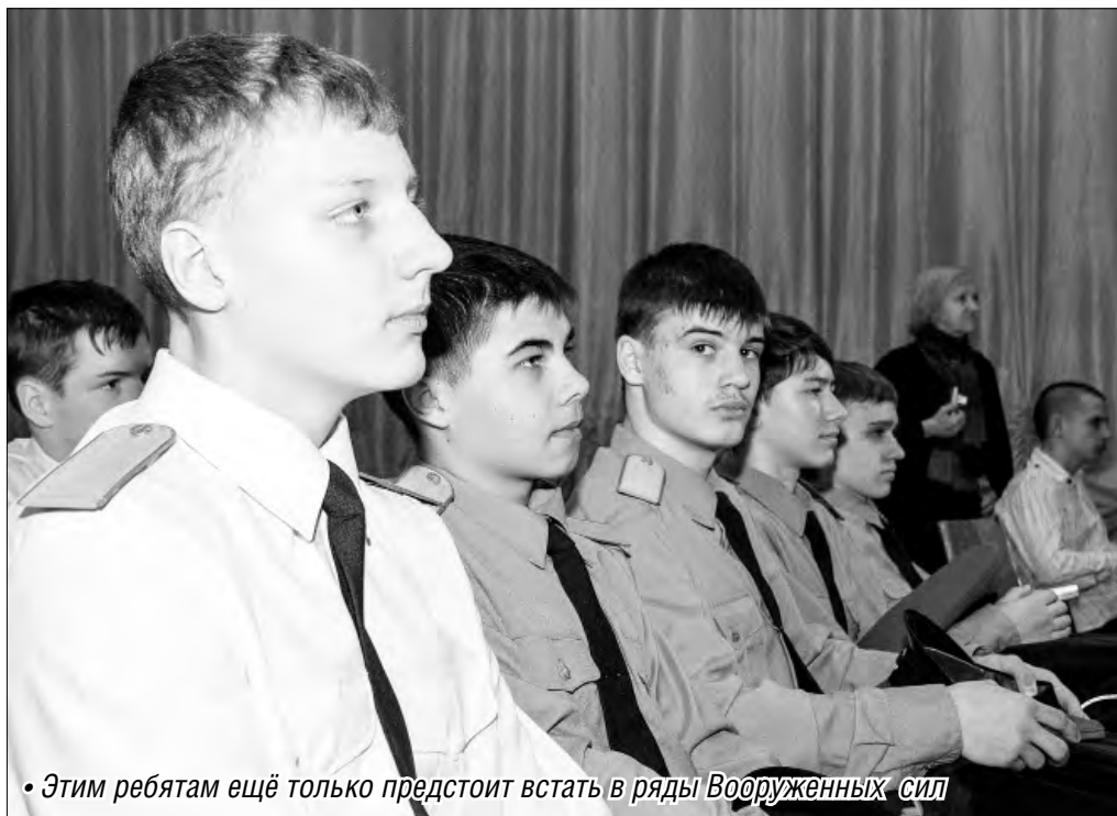
• Этим ребятам ещё только предстоит встать в ряды Вооруженных сил