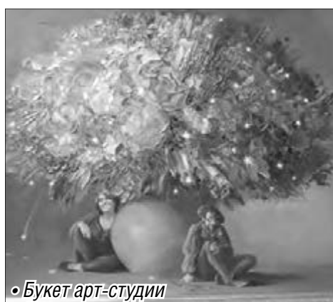
• Букет арт-студии

занятия по искусству живописи он ведет в студии «Открой в себе художника». Не раз принимал участие в областных, зональных,