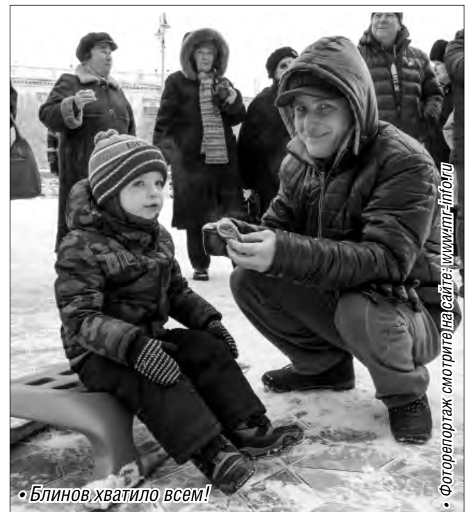
• Блинов хватил всем!

• Фото репортаж смотрите на сайте: www.mr-info.ru