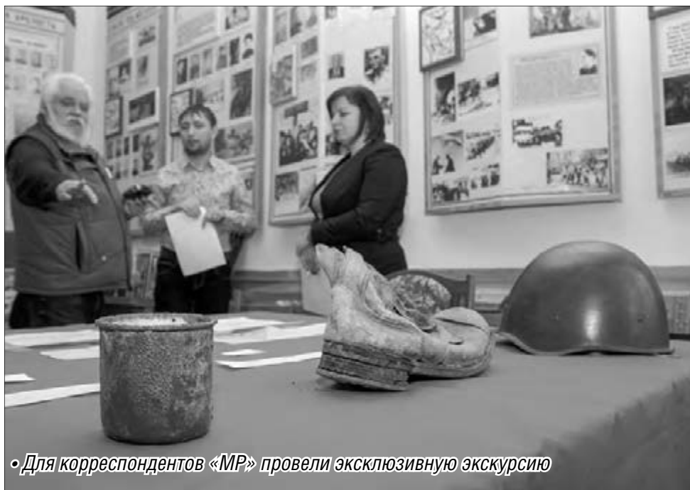
• Для корреспондентов «МР» провели эксклюзивную экскурсию

Музей боевой славы школы №9 повезет свои экспонаты на областной конкурс