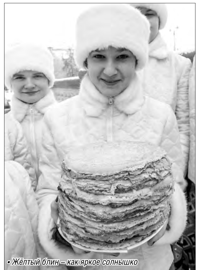
• Жёлтый блин – как яркое солнышко