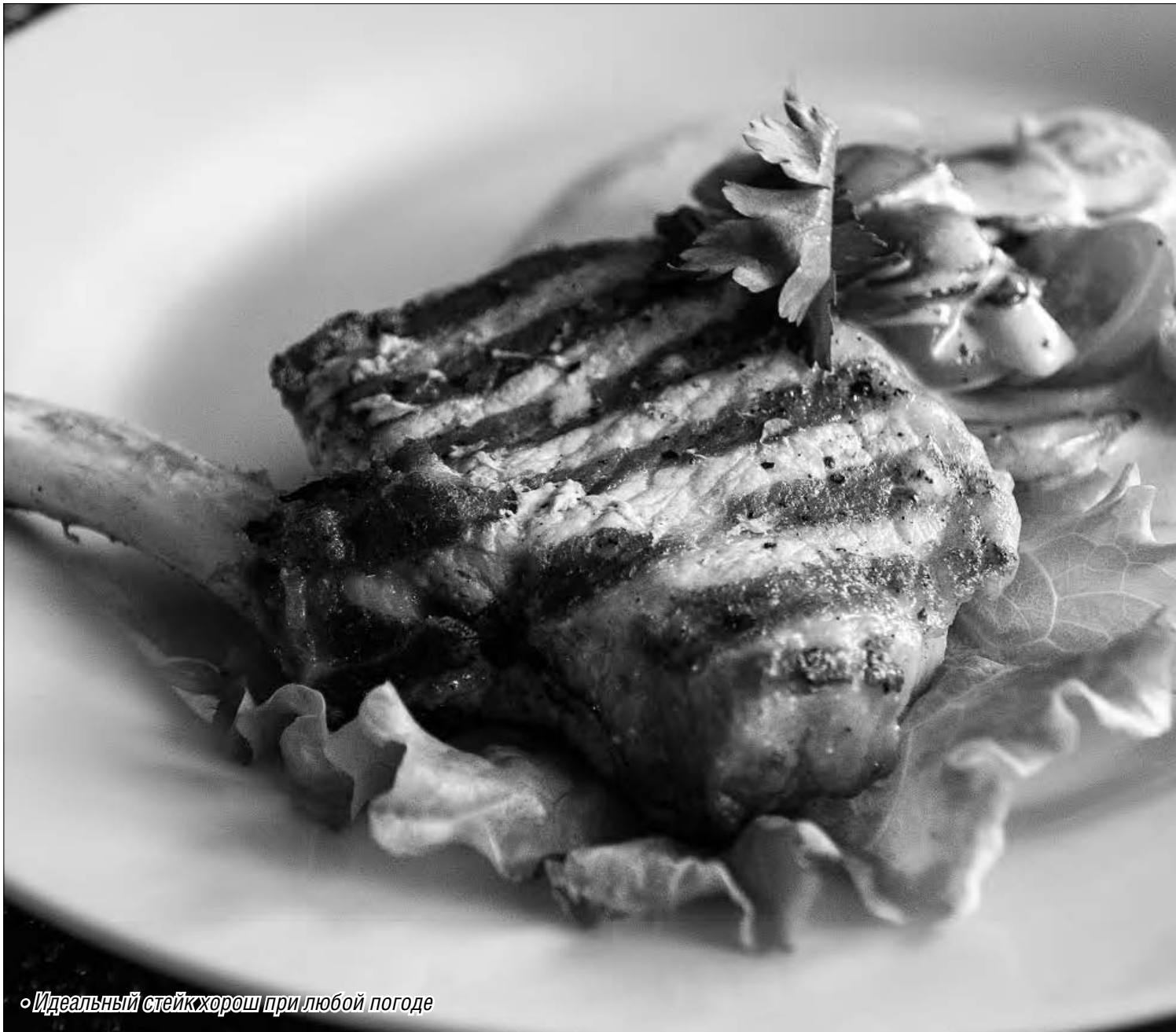
◦ Идеальный стейк-хорш при любой погоде

Главное на праздничном столе – хороший кусок мяса