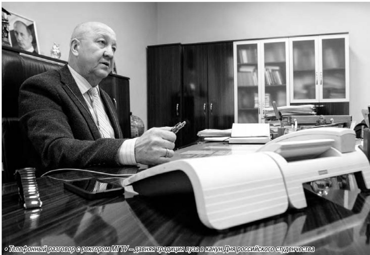
• Телефонный разговор с ректором МГТУ – давняя традиция вуза в канун Дня российского студенчества