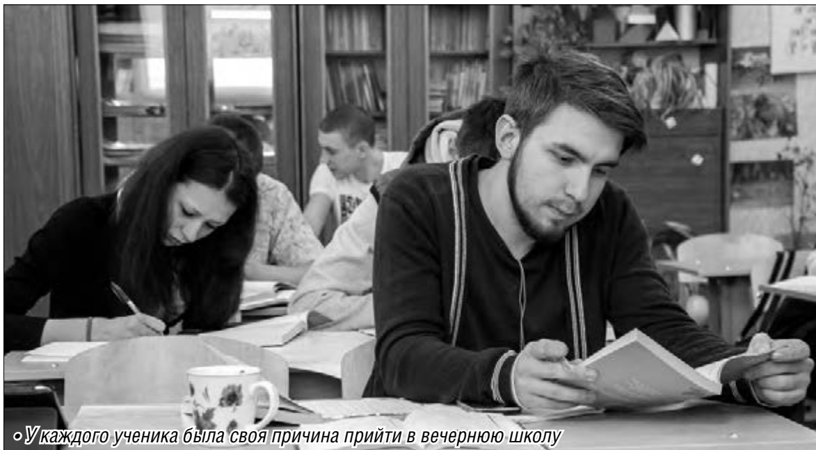
• У каждого ученика была своя причина прийти в вечернюю школу

Вечерняя школа – ещё один шанс получить среднее образование