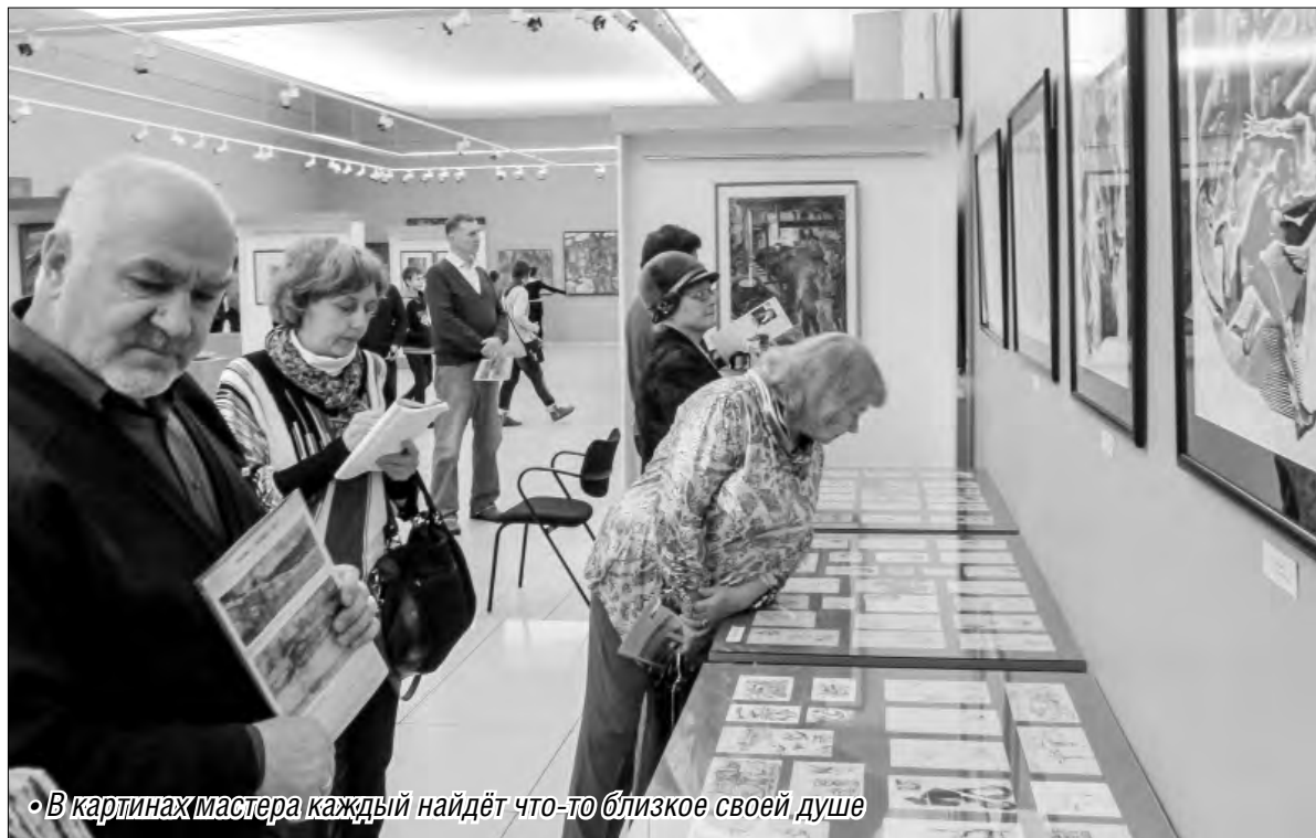
• В картинах мастера каждый найдёт что-то близкое своей душе