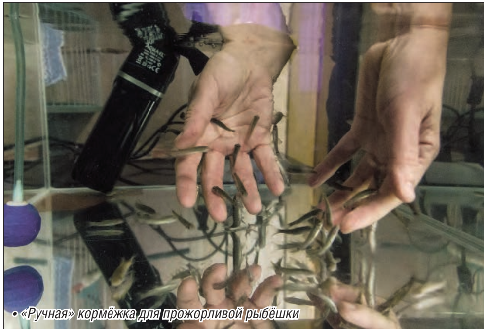
• «Ручная» кормёжка для прожорливой рыбёшки

Для человека процедура эта необыкновенно приятна, а рыбки таким образом получают необходимую пищу. Подобные рыбные маникюр и педикюр широко предоставляют своим клиентам SPA-салоны в странах Азии и Европы. Сегодня многие уважающие себя салоны красоты России стремятся обзавестись подобной живностью для пилинга.