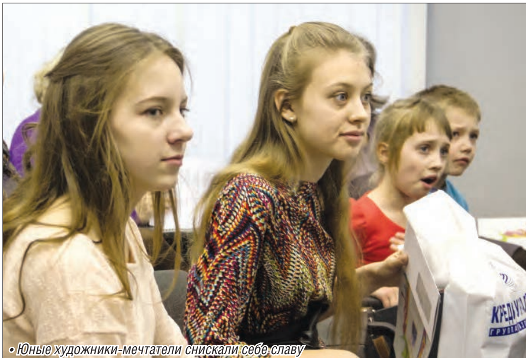
• Юные художники-мечтатели снискали себе славу

Около двух десятков детских рисунков были отмечены призами конкурсного жюри