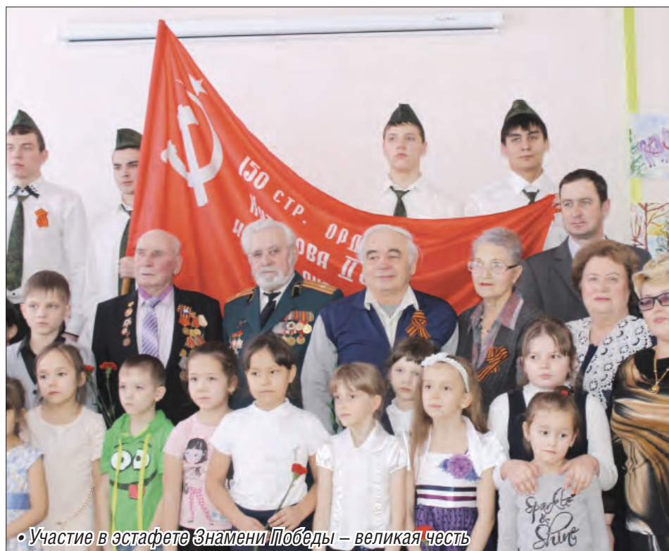
• Участие в эстафете Знамени Победы – великая честь

В Магнитогорске проходит эстафета Знамени Победы