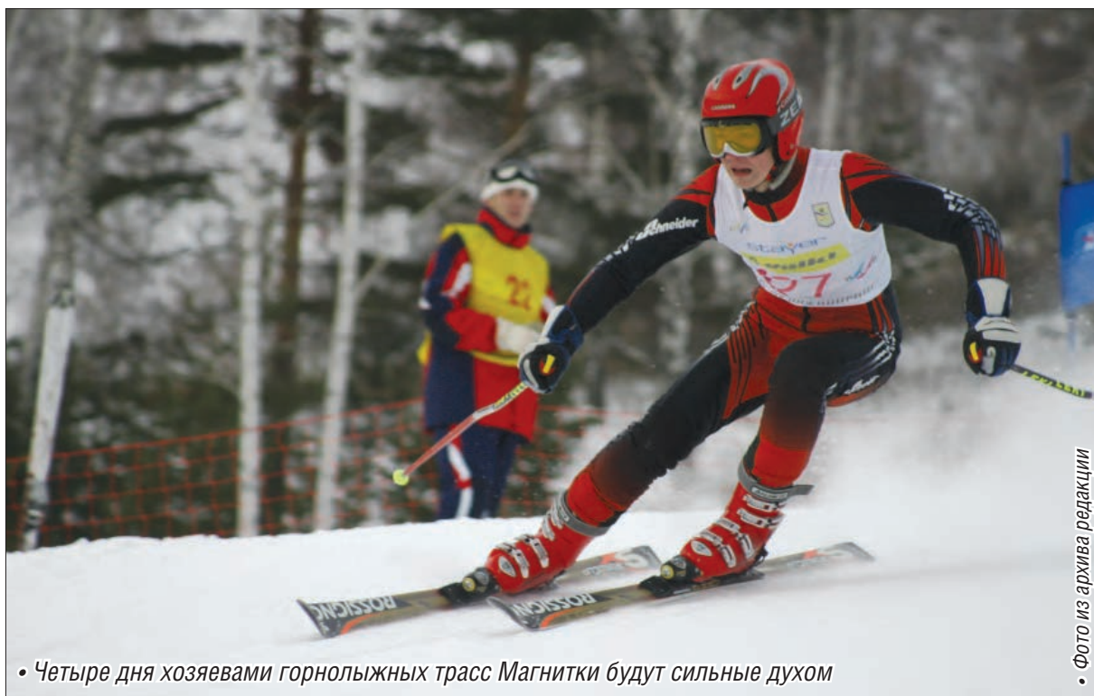
• Четыре дня хозяевами горнолыжных трасс Магнитки будут сильные духом