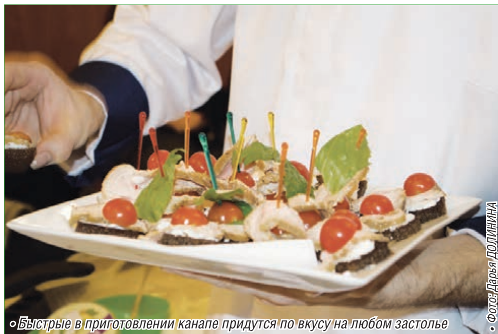
• Быстрые в приготовлении канопе придутся по вкусу на любом застолье

Для создания эффекта вакуума филе птицы можно плотно, не допуская попада-