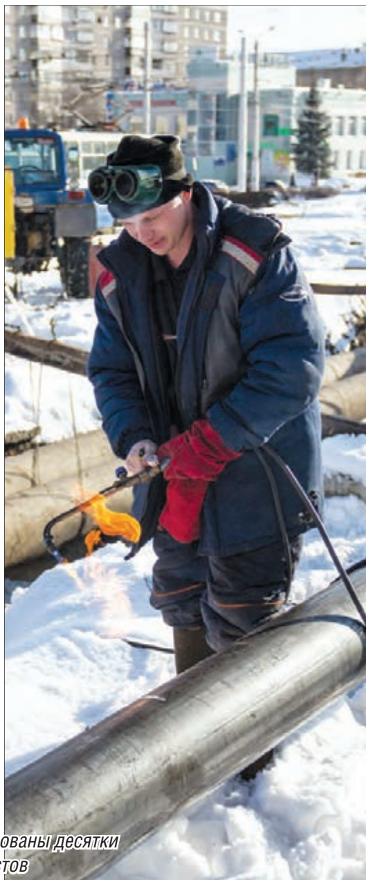
В реконструкции перекрёстка задействованы десятки высококвалифицированных специалистов