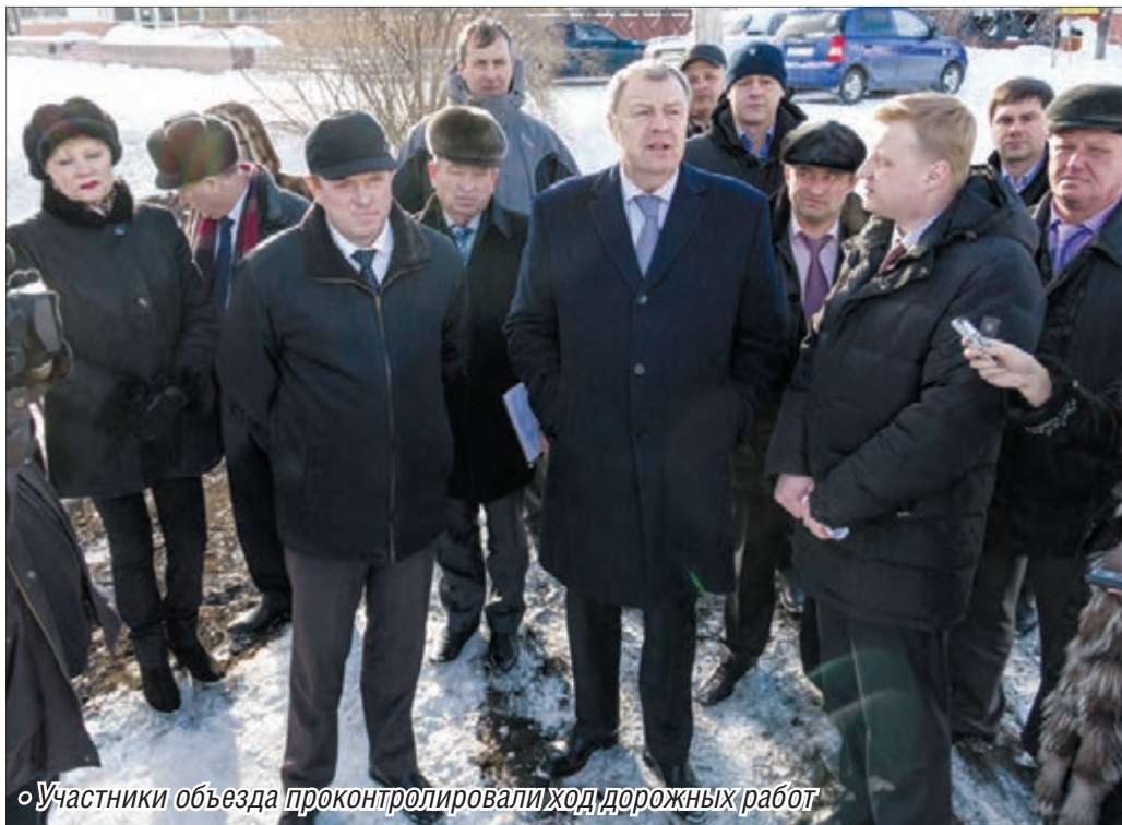
Участники объезда проконтролировали ход дорожных работ