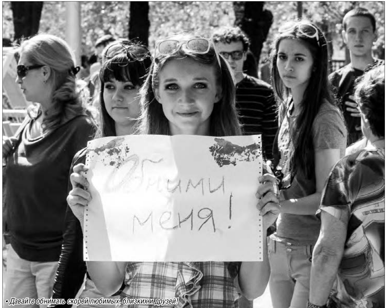
• Давайте обнимать скорей любимых, близких и друзей!

Чтобы чувствовать себя счастливым, человеку необходимо не менее пяти объятий в день