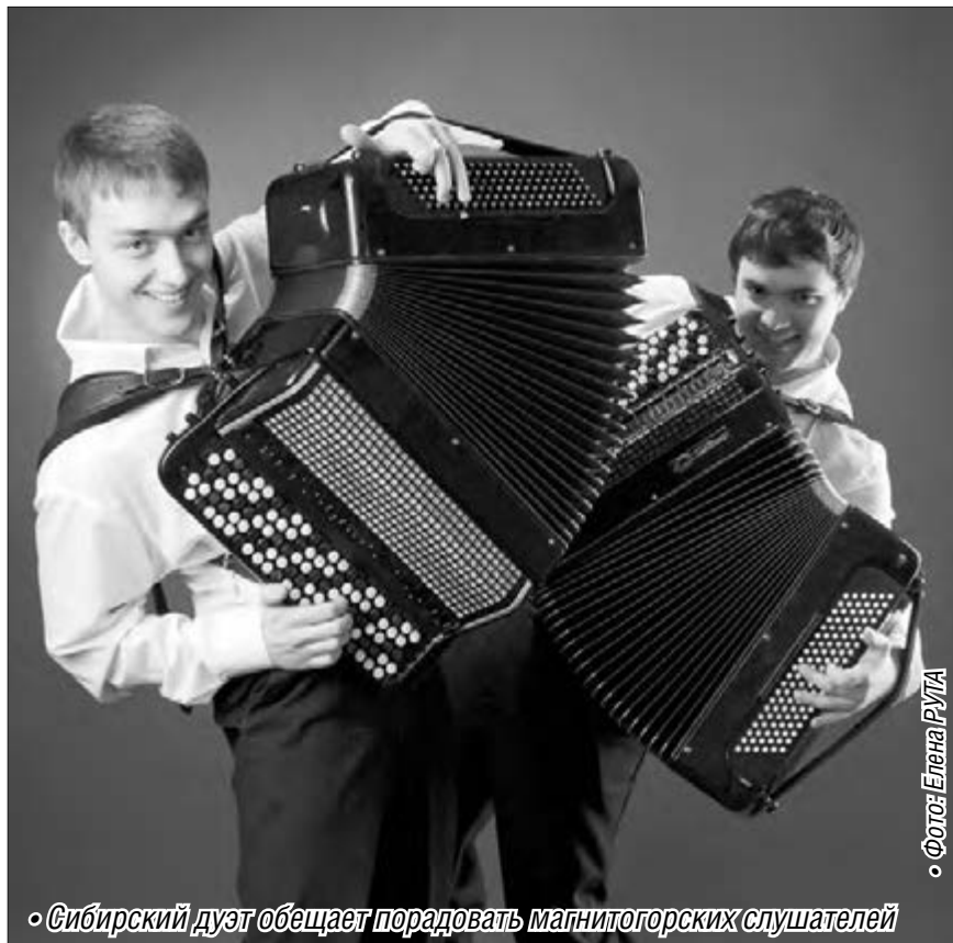
«Сибирский дуэт обещает порадовать магнитогорских слушателей»