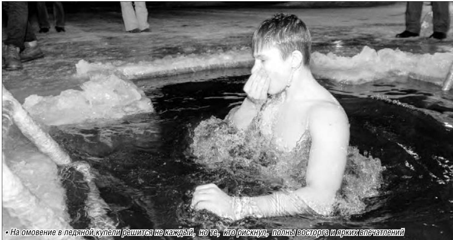
• На омовение в ледяной купели решится не каждый, но те, кто рискнул, полны восторга и ярких впечатлений

– Привыкли к комфорту, а тут приходится преодолеть себя, это не просто, – добавляет другой. – Зато ощущения не описать! В проруби аж дыхание перехватывает, тело словно тысячи иголок пронзают.