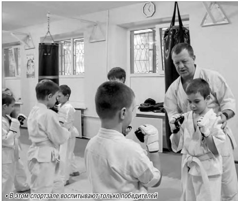
• В этом спортзале воспитывают только победителей

Сегодня в областной организации занимаются около 600 человек из разных городов региона – Челябинска, Магнитогорска, Миасса, Сатки, Коркино, Троицка, поселка Чесма, города Сибай (Башкортостан). Тренерский состав в количестве 20 человек ежегодно подготавливает победителей и