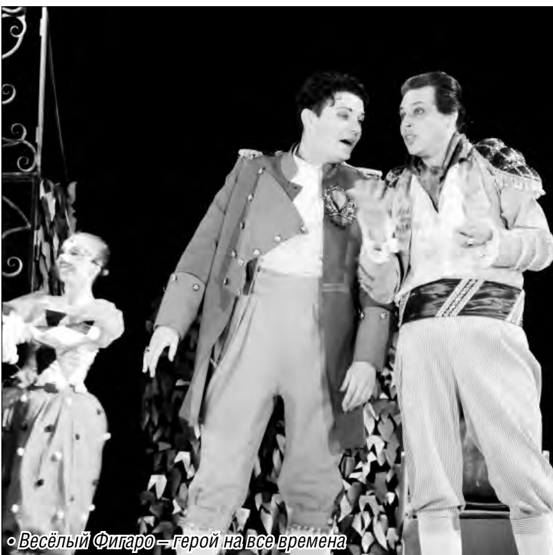
• Весёлый Фигаро – герой на все времена