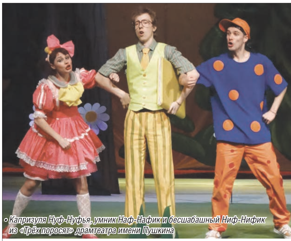
«Капризуля Нуф-Нуфья, умник Наф-Нафик и бесшабашный Ниф-Нифик из «Трёх поросят» драмтеатра имени Пушкина

Во время зимних каникул магнитогорским ребятишкам не пришлось скучать