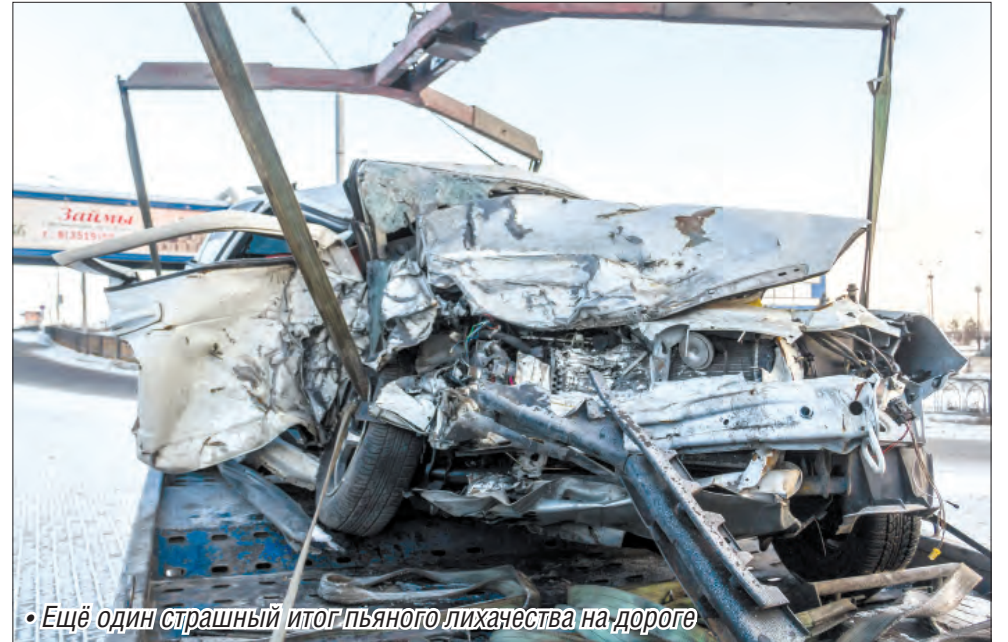
• Ещё один страшный итог пьяного лихачества на дороге