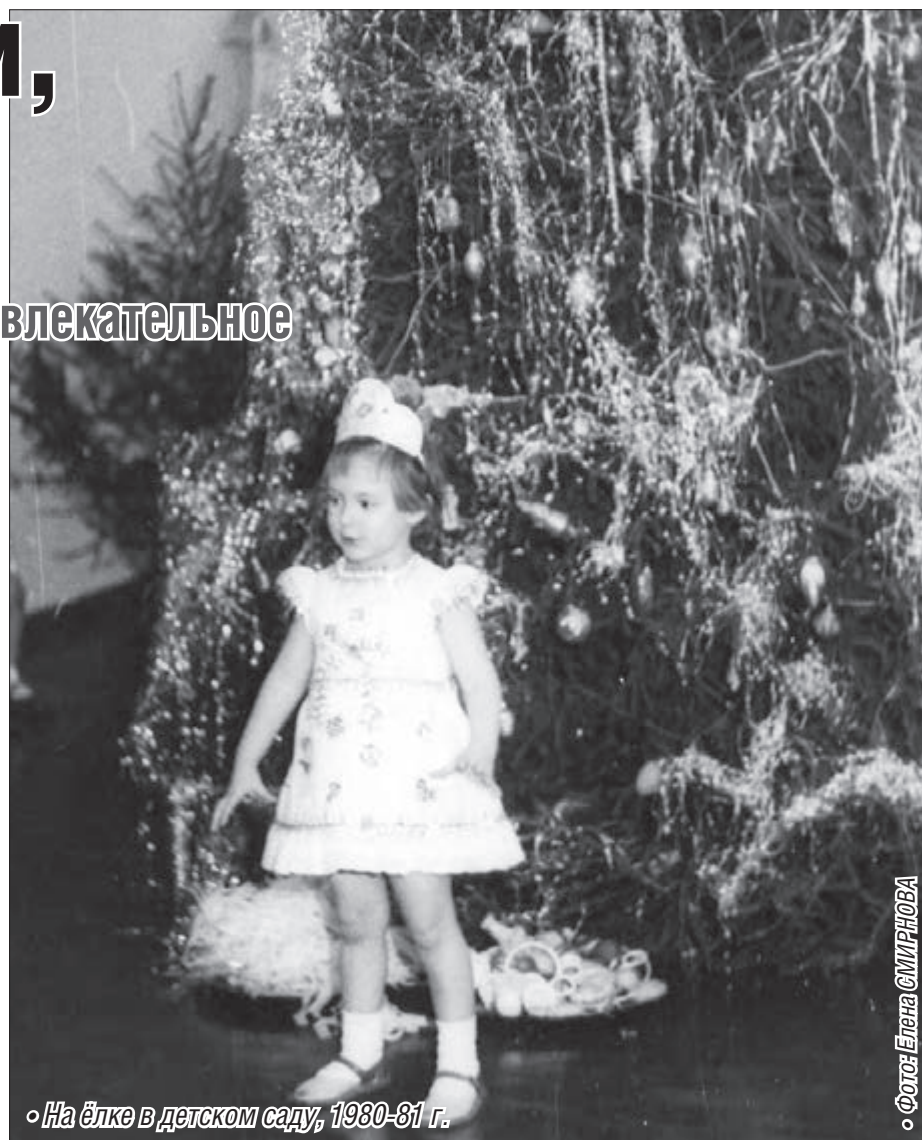
На ёлке в детском саду, 1980-81 г.