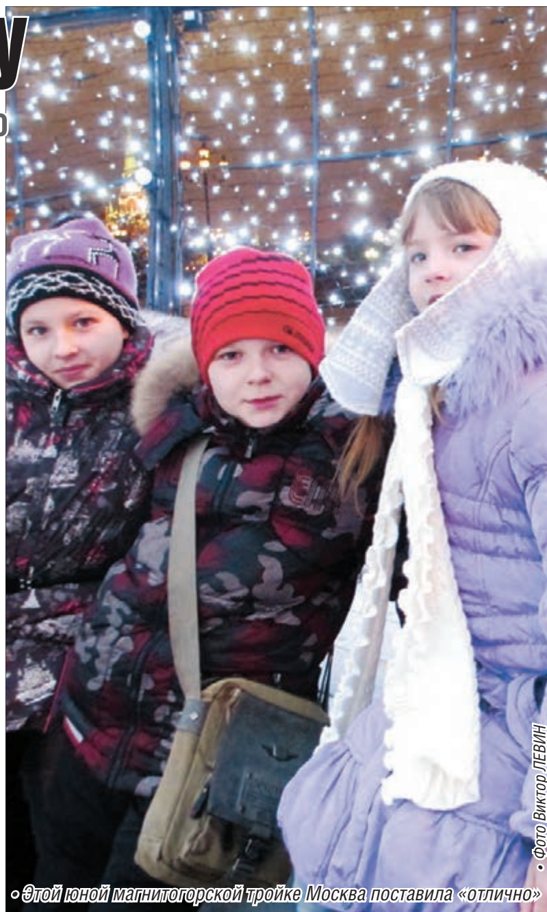
«Этой юной магнитогорской тройке Москва поставила «отлично»