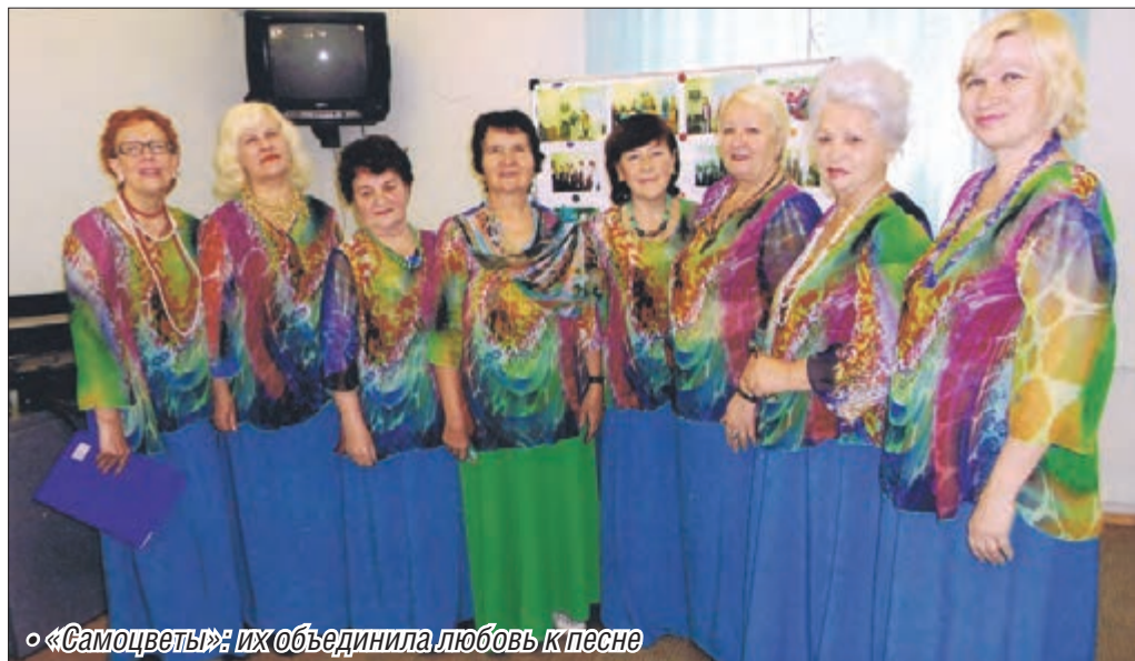
«Самоцветы»: их объединила любовь к песне