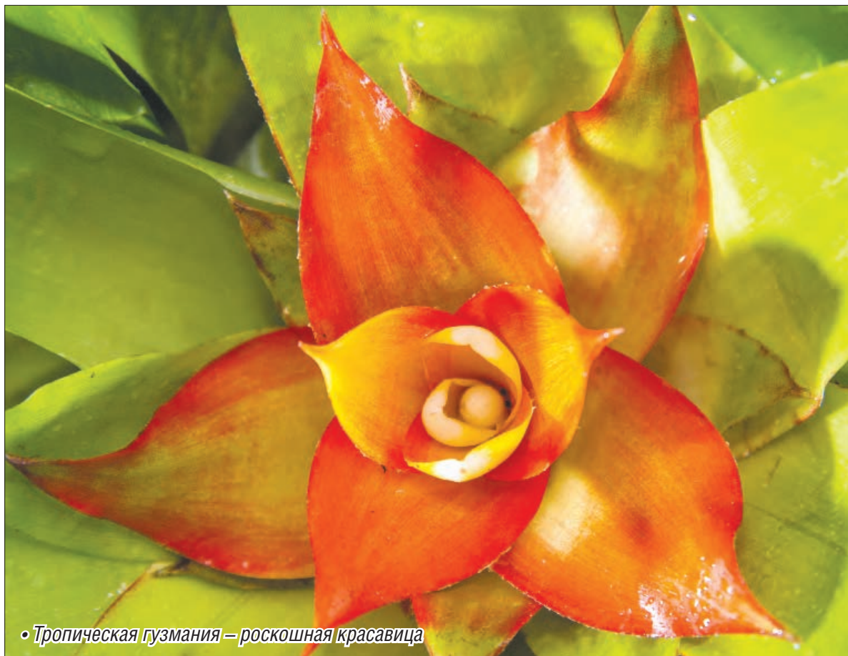
• Тропическая гузмания – роскошная красавица

Залог успешного выращивания бромелевых – правильный полив. Так как в природе растение лишено обильного полива (ведь на стволах деревьев много не «попьешь»), гузмания нашла способ собирать влагу. Дождевая вода стекает по гладким листьям, растущим розеткой, в самый центр растения, где и накапливается, словно в резервуаре. Эти запасы служат цветку не только источником влаги, но и «базой» для подкормки. В таких мини-резервуарах поселяются животные, насекомые, древесные лягушки и комары откладывают там свои личинки. Подобному соседству гузмания очень даже рада. Ведь продукты жизнедеятельности животных служат ей кормом.