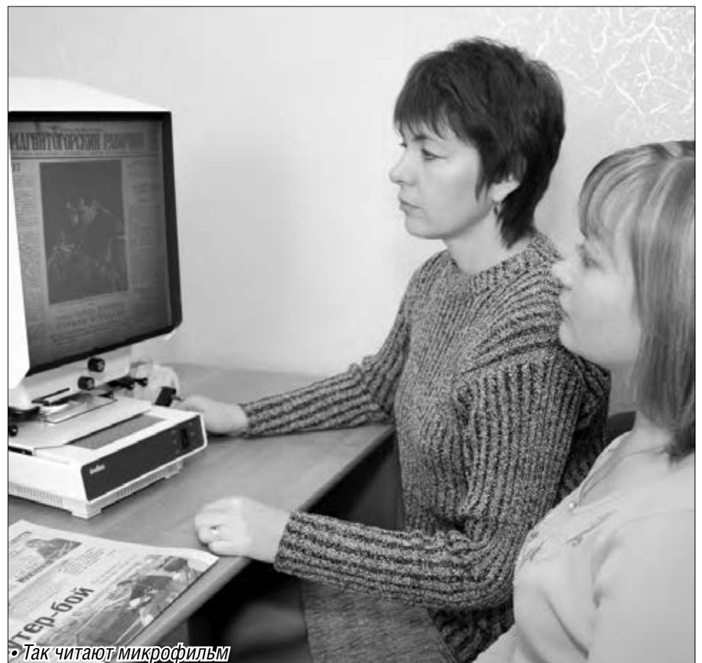
• Так читают микрофильм