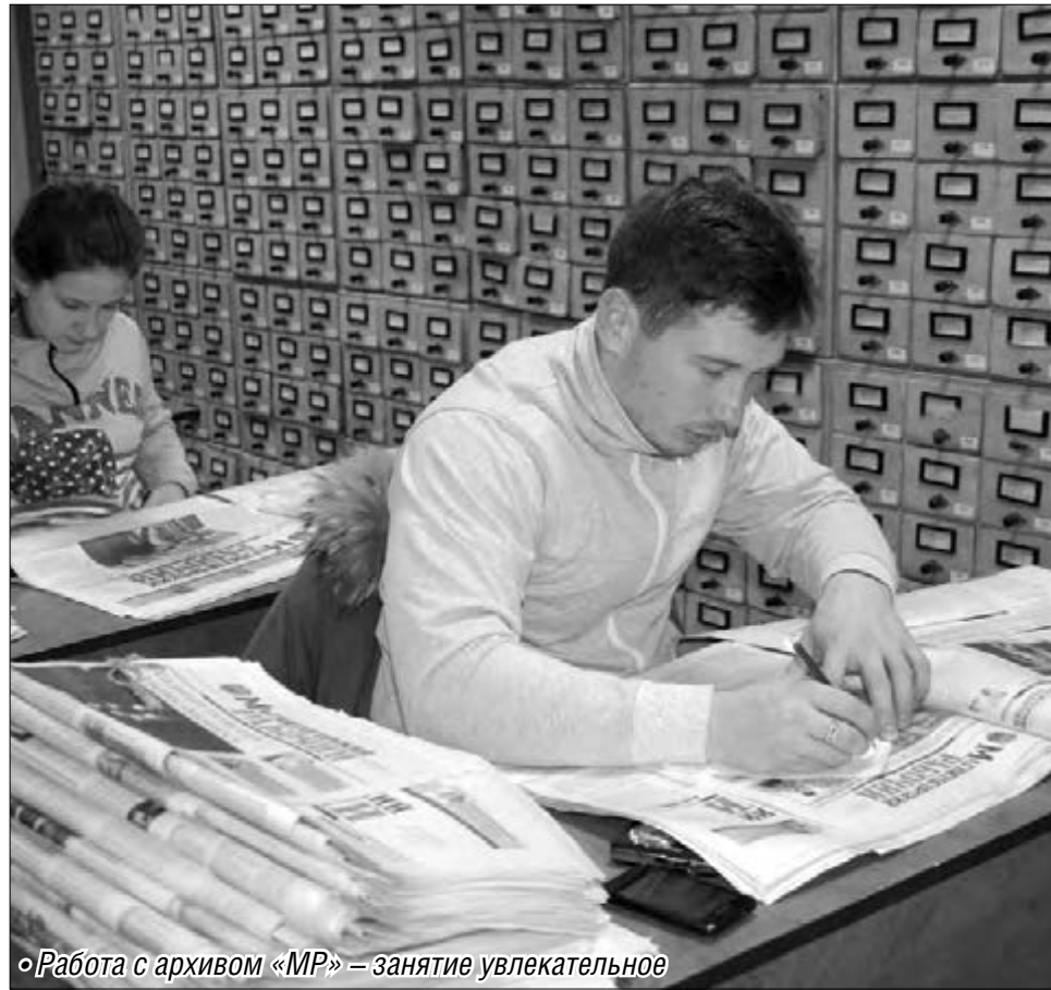
• Работа с архивом «МР» – занятие увлекательное

Центральная городская библиотека имени Ручьева – главная хранилища наследия нашей газеты. Подробная летопись жизни Магнитогорска с первых дней его истории собрана в подшивках «Магнитогорского рабочего» за 85 лет. К сожалению, бумага недолговечна. Сохранить «память прожитых лет» помогают современные технологии.