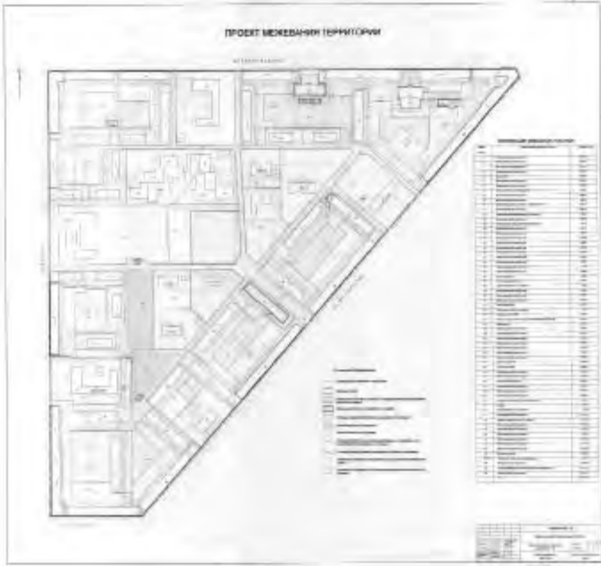
Приложение к постановлению администрации города от 24.12.2014 №18835-П