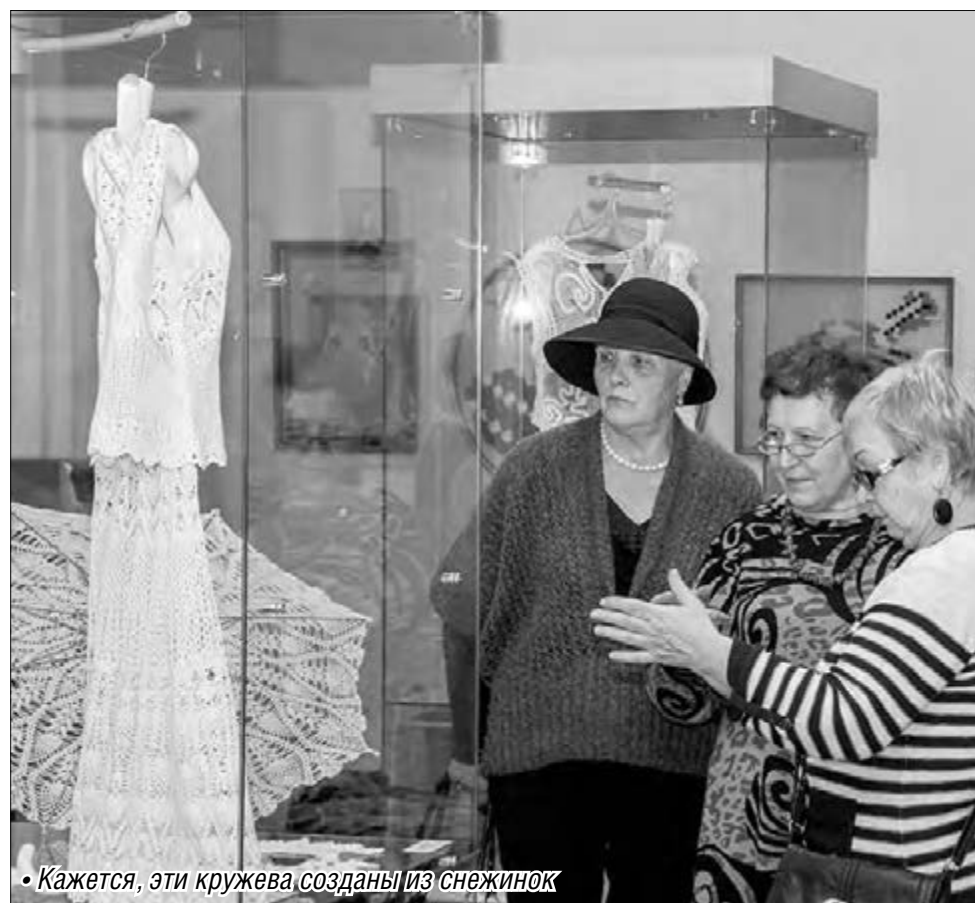
• Кажется, эти кружева созданы из снежинок

В картинной галерее открылась выставка, согревающая сердца