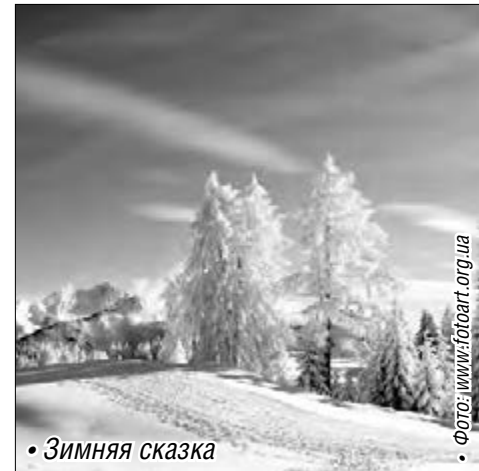
• Зимняя сказка

Напомним, телефон вызова экстренных служб един для всех мобильных операторов области. В случае необходимости нужно набрать 112, звонок бесплатный.