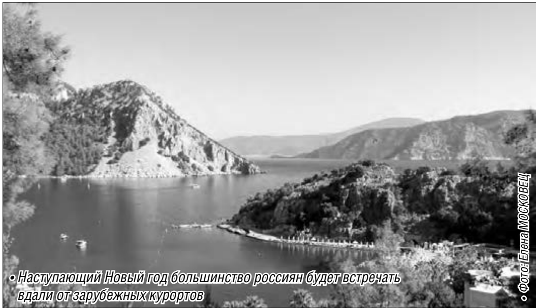
• Наступающий Новый год большинство россиян будет встречать вдали от зарубежных курортов

Уходящий год для туристической отрасли стал очень напряжённым