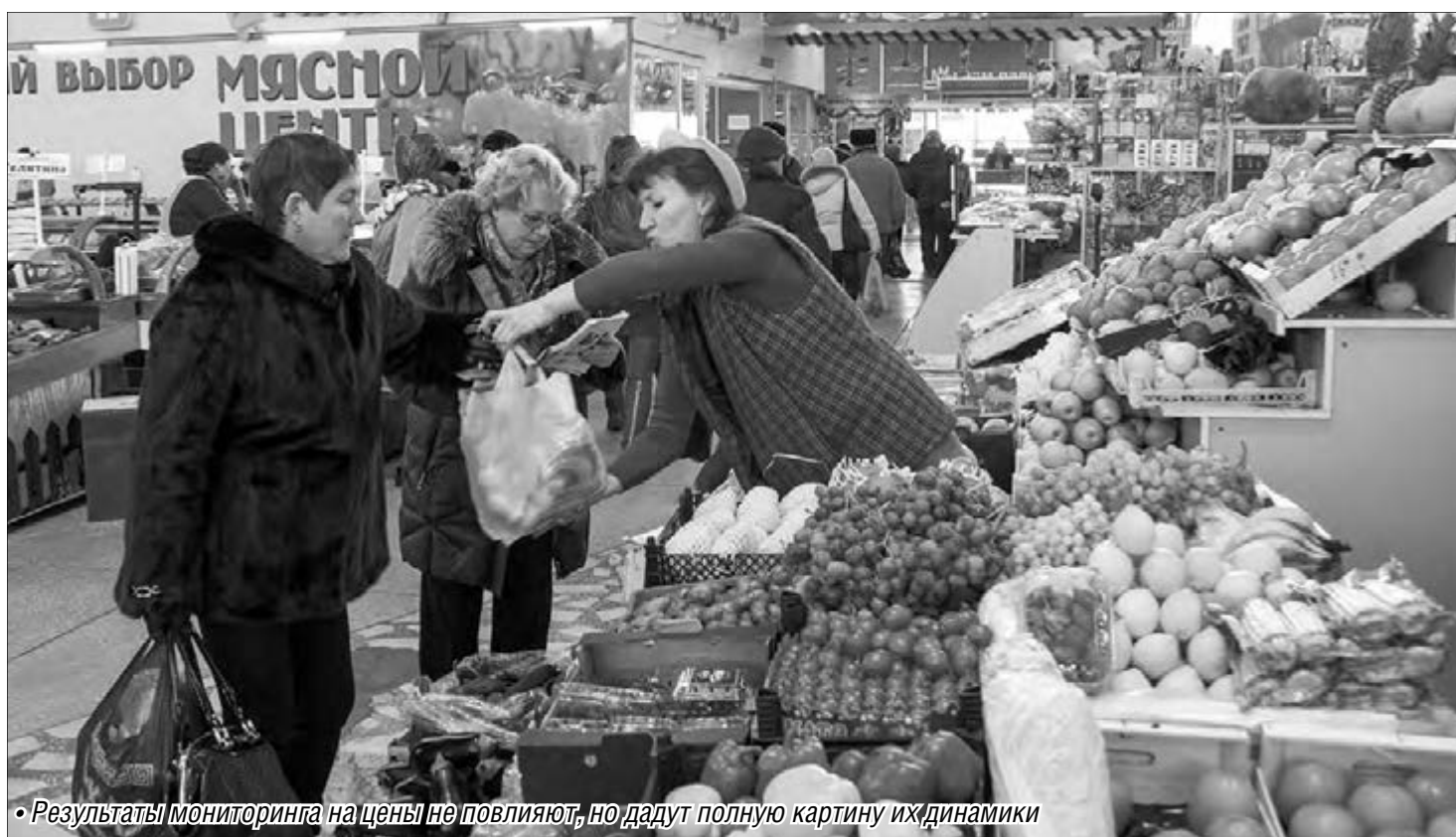
• Результаты мониторинга на цены не повлияют, но дадут полную картину их динамики

Данные о ценах на основные продукты питания в Магнитогорске лягут на стол губернатора