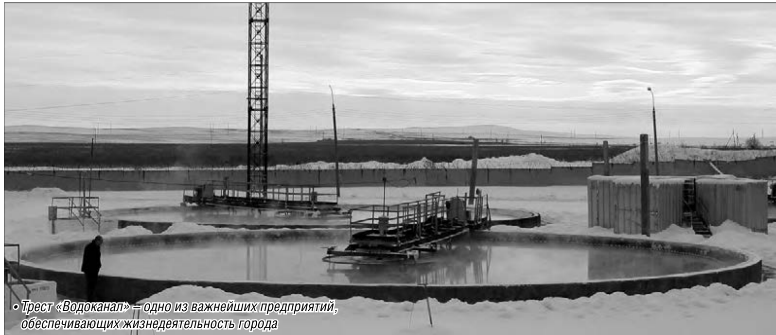
• Трест «Водоканал» – одно из важнейших предприятий, обеспечивающих жизнедеятельность города