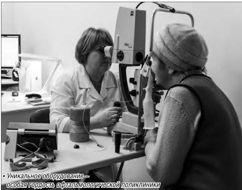
• Уникальное оборудование — особая гордость офтальмологической поликлиники

В зоне внимания градоначальника были вновь открытые дневной стационар поликлиники №1 городской больницы №2 и специализированная поликлиника АНО «Центральная медико-санитарная часть», оснащенная уникальным офтальмологическим оборудованием.