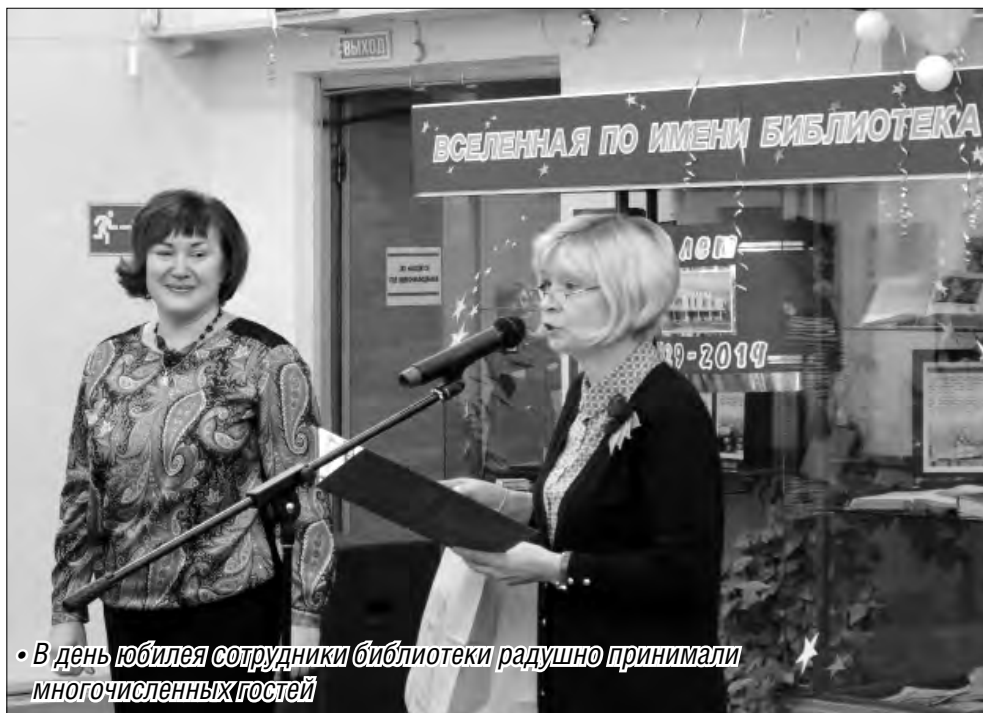
• В день юбилея сотрудники библиотеки радушно принимали многочисленных гостей

Первое место в областном конкурсе – не единственное достижение Центральной библиотеки в юбилейный год. Объединение городских библиотек стало победителем регионального этапа конкурса лучших социально ориентированных проектов некоммерческих организаций «Содействие-2014»,