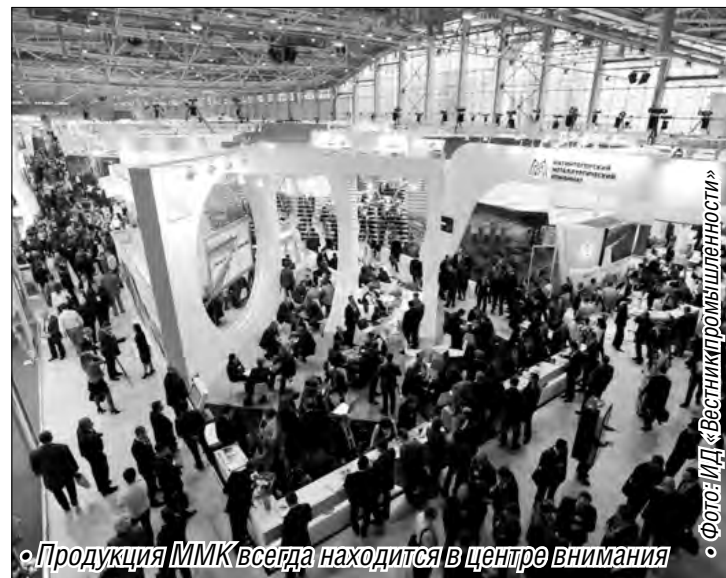
• Продукция ММК всегда находится в центре внимания

В связи с увеличением потребления оцинкованного проката наибольшее значение приобретает производство проката с высшим качеством отделки поверхности для изготовления лицевого деталей автомобилей. Выполнение этой задачи в ОАО «ММК» подтверждается положительными результатами переработки такого проката у иностранных OEM, а также размещение ежемесячных заказов от ведущих российских авто-