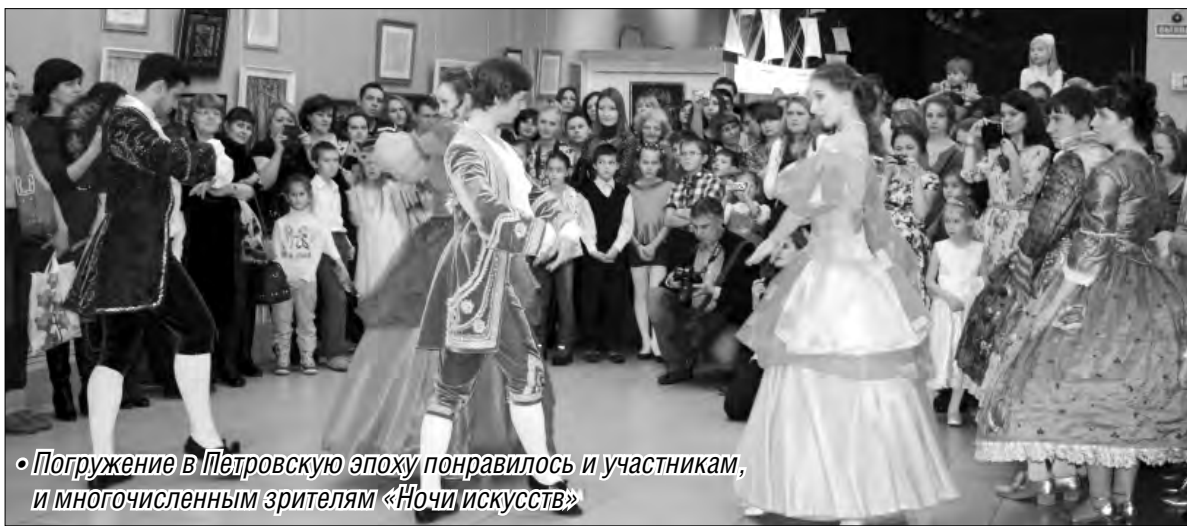
• Погружение в Петровскую эпоху понравилось и участникам, и многочисленным зрителям «Ночи искусств»

Одним из развлечений стало музейное ориентирование «По-