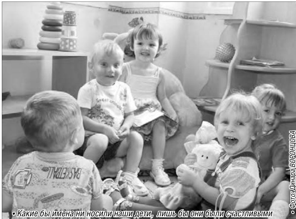
Какие бы имена ни носили наши дети, лишь бы они были счастливыми

Имя Александр с начала двадцатого века было действительно народным. Если в девятнадцатом и начале двадцатого века оно считалось вторым после Ивана и популярным скорее у дворян, в крайнем случае, купцов, то в пятидесятые годы прошлого века