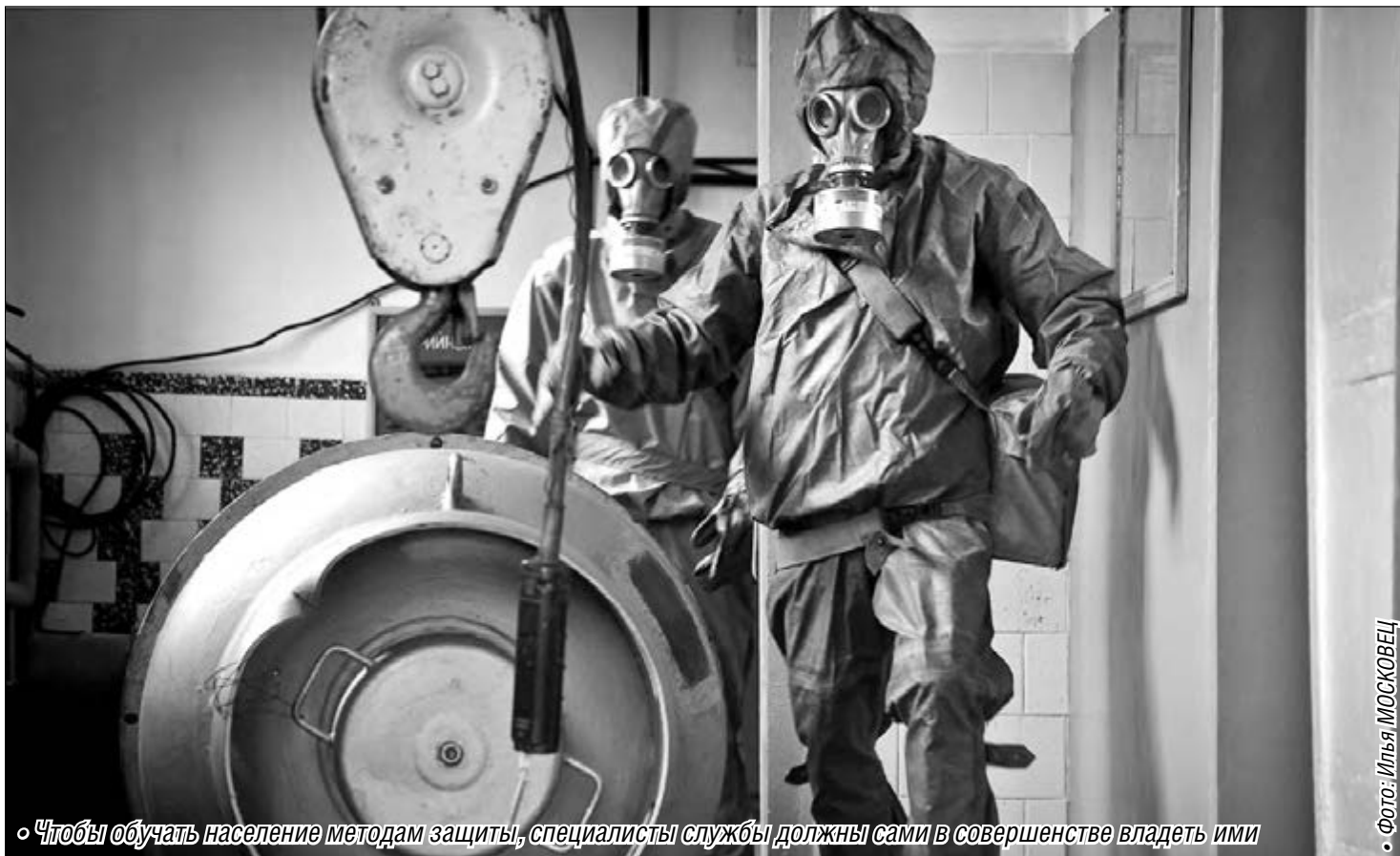
Чтобы обучать население методам защиты, специалисты службы должны сами в совершенстве владеть ими

Служба гражданской защиты населения отметила 65-летие