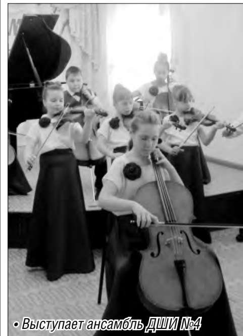
• Выступает ансамбль ДШИ №4