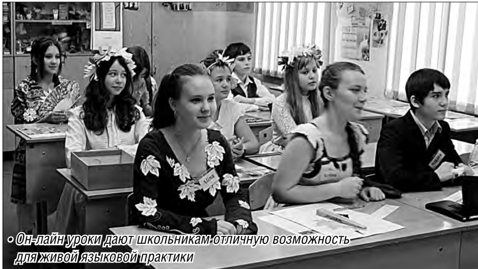
• Он-лайн уроки дают школьникам отличную возможность для живой языковой практики

На этот вопрос школьники из немецкого Бранденбурга теперь могут ответить по-русски