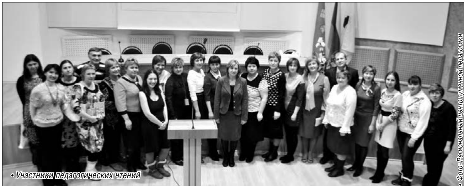
• Участники педагогических чтений

• Фото: Региональный центр гуманитарной педагогики