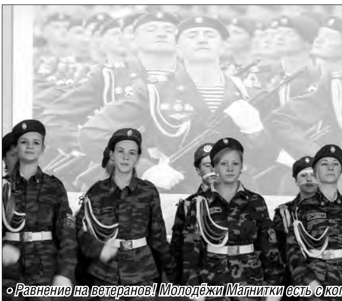
«Равнение на ветеранов! Молодежи Магнитки есть с кого брать пример»