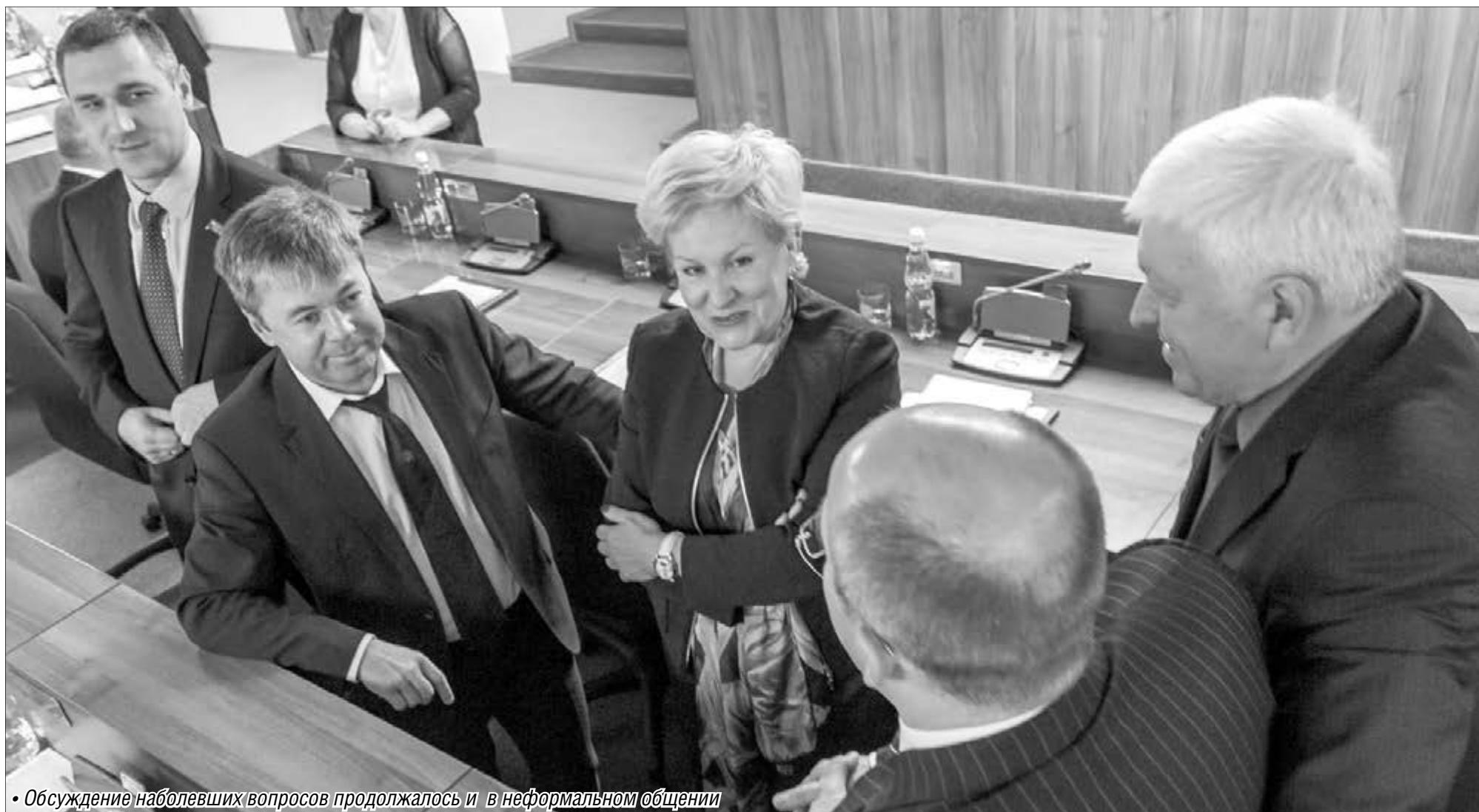
• Обсуждение набравших вопросов продолжалось и в неформальном общении

На октябрьском заседании депутаты городского Собрания принимали непростые решения