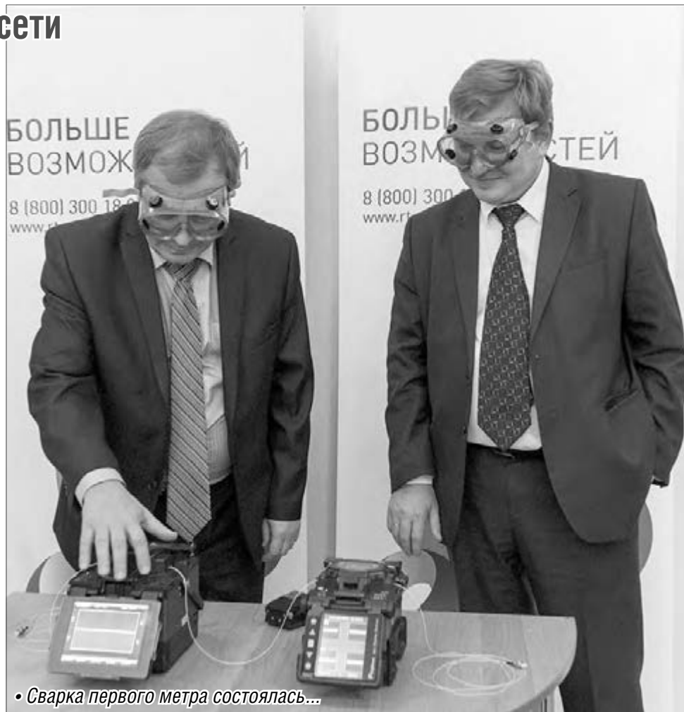
• Сварка первого метра состоялась...

Разрезать красную ленточку на сей раз не стали. Вместо этого использовали новую, современную «технология торжественного пуска в эксплуатацию». Заместителю главы предложили поучаствовать в символической сварке первого метра будущих волоконно-оптических сетей. Надо было лишь водрузить на переносицу защитные очки и надавить на пусковую