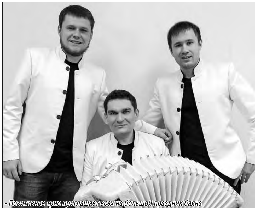
• Позитивное трио приглашает всех на большой праздник баяна

В программе «На все времена» – как любимые поклонникам трио хиты, так и множество новых композиций. Концерт условно разделен на «времена года» – под настроение каждого сезона подобрана своя музыка. Но не только поэтому программа названа «На все времена». В нее включены по-настоящему бессмертные произведения