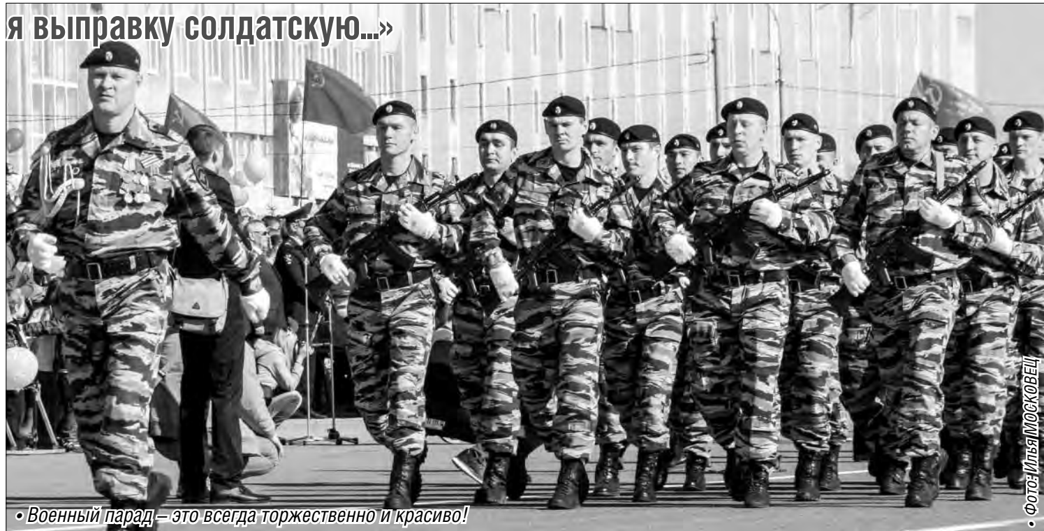
• Военный парад – это всегда торжественно и красиво!

У службистов всех времен попасть в список «парадников» считалось большой честью. Лишиться же права оказаться среди участников парада – огорчение. Так велика тяга служивого блеснуть на торжественном марше. При подготовке «парадников» за месяц до торжества на полигонах ежеднев-