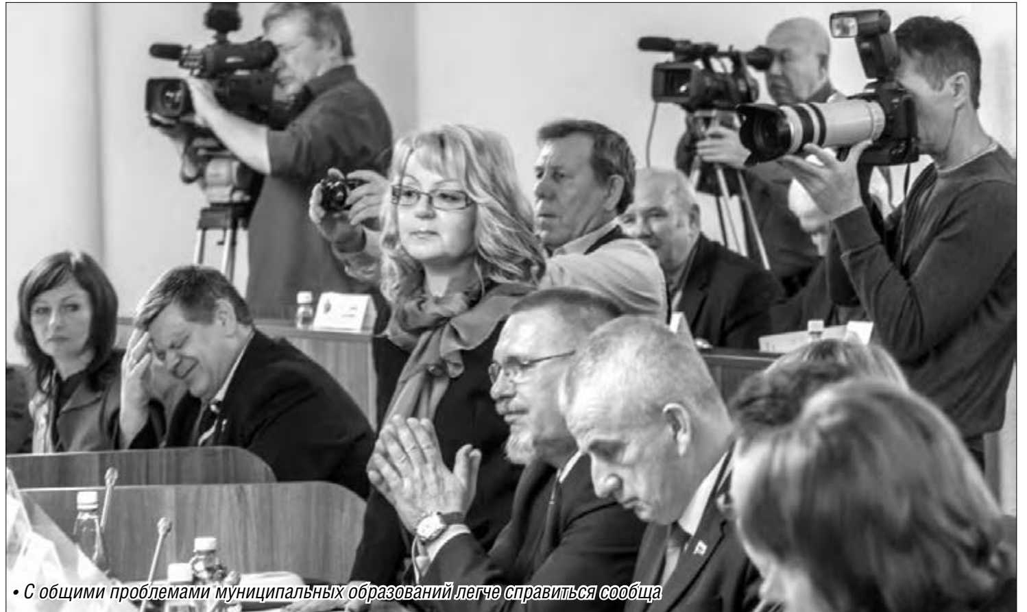
• С общими проблемами муниципальных образований легче справиться сообща

Магнитогорск принимает руководителей муниципалитетов со всей страны