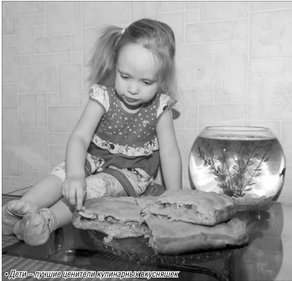
• Дети – лучшие ценители кулинарных вкусняшек

время расстаиваться. В это время готовится начинка.