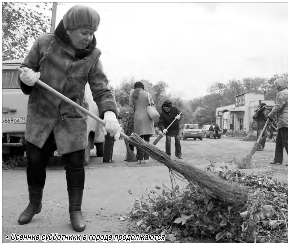
• Осенние субботники в городе продолжаются

Зимний сезон город встретит в полной готовности