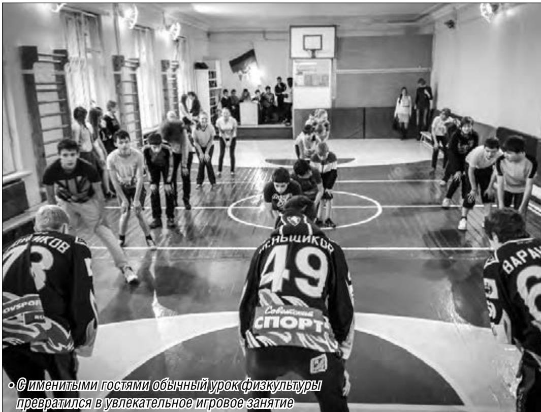
«Именитыми гостями» обычный урок физкультуры превратился в увлекательное игровое занятие

Хоккеисты молодёжной команды «Стальные лисы» провели в школе №55 урок физкультуры