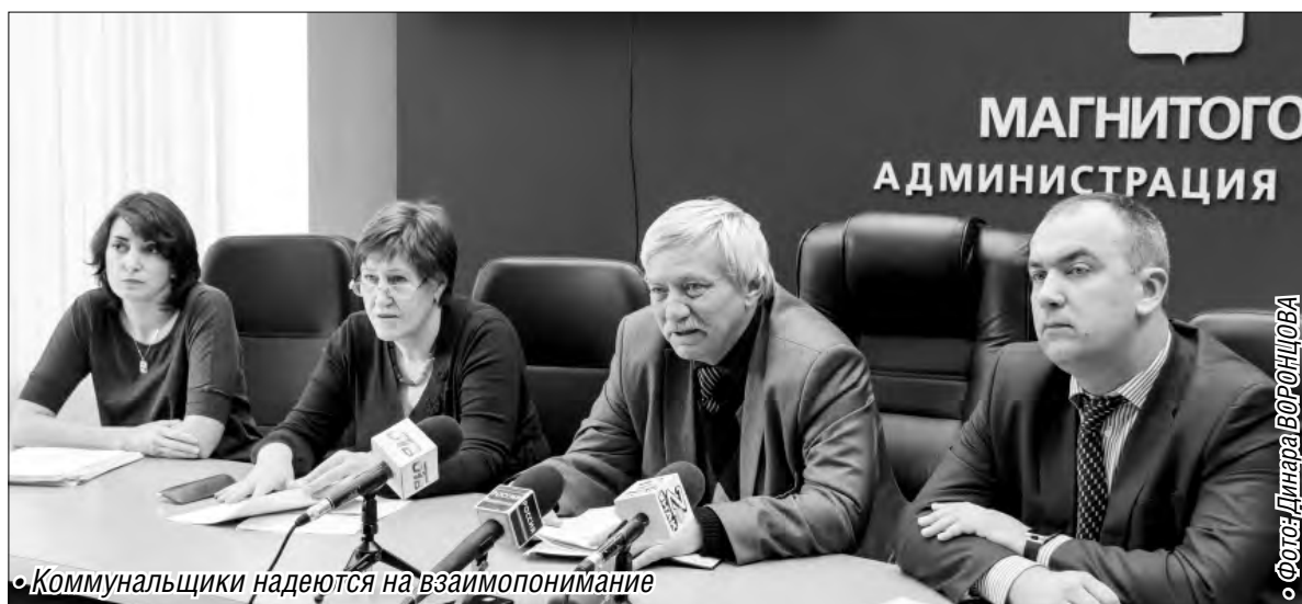
• Коммунальщики надеются на взаимопонимание

Перерасчет коснется только тех домов, где установлены общие приборы учета. А происходит это вот по какой причине: согласно законодательству в отопительный сезон даже при наличии измерительных тепловых приборов жильцы оплачивают отопление по установленному тарифу. Затем контролеры снимают показания счетчика и производят корректировку. В результате какие-то дома потребили больше тепла, какие-то – меньше. Из-за этого части собственников возвращают средства, а другая часть вынуждена доплачивать. К примеру, за отопительный сезон 2011-2012 годов уже в 2013 го-