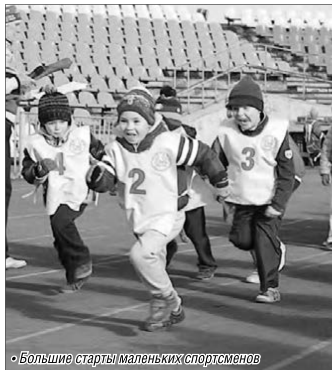
• Большие старты маленьких спортсменов

В итоге первое место в кроссе «Золотая осень» заняла команда детского сада №165 (Орджоникидзевский район), второе – ребята из детского сада №116, третье – из детского сада №21 (Ленинский район). Команды-победители и призеры получили в награду мячи, скакалки, настольные игры, обручи и другой спортивный инвентарь, всем командам-участницам вручили сладкие призы и бесплатную фотопрографию на память.