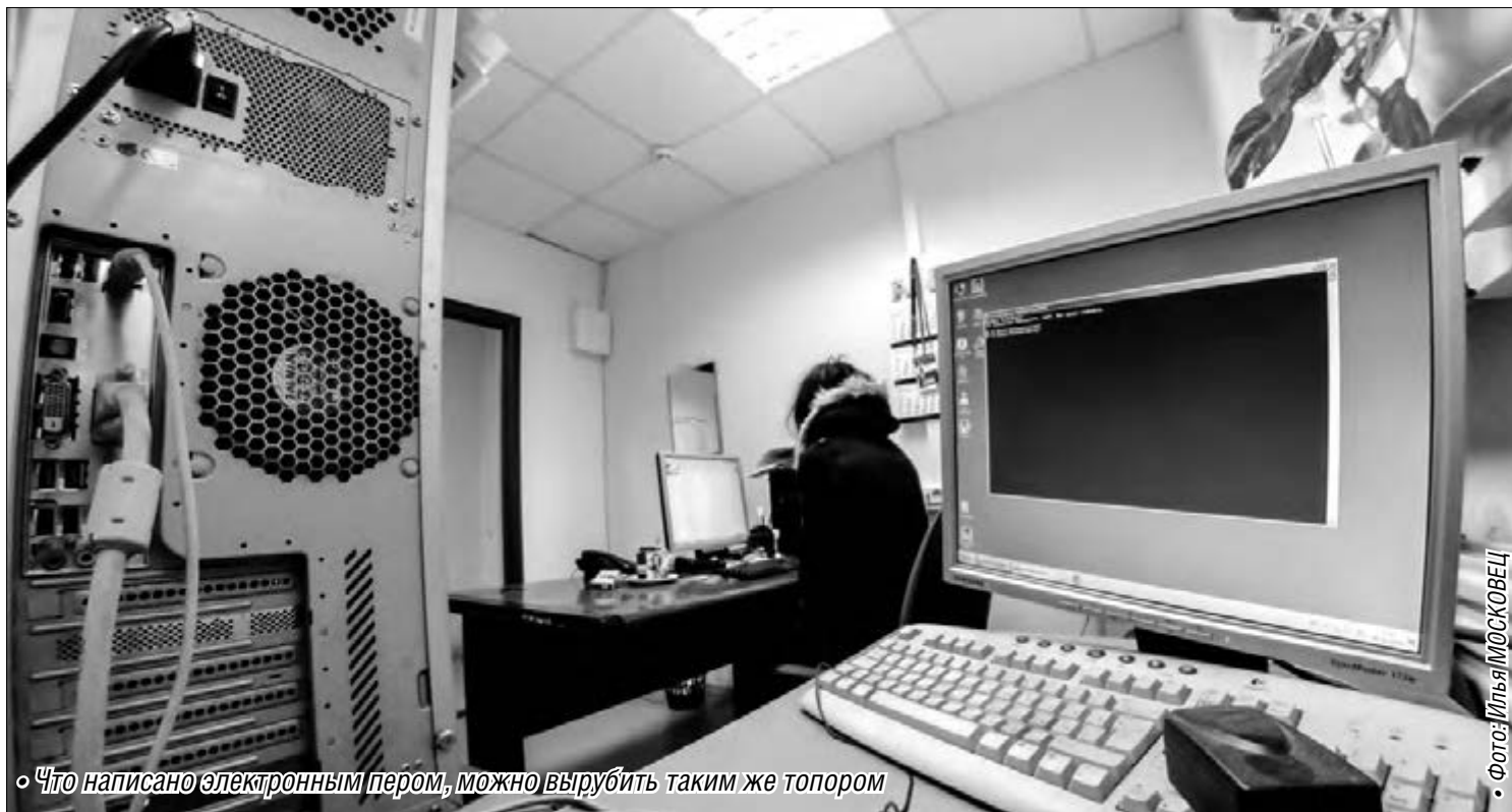
• Что написано электронным пером, можно вырубить таким же топором

Хакеры всё чаще хозяйничают на страницах электронных СМИ