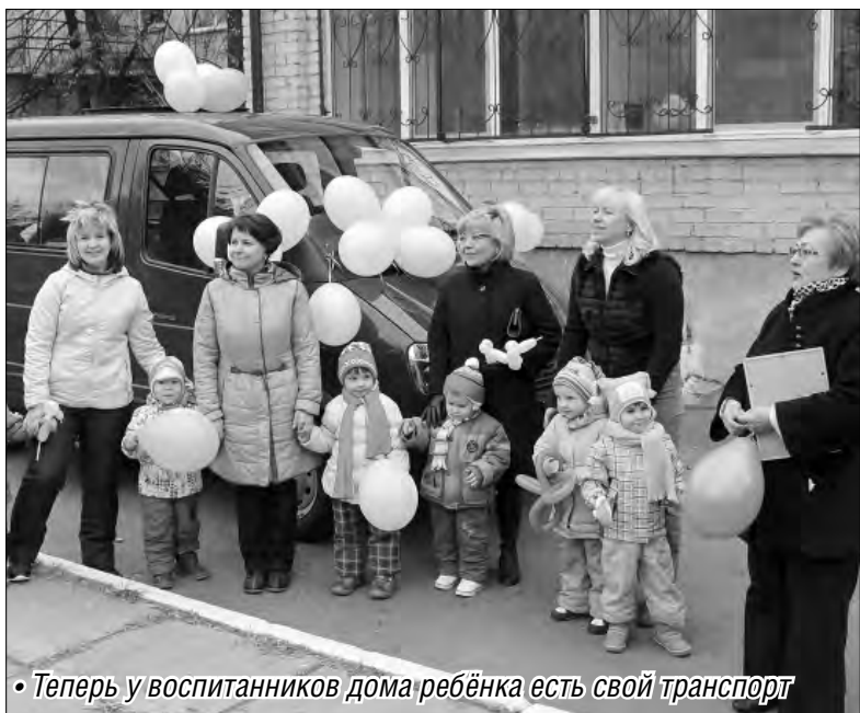
• Теперь у воспитанников дома ребёнка есть свой транспорт