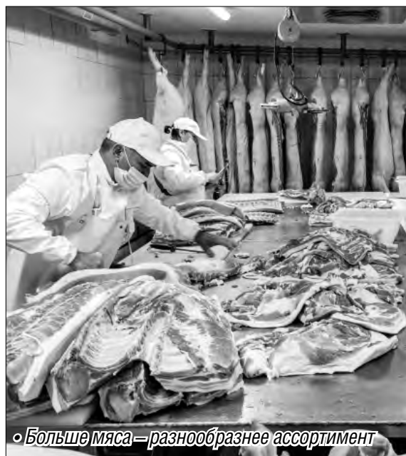
Больше мяса – разнообразнее ассортимент