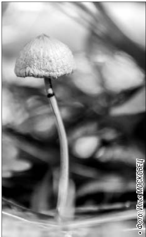
• Фото: Илья МОСКОВЕЦ

20000/3 = 6666,67 – во столько раз меньше перегрузки испытывает космонавт при старте ракеты, чем споры пиллоботуса, выбрасываемые из гриба.