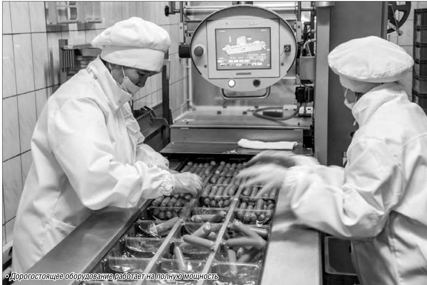
Дорогостоящее оборудование работает на полную мощность

Власти всех уровней всё внимательней следят за положением дел в пищевой отрасли