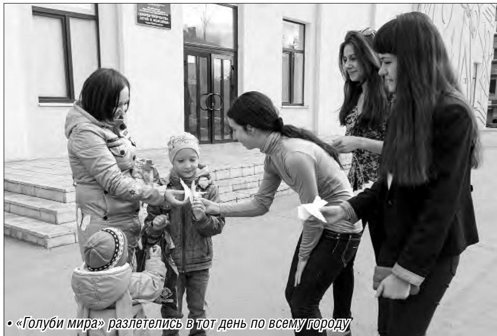
• «Голуби мира» разлетелись в тот день по всему городу

Ежегодно юные парламентарии проводят не менее двух десятков акций, придумывают и успешно реализуют различные социально ориентированные проекты. Например, уже семь лет продолжается работа в формате программы «Возьмем за руки, друзья!», целью которой является конкретная помощь, эмоциональная и психологическая поддержка детей-инвалидов и де-