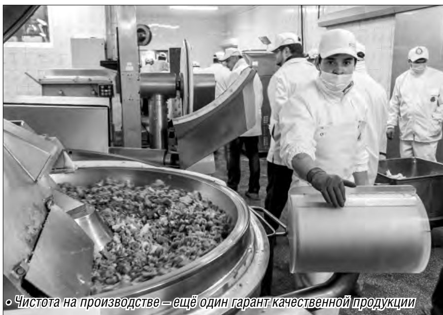
Чистота на производстве – ещё один гарант качественной продукции