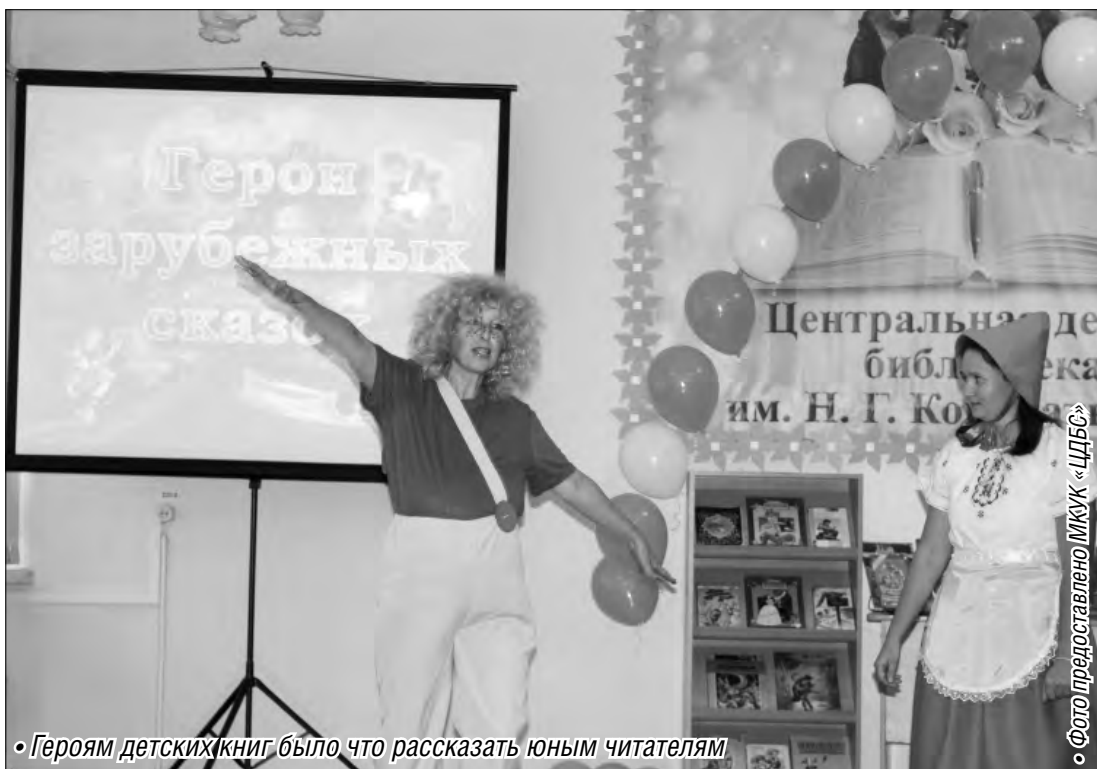
• Героям детских книг было что рассказать юным читателям

Конкурсные задания были приняты ребятами и их родителями с большим энтузиазмом. На электронные адреса детских библиотек города пришло около ста фотографий литературных героев. Дети в возрасте от трех до четырнадцати лет представили взорам жюри в образах отчаянного ковбоя, доктора Айболита, Шахерезады, Велико-го и Ужасного Гудвина, сестрицы Аленушки, богатыря Ильи Муромца, Маши и медведя и других. Лучшие снимки были представлены на фотовыставке в Центральной детской библиотеке имени Кондратовской и опубликованы на сайте детской библиотечной системы www.mag-lib.ru и на странице кон-