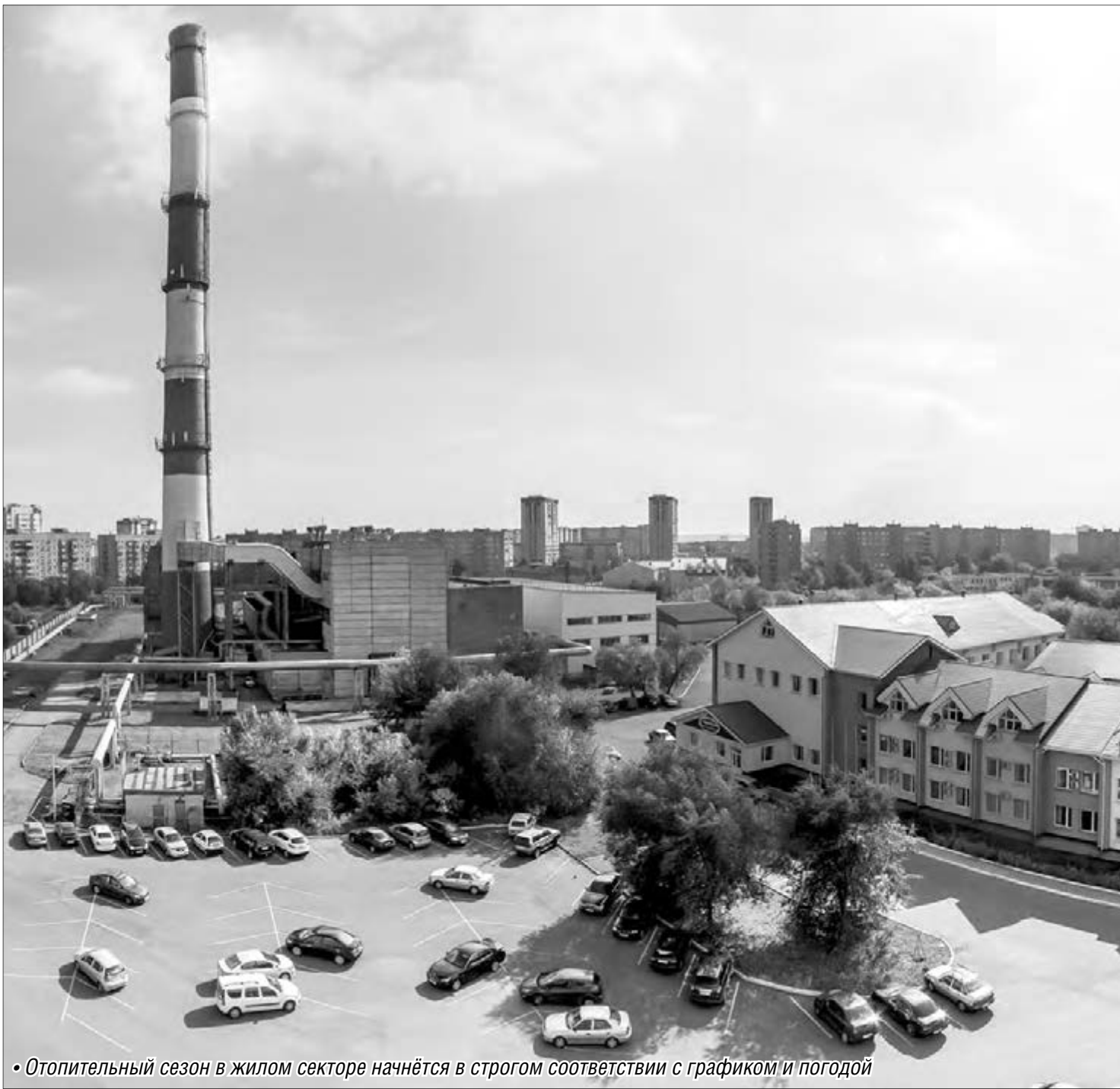
• Отопительный сезон в жилом секторе начнётся в строгом соответствии с графиком и погодой

Социальные учреждения Магнитогорска подключают к центральному отоплению, жилой фонд ждёт тепла