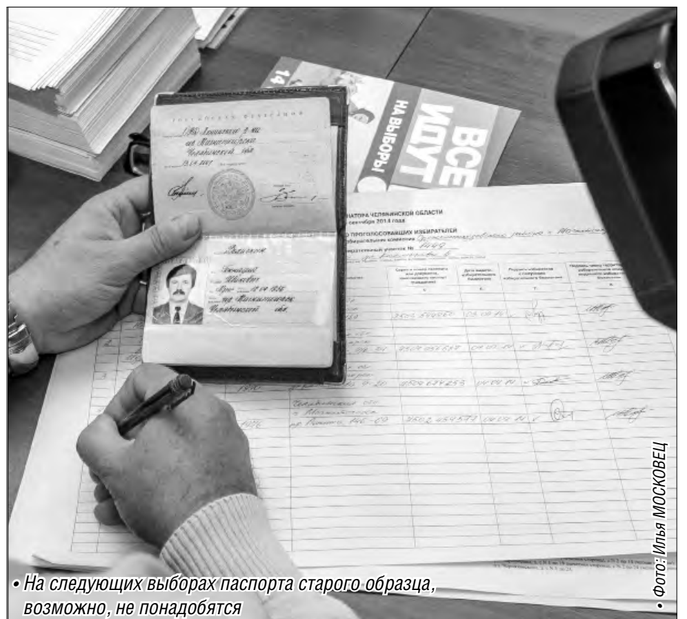
◦ На следующих выборах паспорта старого образца, возможно, не понадобятся

Кроме данных о гражданах России планируется включить и пункт о временной регистрации иностранцев. Проверить подлинность разрешений на пребывание в России станет проще, считают эксперты. Это позволит минимизировать незаконную миграцию. При внедрении глобальной системы «пробить», соответствует ли номер регистрации личности, которая ее предьявляет, будет легче. То есть «МИР» даст возмож-