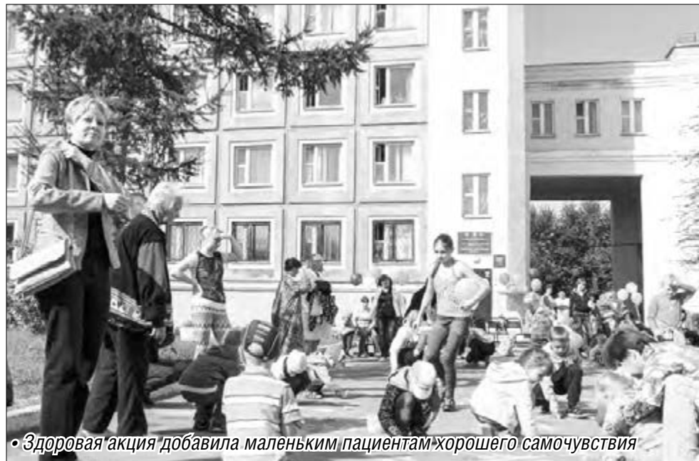
• Здоровая акция добавила маленьким пациентам хорошего самочувствия

Пока она объясняла суть да дело, на площадке перед корпусами стационара разворачивалось веселое действо. Клоуны собирали ребятишек – пациентов больницы в кучку, чтобы поиграть в веселые игры. Забавные конкурсы, вопросы на смекалку, связанные со знаниями у ребят правил здорового образа жизни, на эту же тему – ненавязчивые рассказы клоунов. И все под веселую музыку, движение и смех.