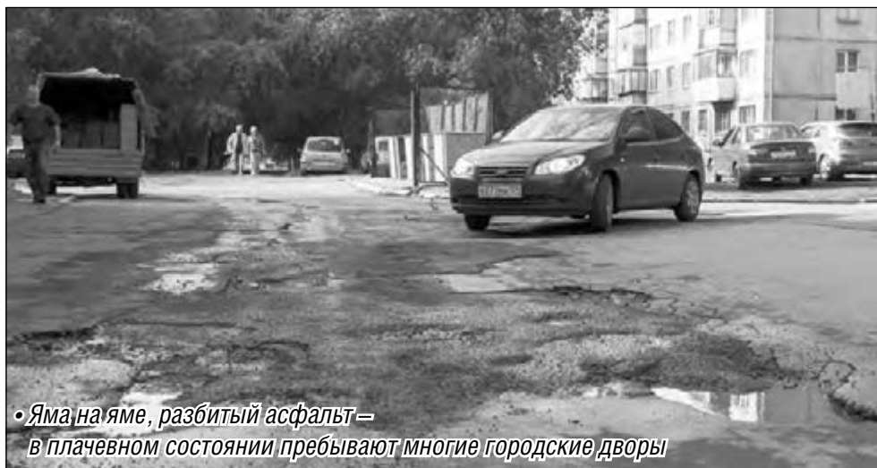
• Яма на яме, разбитый асфальт – в плачевном состоянии пребывают многие городские дворы

Можно ли заасфальтировать дворовые ямы жалобами?