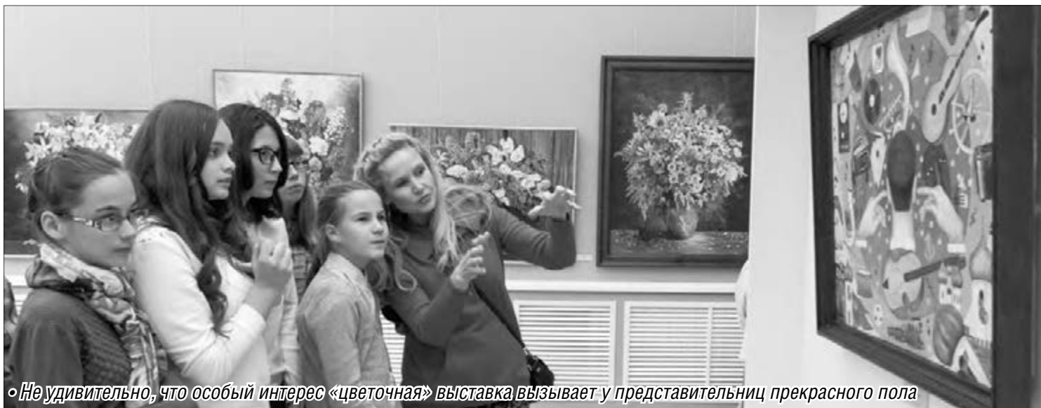
◦ Не удивительно, что особый интерес «цветочная» выставка вызывает у представительниц прекрасного пола