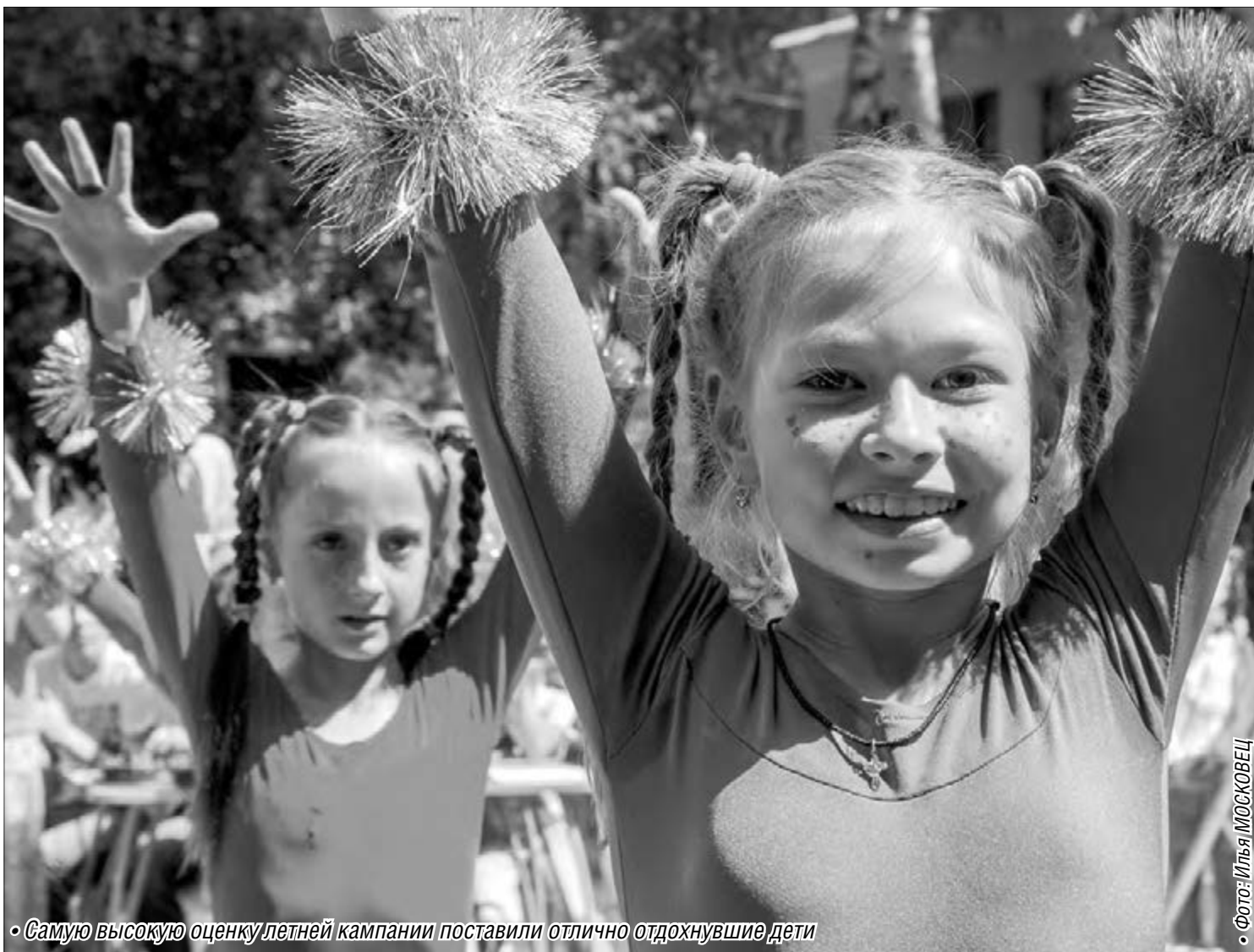
• Самую высокую оценку летней кампании поставили отлично отдохнувшие дети

Подводятся итоги летней детской оздоровительной кампании