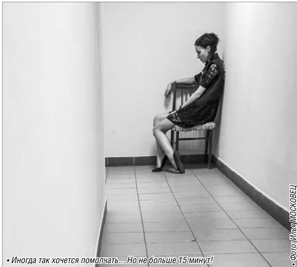
• Иногда так хочется помолчать... Но не больше 15 минут!