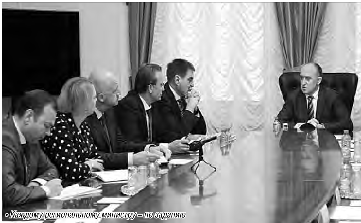
«Каждому региональному министру – по заданию»