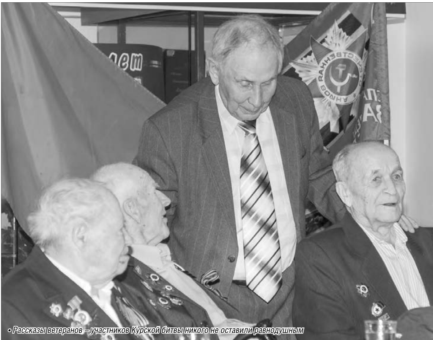
• Рассказы ветеранов – участников Курской битвы никого не оставили равнодушным

Магнитогорцы – участники Курской битвы поделились воспоминаниями с молодёжью