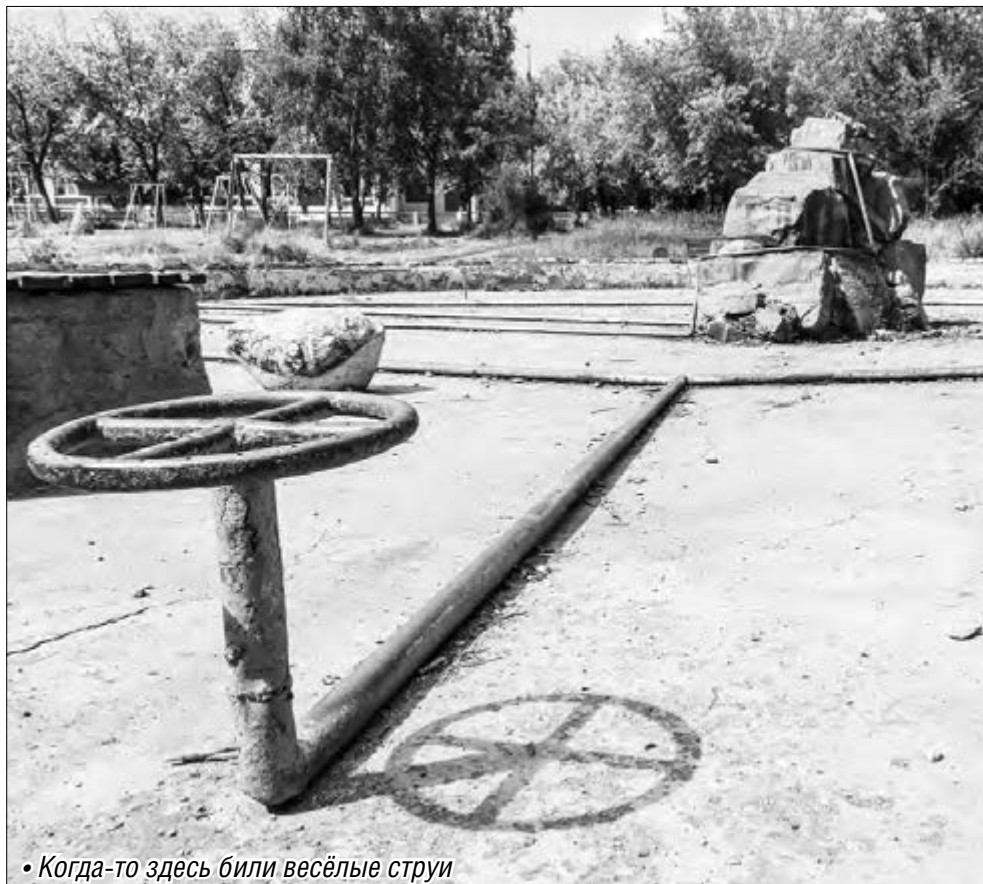
• Когда-то здесь били весёлые струи

нов. Это хорошо известные всем горожанам чаши на площади Народных гуляний, перед фасадом городской администрации, возле драмтеатра имени Пушкина, на проспекте Metallургов, в сквере имени Георгия Димитрова, возле Дворца культуры имени Серго Орджоникидзе и другие. Остальные фонтаны города никто не обслуживает. На них нет ни задания, ни денег, ни воды, ни электроэнергии – ничего. Иногда некоторые малые