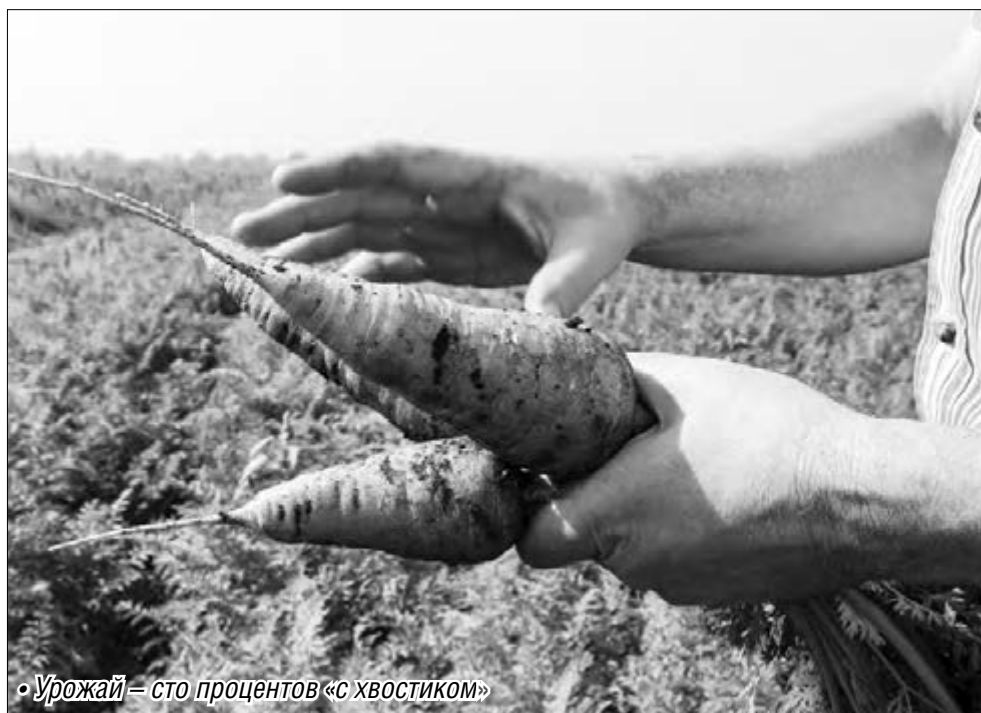
«Урожай – сто процентов «с хвостиком»»

Не следует опасаться и недостатка рыбы в связи с тем, что в список запрещенного импорта попала норвежская продукция. Основная доля даров моря, около десяти тысяч тонн ежемесячно, завозилась и продолжает завозиться к нам из других регионов страны. По крайней мере, в рыбных отделах магнитогорских магазинов и на ярмарках недостатка товара не наблюдается. Значительным потенциалом обладает и развитие регионального промышленного рыболовства, тем более что Южный Урал славится своими озерами. По решению исполняющего обязанности главы региона Бориса Дубровского министерство сельского хозяйства области разрабатывает концепцию промышленного рыболовства, в рамках которой уже в следующем году будет серьезно увеличен объем зарыбления