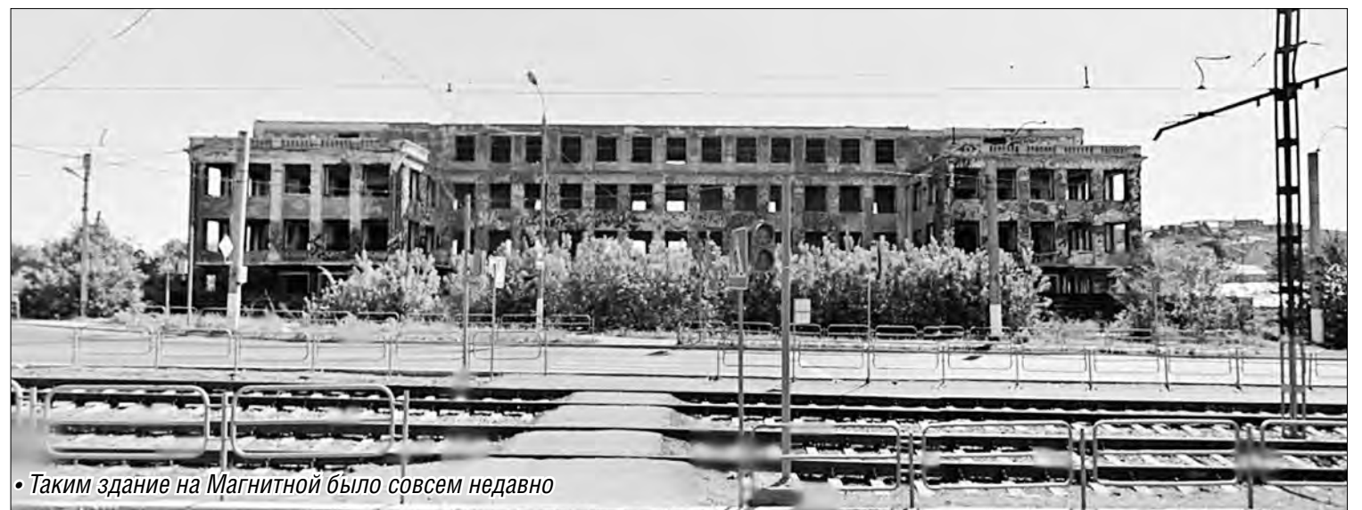
• Таким здание на Магнитной было совсем недавно

Область избавляется от «домов-призраков»