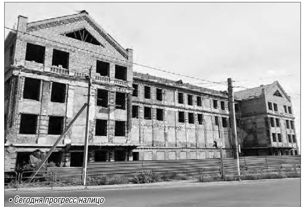
• Сегодня прогресс налицо

По поручению врио губернатора Евгений Тефтелев провел совещание по окончанию строительства здания с участием собственника и производителя работ. В результате собственники здания предложили строение не сносить и предоставили в администрацию подробный сетевой график строительно-монтажных работ на объекте. Кроме того, на собственника были наложены обязательства по благоустройству стройплощадки и прилегающей территории. По информации производителя работ определены сроки окончания модернизации: по фасадам – ноябрь 2014 года, по бла-