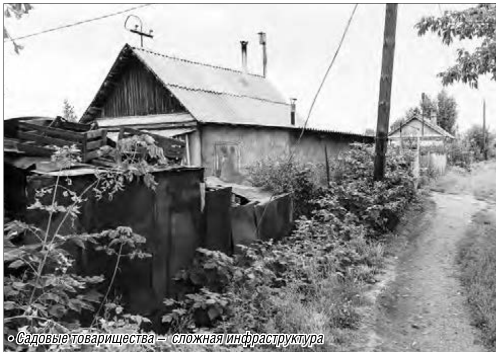
«Садовые товарищества – сложная инфраструктура»