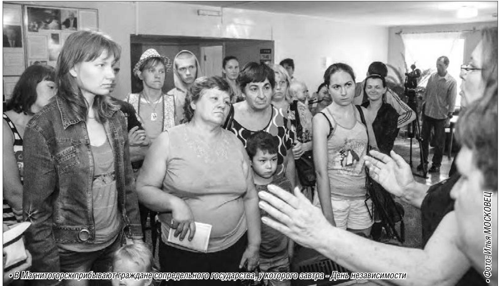
• В Магнитогорск прибывают граждане сопредельного государства, у которого завтра – День независимости