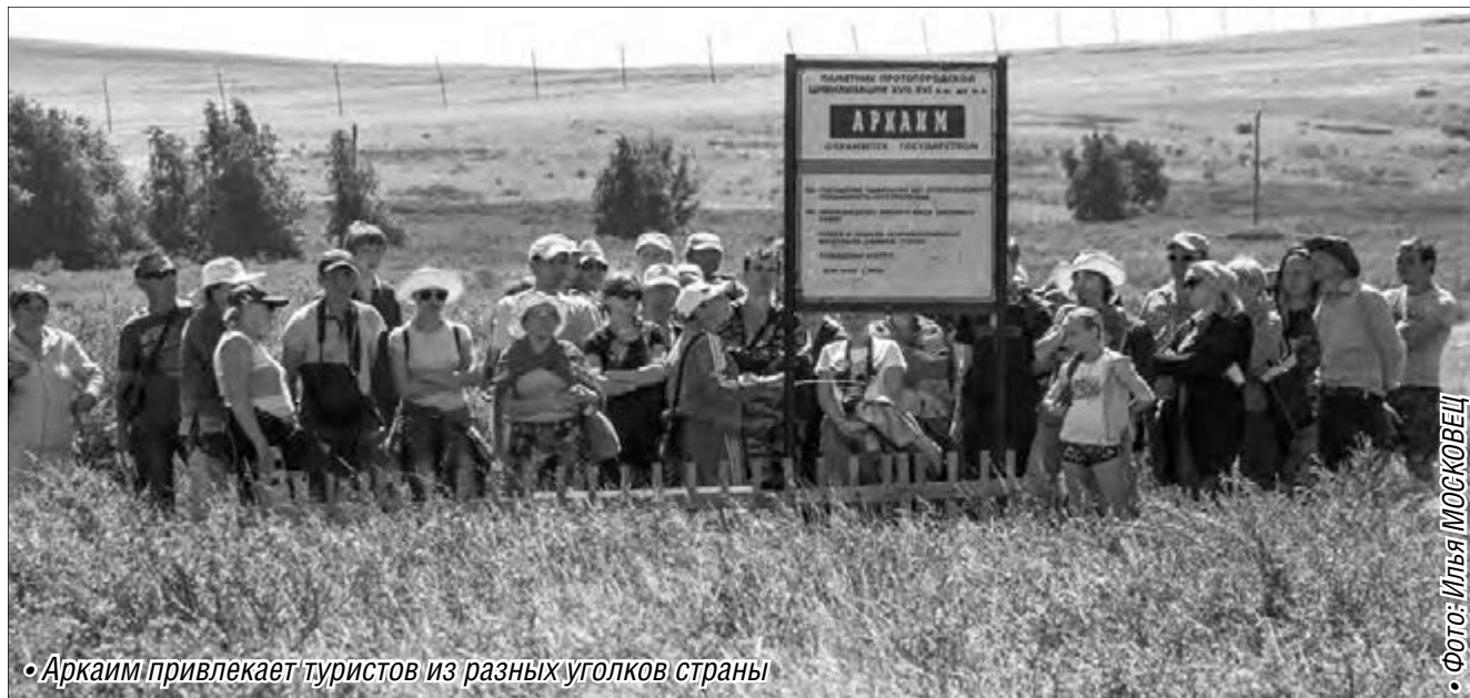
• Аркаим привлекает туристов из разных уголков страны

В окрестностях озера проявляется мерячение (арктическая истерия). Состояние, напоминающее массовый психоз, поражало и местных жителей, и приезжих: они выполняли любые команды, повторяя друг за другом движения.