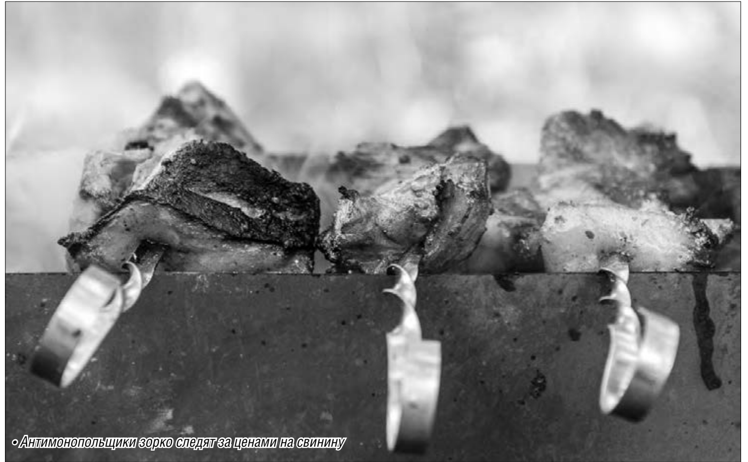
• Антимонопольщики зорко следят за ценами на свинину

Жесткие меры со стороны государства уже были эффективно опробованы несколько лет назад, когда во время засухи отдельные компании, вступив в сговор, взвинтили