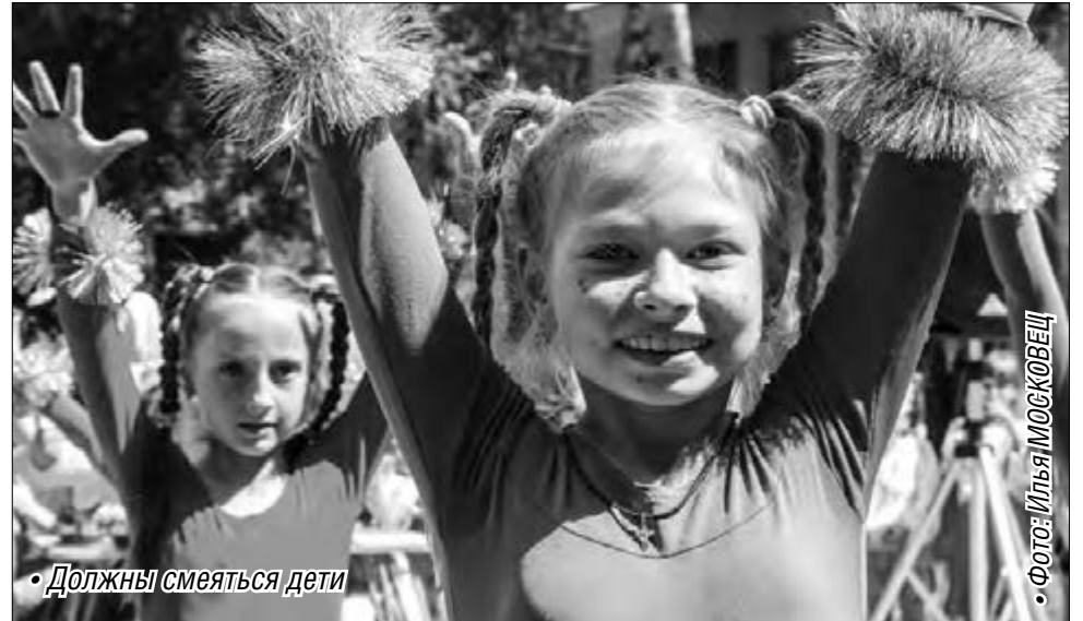
• ДОЛЖНЫ СМЕТЬСЯ ДЕТИ

Большую заботу фонд «Металлург» проявляет к воспитанникам специализированных коррекционных, интернатных, медицинских детских учреждений города Магнитогорска и прилегающих сельских