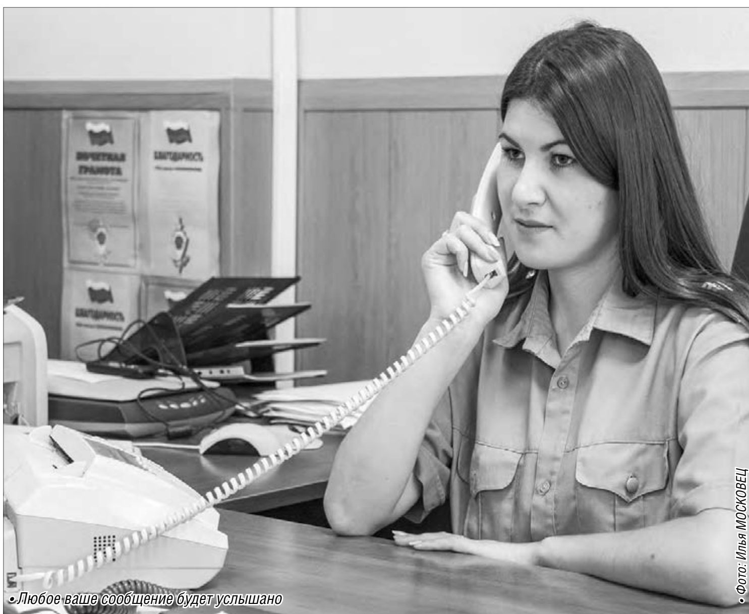
Любое ваше сообщение будет услышано

Полицейские просят сообщать о неправомерных действиях стражей порядка по «телефонам доверия»