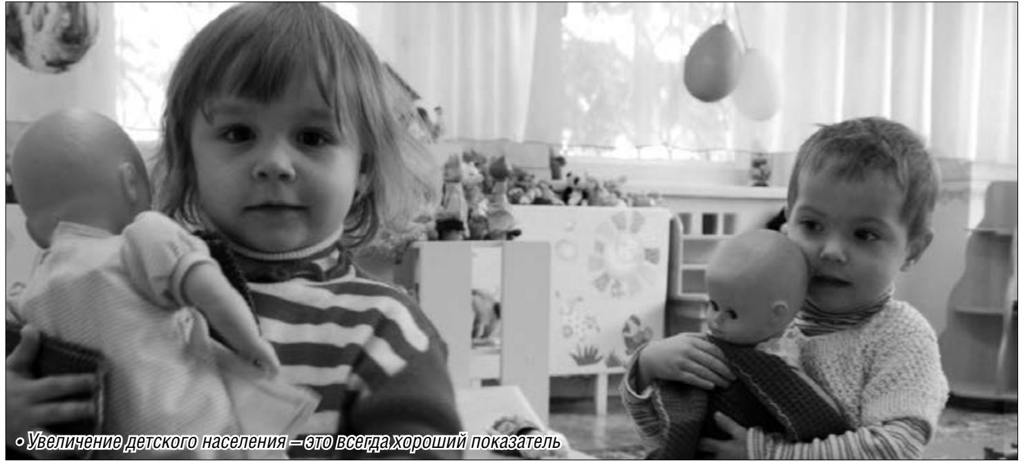
• Увеличение детского населения – это всегда хороший показатель

Естественный прирост населения вырос за счёт рождения новых граждан