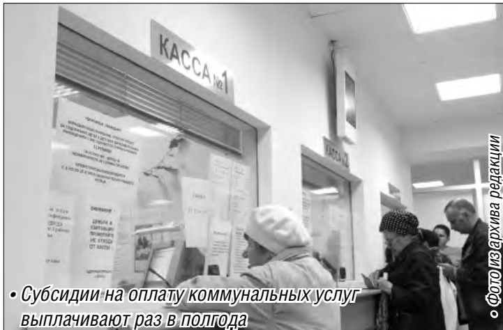
• Субсидии на оплату коммунальных услуг выплачивают раз в полгода

Первый вид поддержки предусматривает право на компенсацию части платы за услуги ЖКХ для южноуральцев с низкими доходами. В случае, если на коммуналку семья тратит более 22 процентов совокупного дохода, граждане могут обратиться за господдерж-