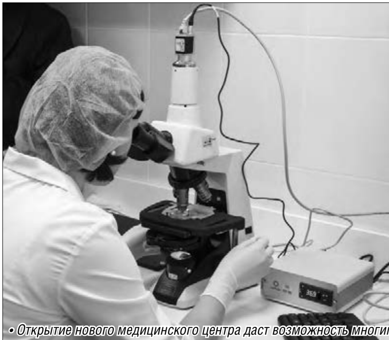
• Открытие нового медицинского центра даст возможность многим семьям обрести долгожданное счастье