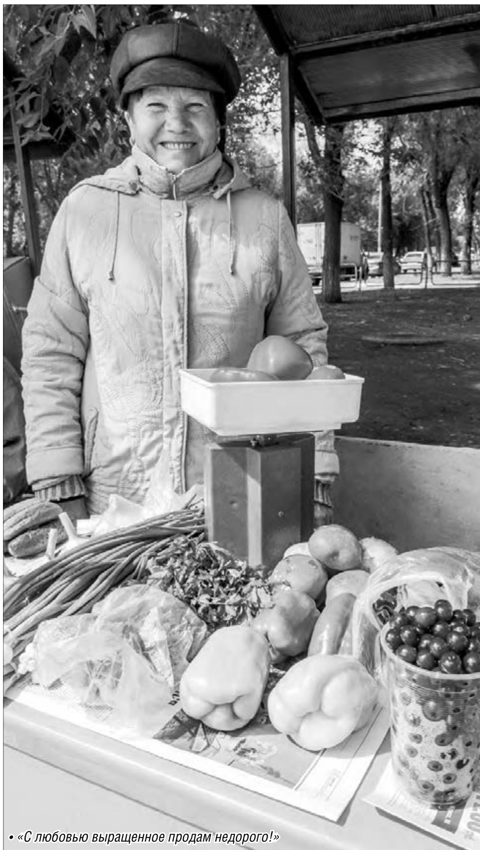
• «С любовью выращенное продается недорого!»

Садоводам помогут реализовать продукцию, выращенную своими руками