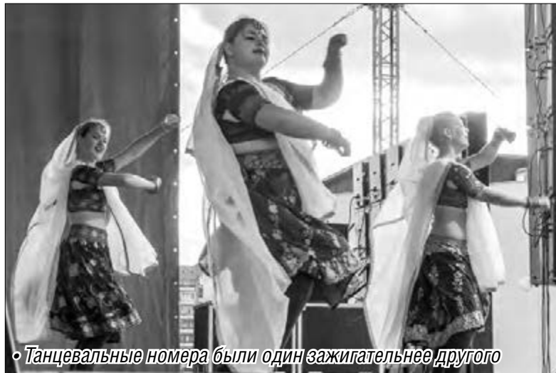
◦ Танцевальные номера были один зажигательнее другого