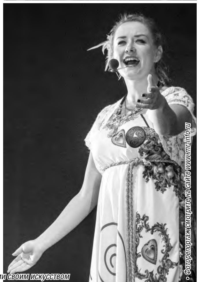
◦ Фотопоголка смотрите на сайте www.mr-info.ru