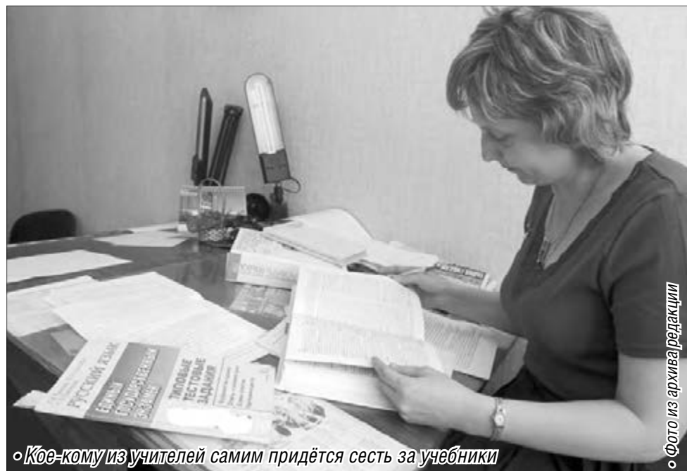
«Кое-кому из учителей самим придется сесть за учебники»

Как сообщила Ольга Голодец, преподаватели школ из регионов, в которых выпускники показали низкие результаты на ЕГЭ