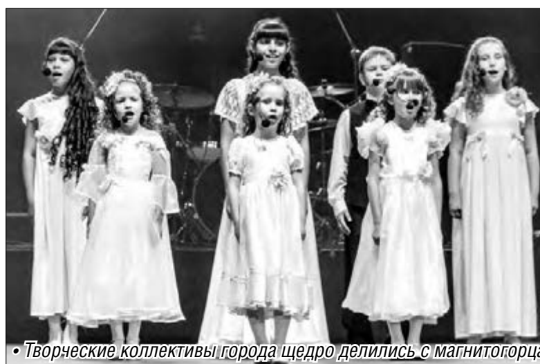
◦ Творческие коллективы города щедро делились с магнитогорцами своим искусством