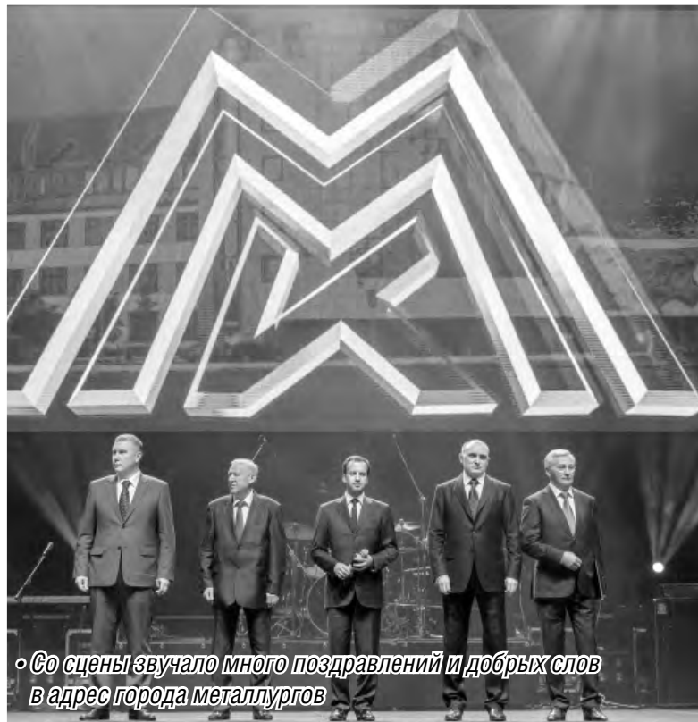
◦ Со сцены звучало много поздравлений и добрых слов в адрес города металлургов

В прошедшую пятницу Магнитогорск отметил сразу два значимых события – День города и День металлурга