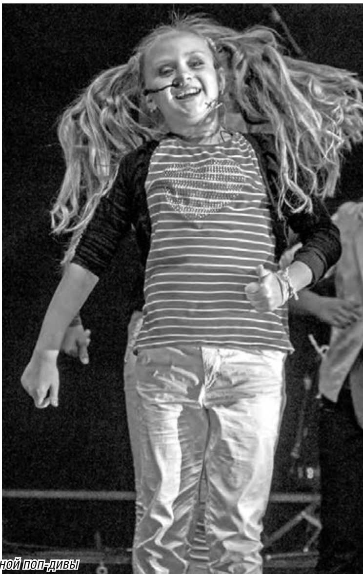
• Магнитогорские звёздочки зажигали ничуть не хуже столичной поп-дивы

Традиционно руководители города и металлургического комбината подготовили для магнитогорцев и гостей развлекательную программу на любой вкус.