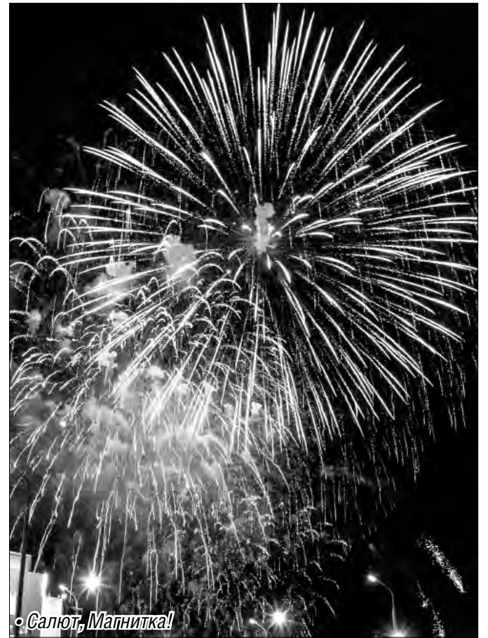
◦ Салют, Магнитка!