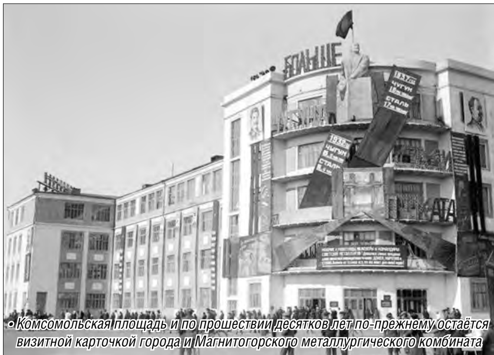
Комсомольская площадь и по прошествии десятилетий по-прежнему остаётся визитной карточкой города и Магнитогорского металлургического комбината

Комсомольская площадь (до 1948 года – площадь Заводоуправления) – важный планировочный узел левобережья и города в целом. Проект планировки площади и основных зданий, расположенных на ней, относится к 1930-1936 годам и принадлежит группе ленинградских архитекторов. С 1934 года площадь стала местом проведения демонстраций и митингов. 9 мая 1945 года на ней состоялся парад Победы. Последняя демонстрация проведена здесь в ноябре 1961, затем проведение праздничных митингов и демонстраций было перенесено на правый берег. По периметру площади расположены центральная проходная, реконструированная в 1979 году, заводоуправление – первое капитальное здание города, памятник истории регионального значения, гостиница – в настоящее время – один из офисов ОАО «ММК», заводская лаборатория, заводская поликлиника.