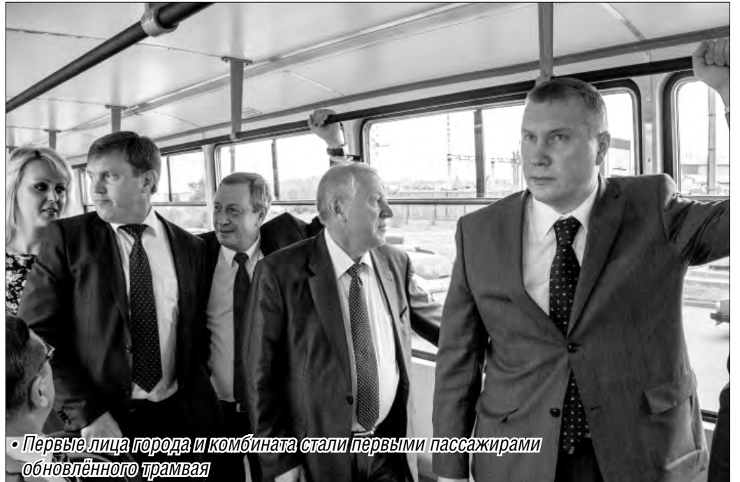
• Первые лица города и комбината стали первыми пассажирами обновлённого трамвая