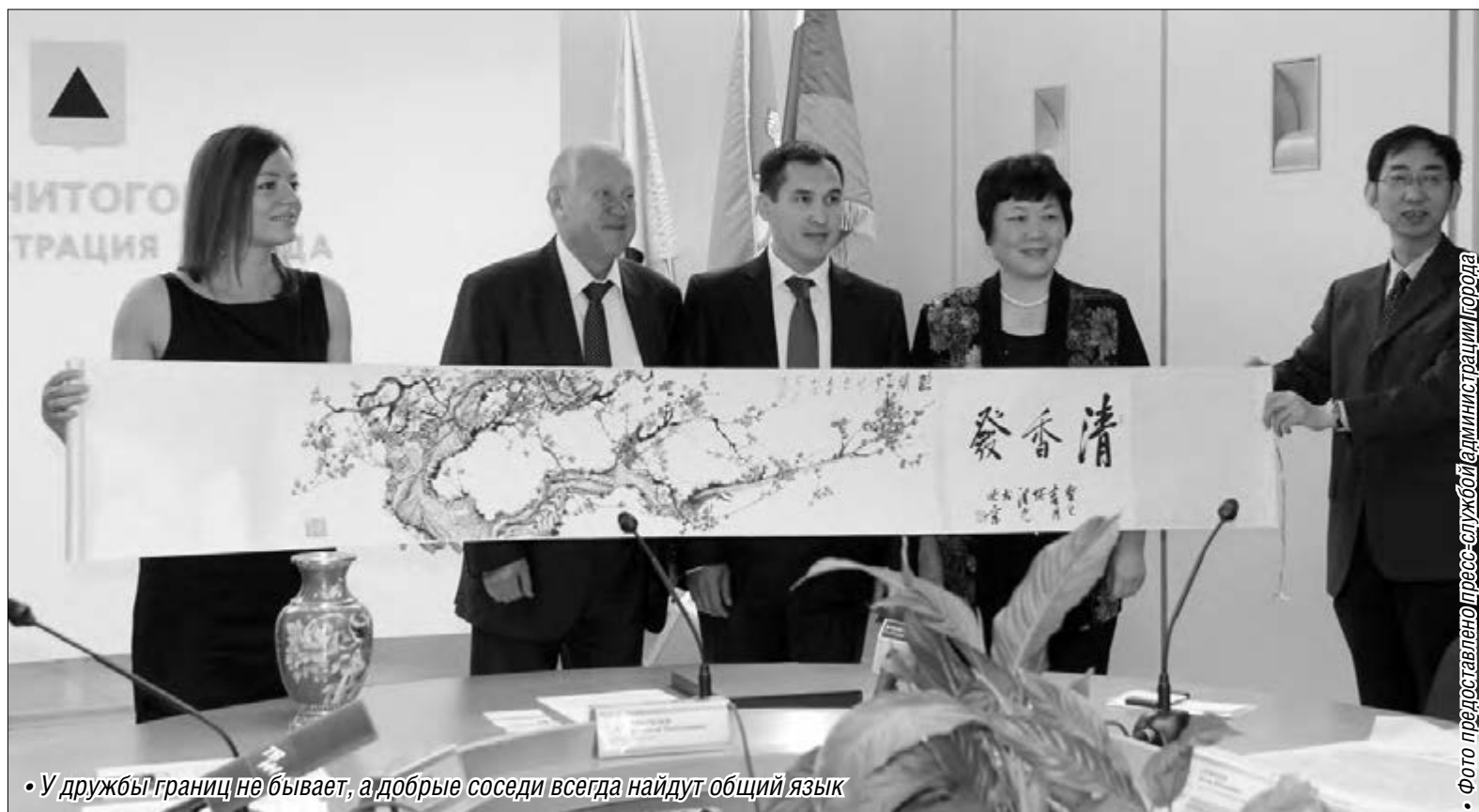
• У дружбы границ не бывает, а добрые соседи всегда найдут общий язык

Жителей Магнитогорска поздравили представители городов-побратимов из Казахстана и Китая