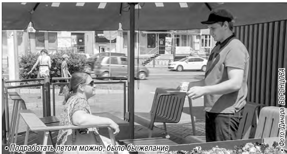
Подработать летом можно, было бы желание

– Торговля – тоже дело перспективное. Попробовать себя летом на позиции торгового представителя, кассира в гипермаркете, а с осени перейти на график работы, который позволит совмещать ее с учебой, – это вполне возможно, – комментирует