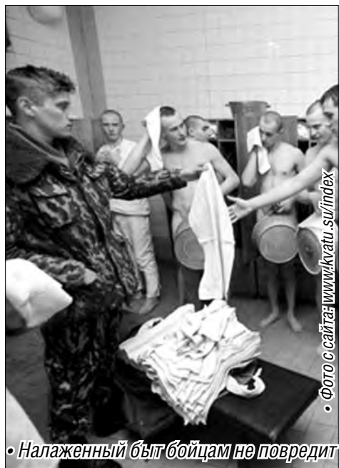
• Налаженный быт бойцам не повредит