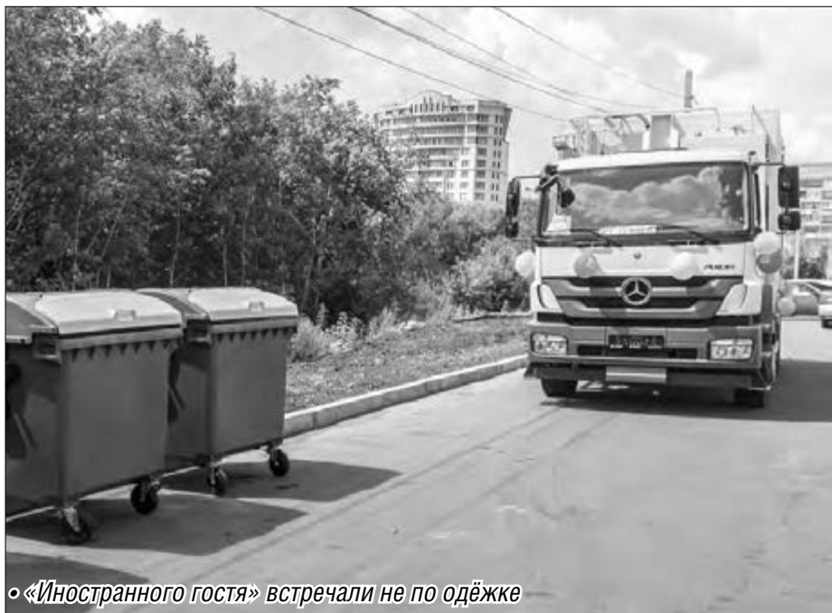
«Иностранного гостя» встречали не по одежке

Главе города продемонстрировали возможности импортного мусоровоза