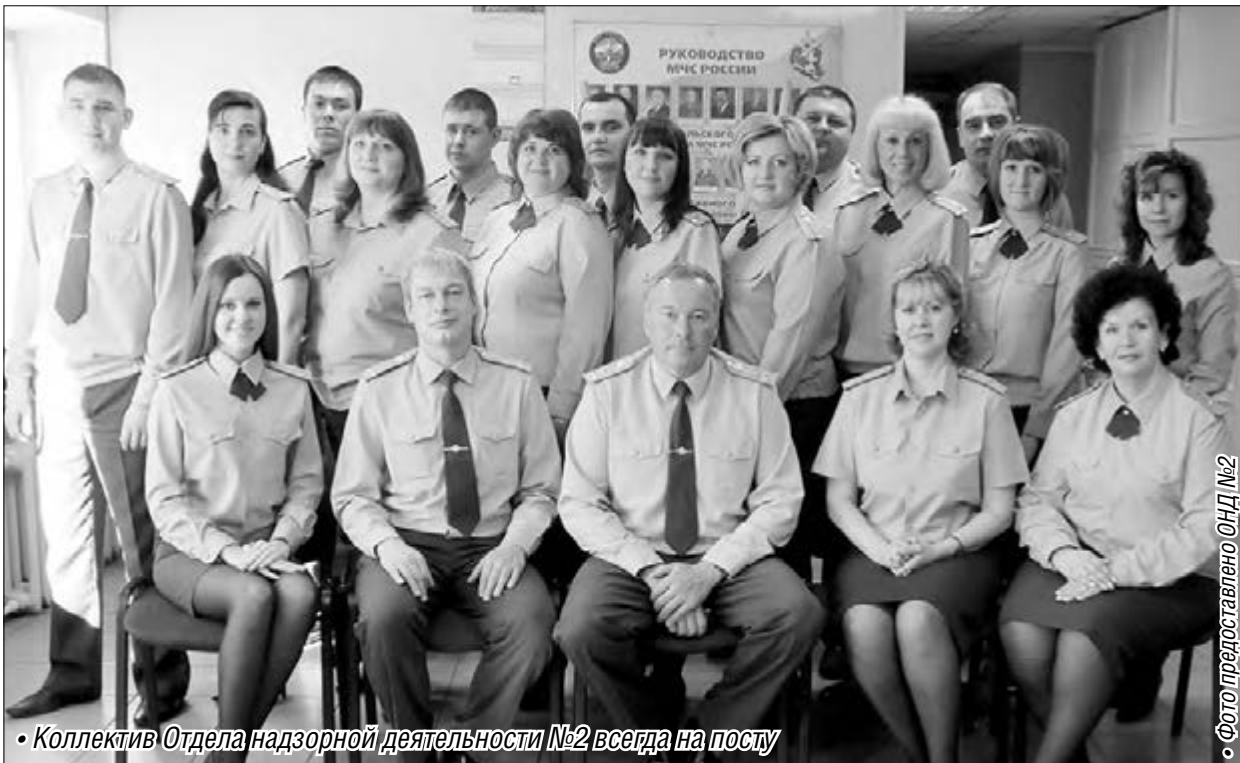
Коллектив Отдела надзорной деятельности №2 всегда на посту