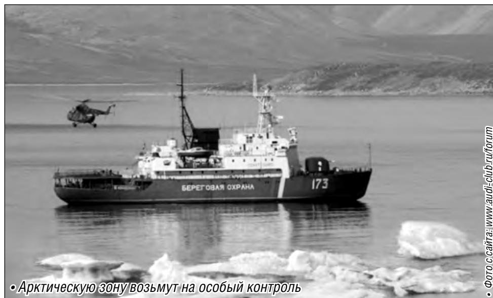
• Арктическую зону возьмут на особый контроль

Министерство обороны РФ усиливает контроль за арктической воздушной границей. Восстановление структуры противовоздушной обороны на побережье Северного Ледовитого океана завершится к октябрю 2015 года, сообщает газета «Известия».