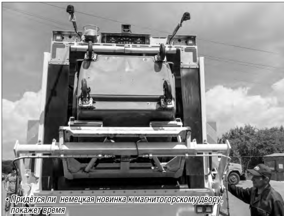
Придётся ли немецкая новинка к магнитогорскому двору, покажет время

Фирма-организатор презентации хорошо известна в нашей стране, на ее заводах действительно делают надежные, долговечные автомобили. Но за внешней респектабельностью всегда что-то сокрыто, в данном случае – цена. К примеру, стоимость мусоровоза, который в четверг испытали в деле, начинается от семи миллионов рублей.