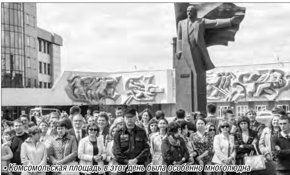
• Комсомольская площадь в этот день была особенно многолюдна