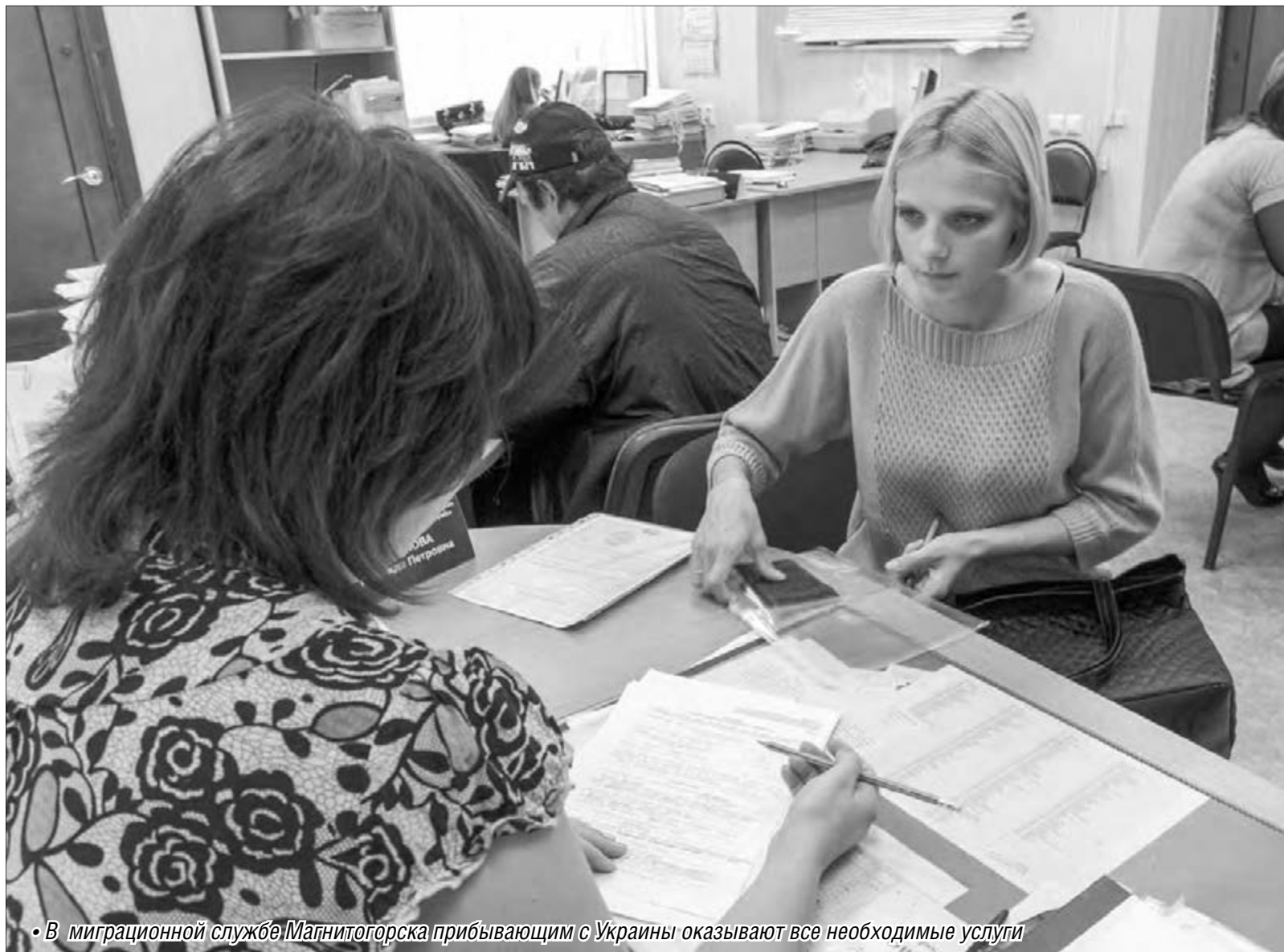
• В миграционной службе Магнитогорска прибывающим с Украины оказывают все необходимые услуги

Вынужденным переселенцам с Украины помогают в Магнитогорске