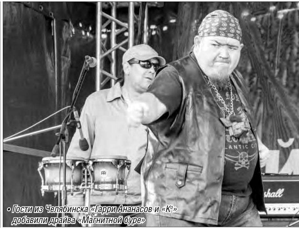
• Гости из Челябинска «Гарри Ананасов и «К»» добавили драйва «Магнитной буре»

Погода, несмотря на ливни, сильный ветер и не летний холод, не смогла испортить ни девятый фестиваль летнего драйва «Магнитная буря», ни международный фестиваль моды «Половодье», прошедшие в минувшие выходные. Организаторы обещали, что мероприятия состоятся при любой погоде, и обещание выполнили.