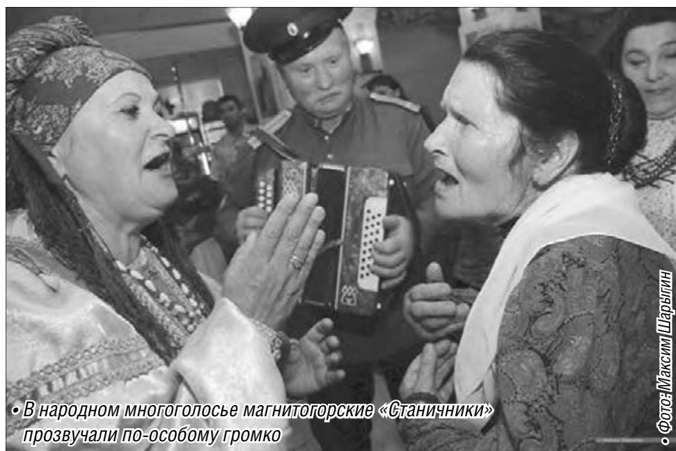
• В народном многоголосье магнитогорские «Станичники» прозвучали по-особому громко

Программа фестиваля помимо конкурсов сольного и ансамблевого исполнения включала творческие встречи и концерты, казачьи вечерки, мастер-классы именитых знатоков традиций по исполнению казачьей песни, боевому плясу, обряду старинной казачьей свадьбы, танцам и играм станичников. Гостям повезло поучаствовать в крестном ходе с Курской иконой Божьей