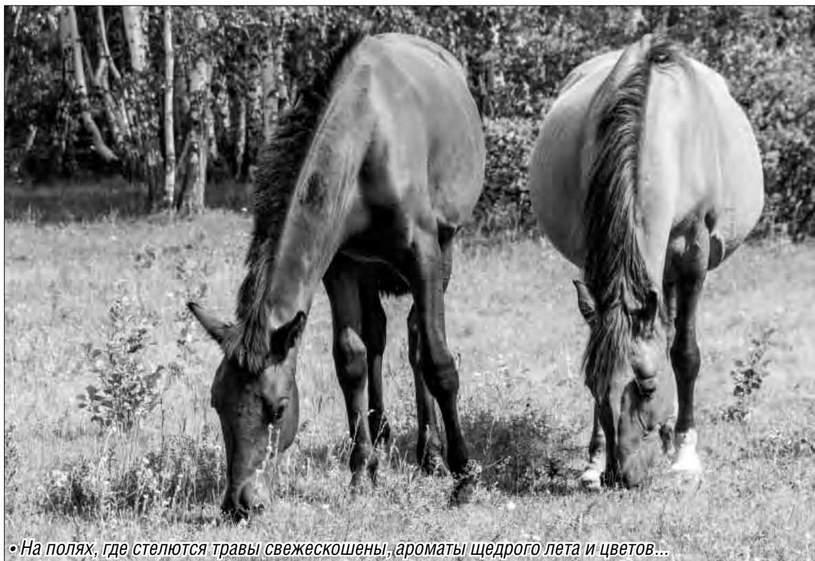
• На полях, где стелются травы свежескошены, ароматы щедрого лета и цветов...

К сожалению, прогнозы синоптиков пока неутешительны. По данным Гидрометцентра, в ближайшую декаду на Южном Урале средняя температура воздуха ожидается на четыре-восемь градусов ниже многолетних значений. Со вторника температура начнет повышаться и к четвер-