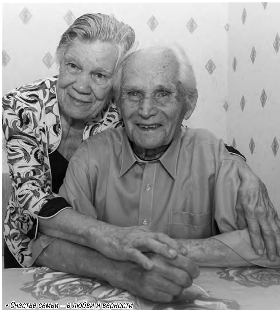
• Счастье семьи – в любви и верности