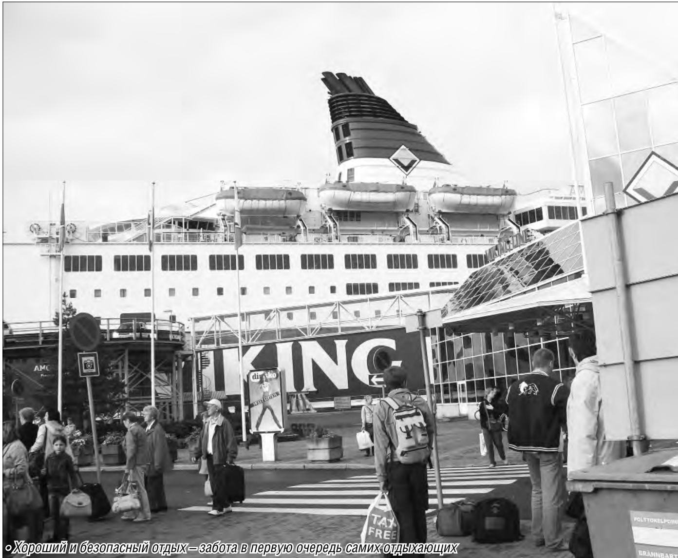
«Хороший и безопасный отдых – забота в первую очередь самих отдыхающих»

Как не «остаться с носом», купив путёвку за рубеж