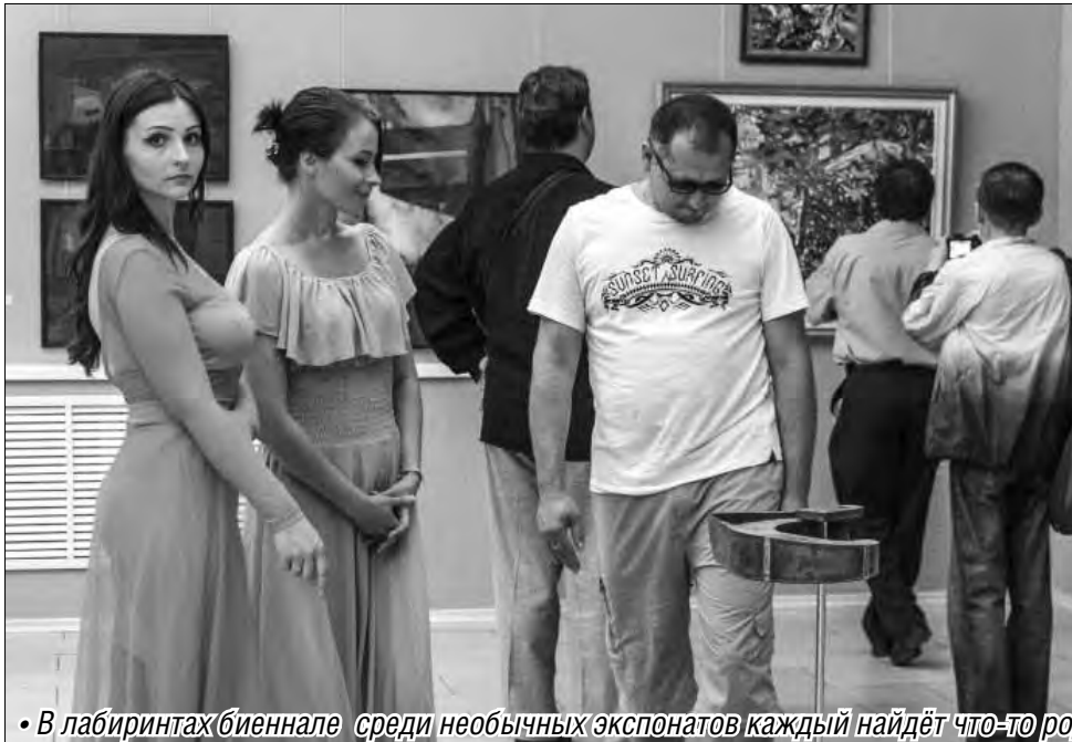
• В лабиринтах биеннале среди необычных экспонатов каждый найдёт что-то родственное своей душе

В Магнитогорске открылась первая межрегиональная биеннале современного искусства Урала «Лабиринт»