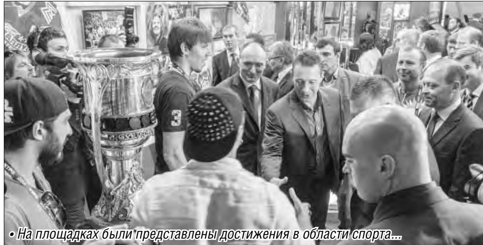
• На площадках были представлены достижения в области спорта...

На первоначальном этапе предложение Евгения будет представлено только в электронном виде. Он намерен создать программу, которая поможет людям с ограниченными возможностями беспрепятственно передвигаться по городским объектам, своего рода маршрутизатор: заносишь в него две точки, к примеру, остановки транспорта, и