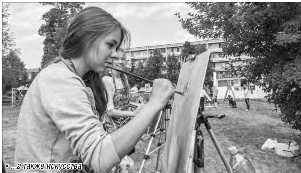
• ...а также искусства

программа выдает полную раскладку маршрута: наличие пандусов, лифты, доступность социальных объектов. Таким образом, инвалид еще дома сможет определить, доберется ли он самостоятельно до нужного места.