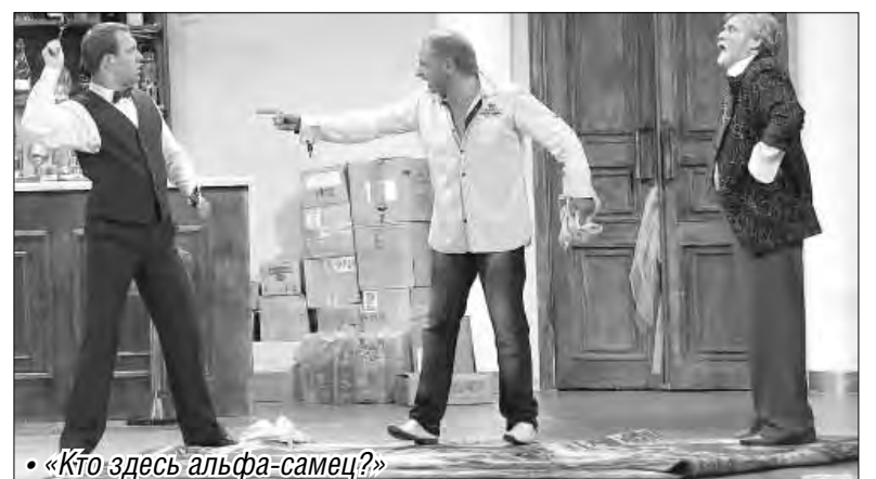
• «Кто здесь альфа-самец?»

В итоге довольно неприглядным получился у автора комедии «правдивый портрет» человечества. И совсем уж нелогичным выглядит ее финал, в котором герои заявляют, что «победила любовь».