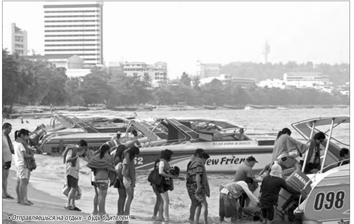
• Отправляешься на отдых – будь бдителен!

Чтобы избежать непредвиденных ситуаций во время отдыха, лучше подстраховаться. В смысле – застраховаться