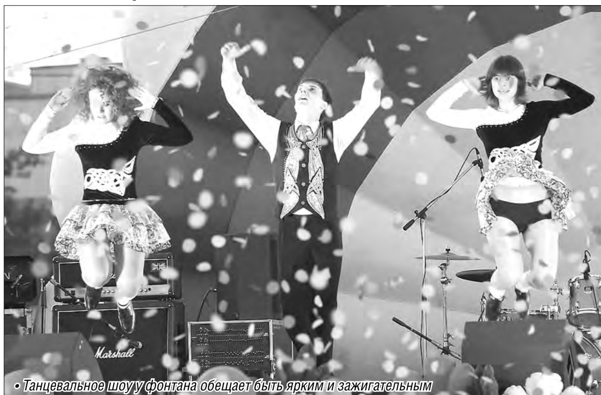
«Танцевальное шоу у фонтана обещает быть ярким и зажигательным»

В танцевальном шоу будет все – от детских театрализованных постановок, традиционных вальса и танго до яркой, динамичной сальсы, бачаты, хип-хопа и русских хороводов. Поздравить горожан с праздником приедут известные танцевальные коллективы Челябинской области и Башкортостана «Премьер», «Калинка», «Мишашки», «Сюрприз», «Рефлексия», «Ивушка». Радовать магнитогорцев будут коллективы, студии и школы родного города «Театро», «Оксфордские персики», «Эль Нэгма», «Эхо гор», «Баядера», «Танцкласс», «Амрита», «Энергия», «Active dance», «Супер-флеш», «Юность», «Акварель», «Калейдоскоп улыбок», «Форсаж», «Flash» и многие другие. Всего заявлено 85 номеров, участниками марафона