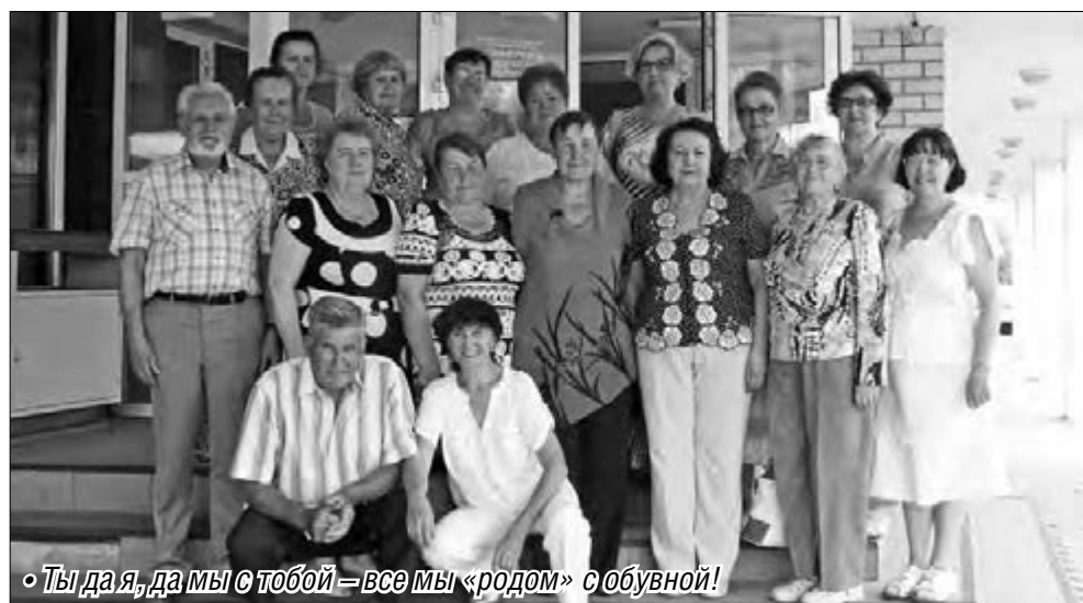
• Ты дая, да мы с тобой – все мы «родом» с обувной!

В том, что сегодня продукция Магнитогорской обувной фабрики хорошо известна в России и за рубежом, – вклад каждого работника, специалистов и, конечно, ветера-