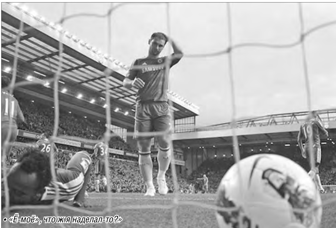
• «Е-моё», что ж я наделал-то?»