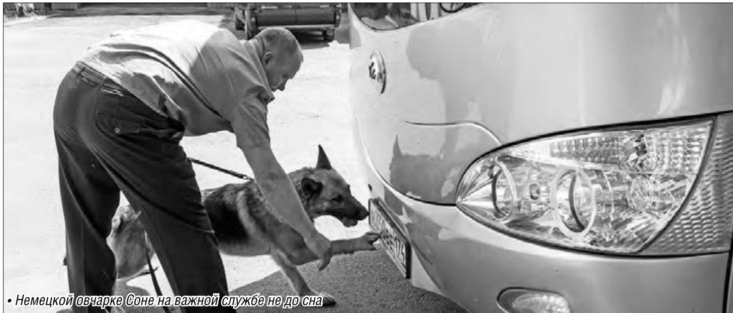
• Немцкой овчарке Соне на важной службе не до сна

На службе у сотрудников Магнитогорской таможни четыре верных пса, которые обучены поиску наркотических веществ в любых доступных для служебных собак местах. К примеру, в рейсовом автобусе. Как это происходит, овчарка по кличке Соня продемонстрировала наглядно.