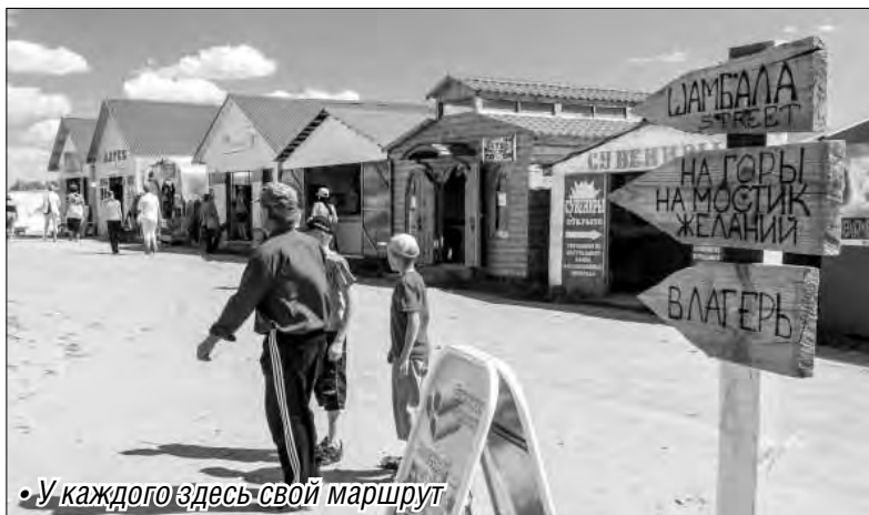
• У каждого здесь свой маршрут