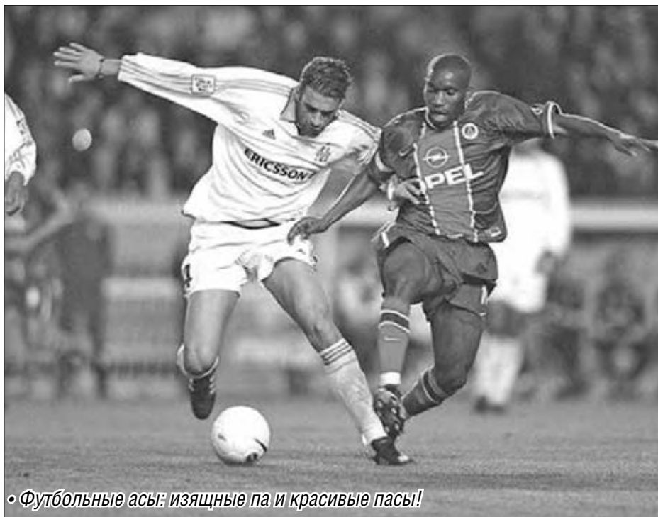
• Футбольные асы: изящные па и красивые пасы!

Чемпионат мира по футболу-2014 в разгаре: неудачи, победы и... сюрпризы