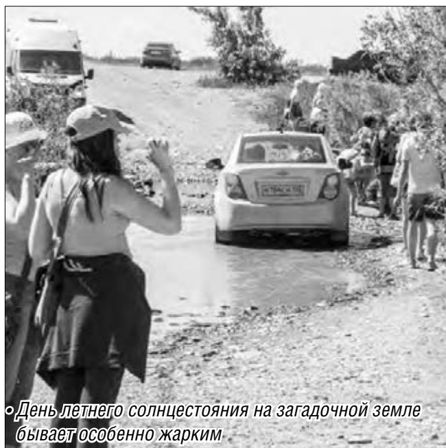
• День летнего солнцестояния на загадочной земле бывает особенно жарким