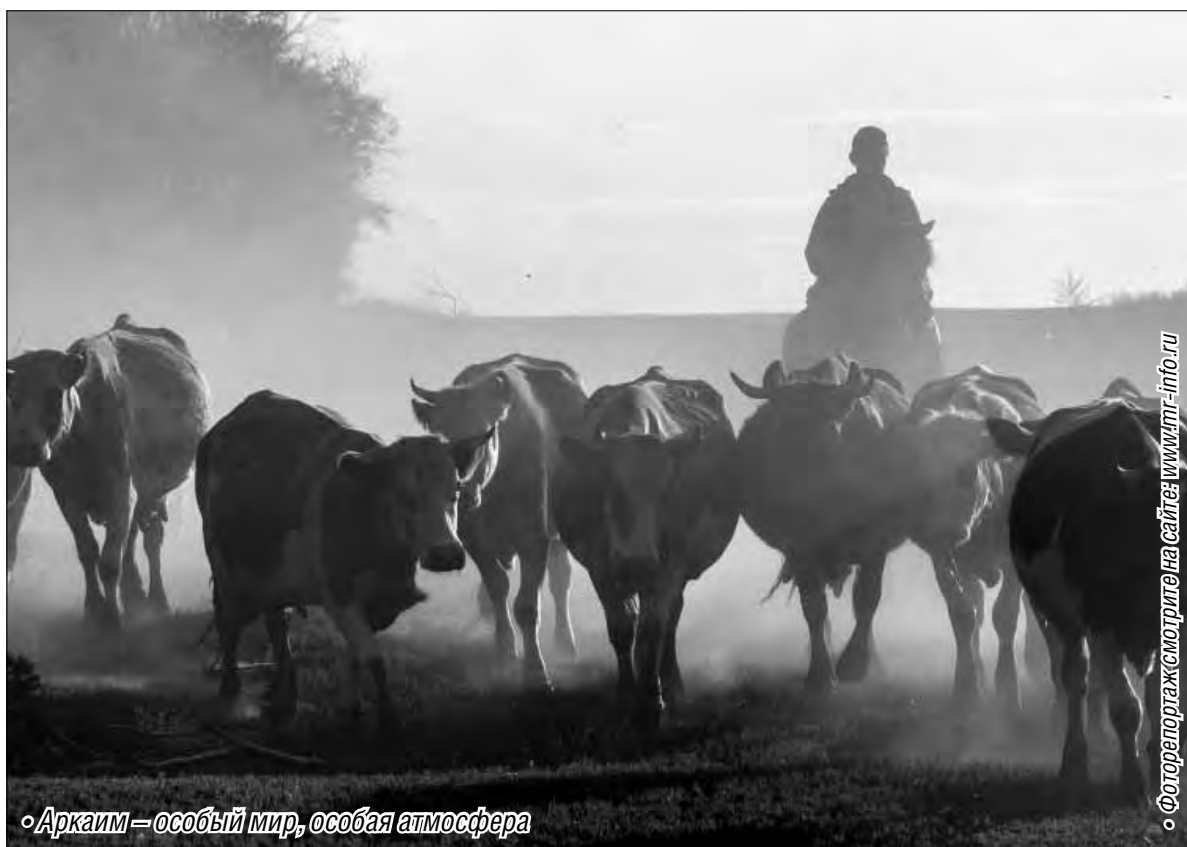
• Аркаим – особый мир, особая атмосфера