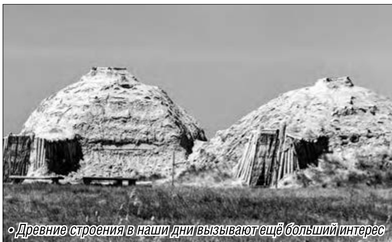
• Древние строения в наши дни вызывают ещё больший интерес