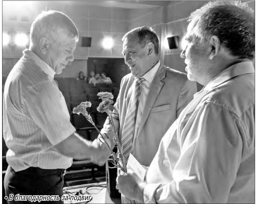
«В благодарность за подвиг»