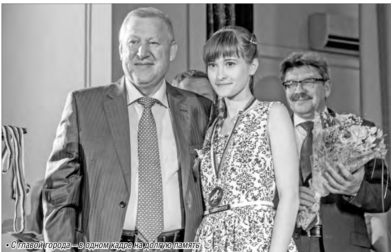
• С главой города – в одном кадре на долгую память

Городские награды отличники уже получили из рук главы города на торжественной церемонии, которая состоялась во Дворце творчества детей и молодежи.