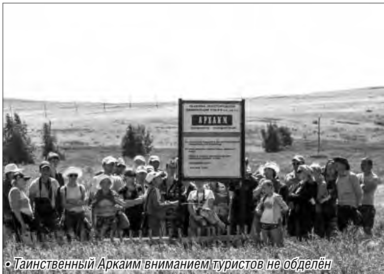
• Таинственный Аркаим вниманием туристов не обделён

В выходные в заповеднике «Аркаим» ожидается скопление туристов