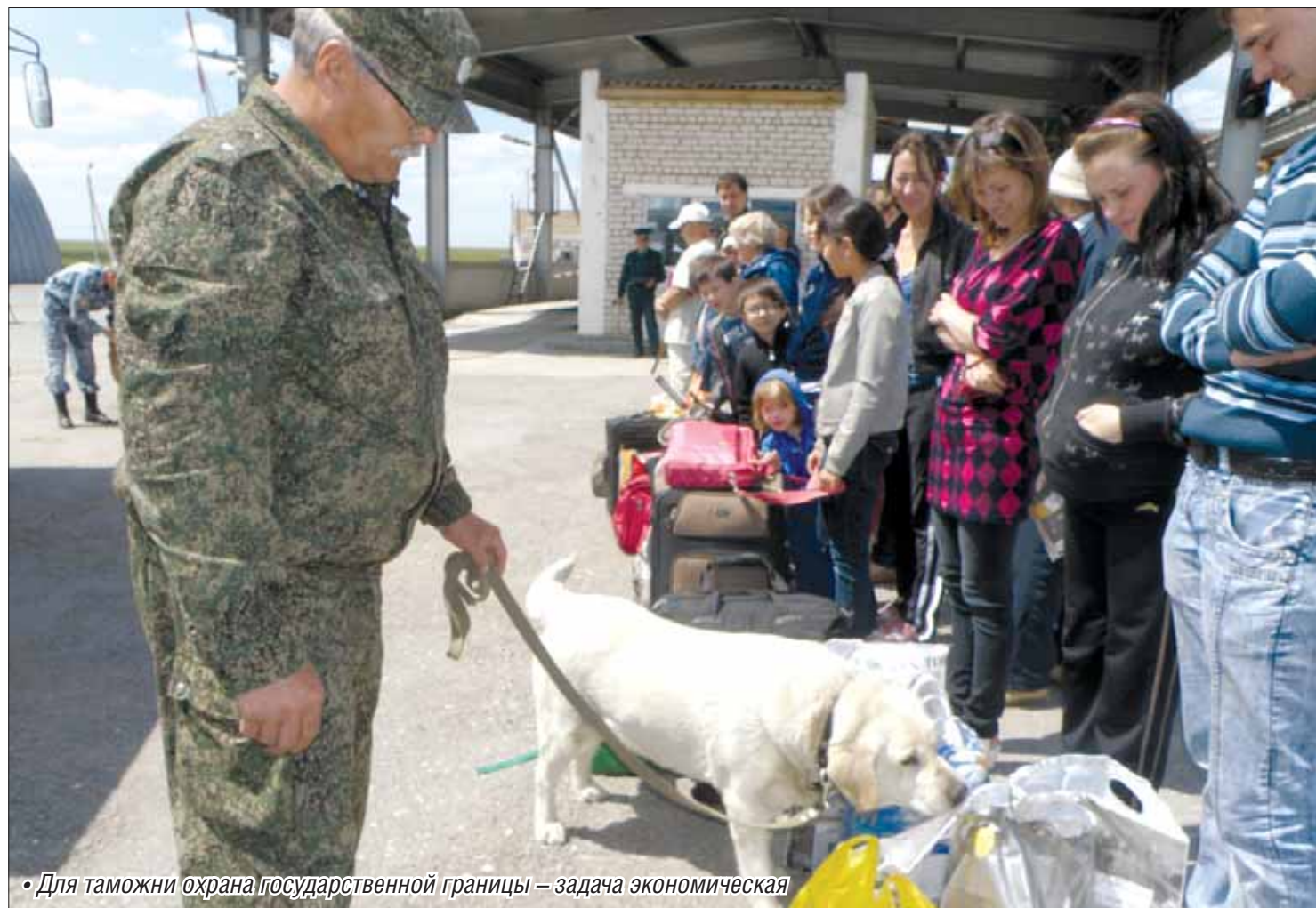
• Для таможни охрана государственной границы – задача экономическая

Государство начинается с границ, а значит, и с таможни