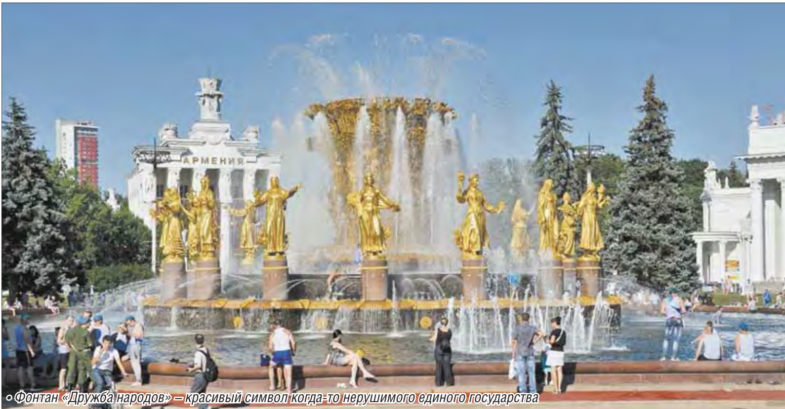
Фонтан «Дружба народов» — красивый символ когда-то нерушимого единого государства

С 2002 года 12 июня мы празднуем День России