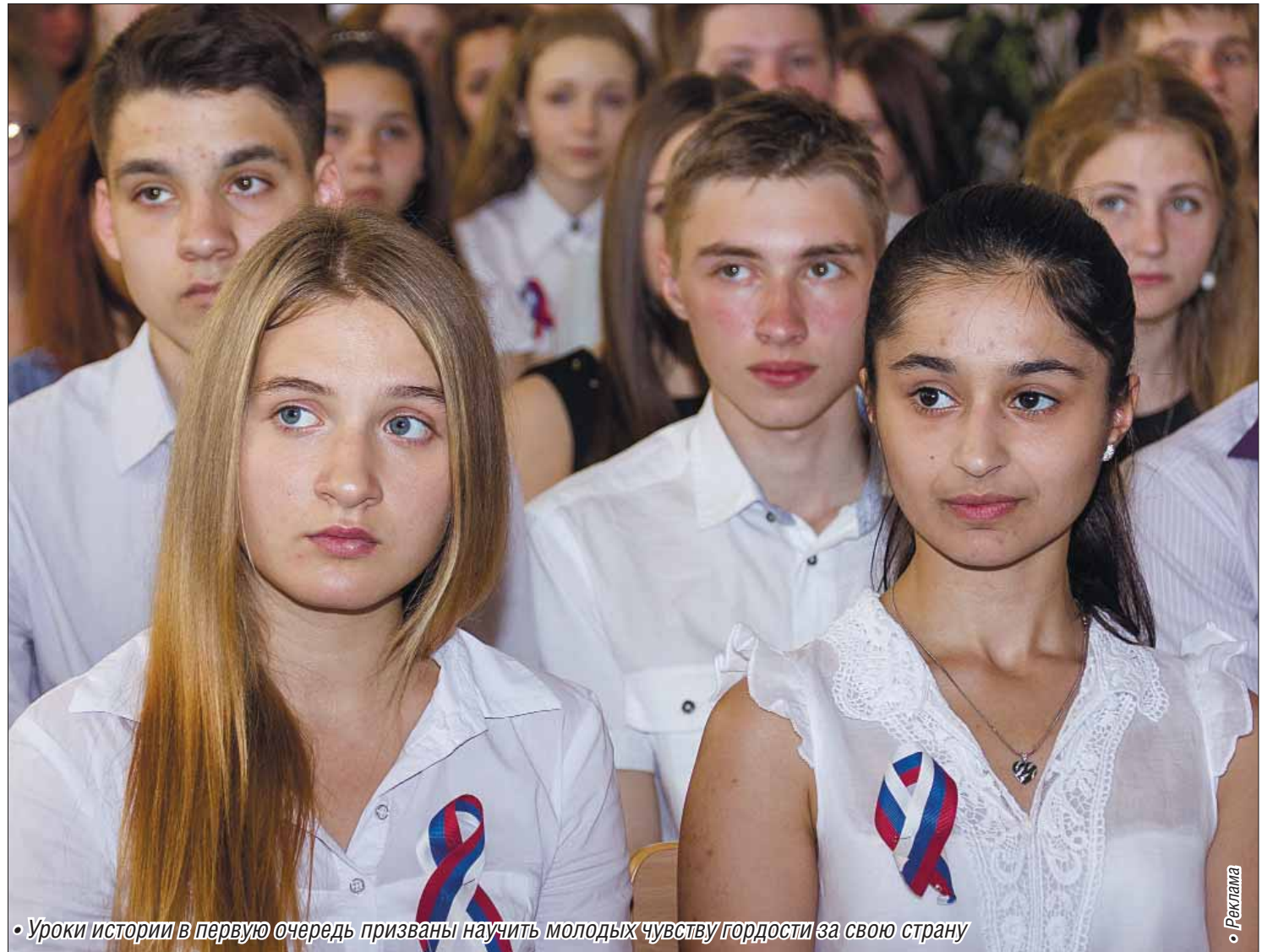
• Уроки истории в первую очередь призваны научить молодых чувству гордости за свою страну

Магнитогорские школьники говорили о присоединении полуострова