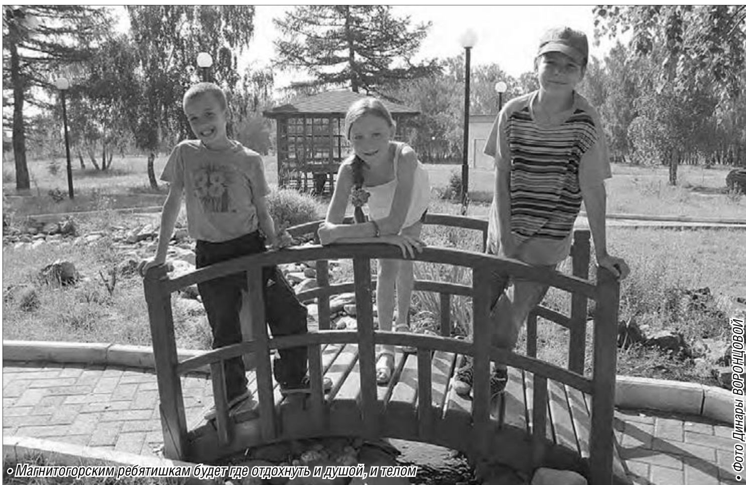
«Магнитогорским ребятишкам будет где отдохнуть и душой, и телом»

Несмотря на уменьшение областной субсидии, школьников ждёт полноценная летняя оздоровительная кампания