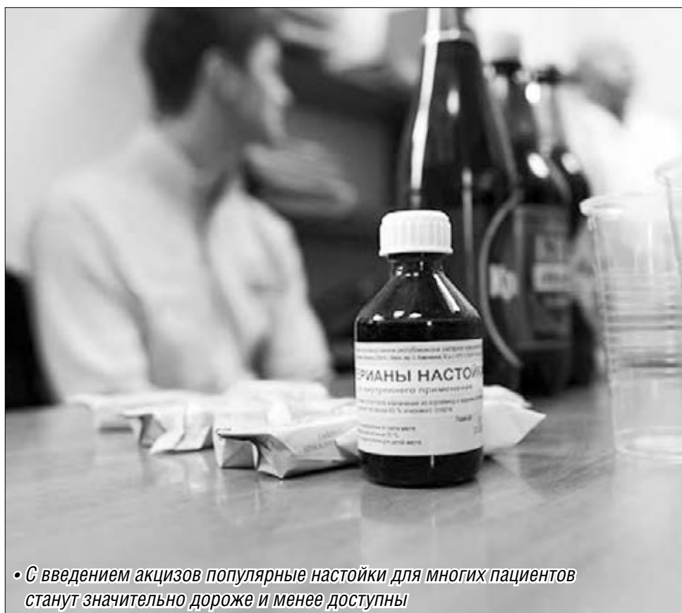
• С введением акцизов популярные настойки для многих пациентов станут значительно дороже и менее доступны

законодатели должны взвешивать все последствия. Включая и доступность таких препаратов для тех, кто ими действительно спасается от бессонницы и большого горла. В Аптечной гильдии считают, что речь прежде всего идет о пожилых людях с невысоким уровнем доходов.