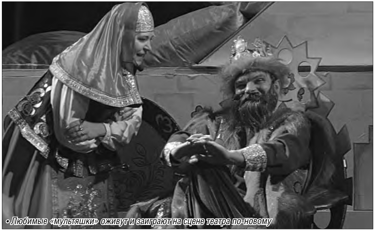
• Любимые «мультяшки» оживут и заиграют на сцене театра по-новому