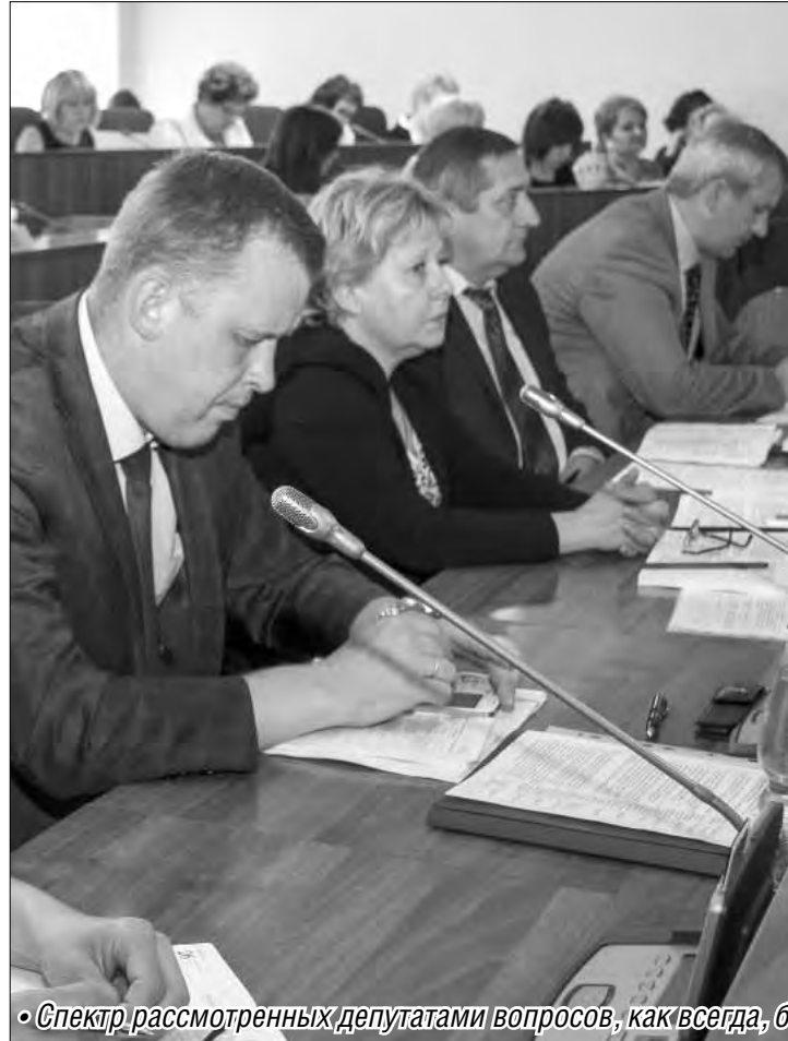
• Спектр рассмотренных депутатами вопросов, как всегда, был изучен и проработан досконально

Несмотря на уменьшение областной субсидии, школьников ждёт полноценная летняя оздоровительная кампания