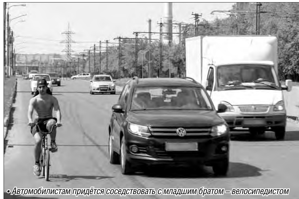
«Автомобилистам придётся соседствовать с младшим братом – велосипедистом»

С вступлением в силу новой редакции Правил дорожного движения жизнь велосипедистов ещё более усложнилась.