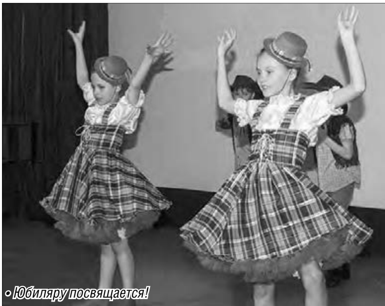
• Юбилею посвящается!