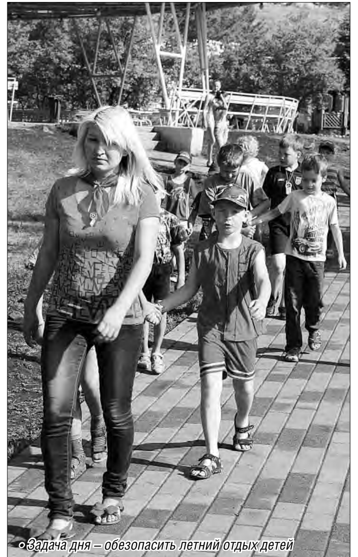
«Задача дня – обезопасить летний отдых детей»

Валентина СЕРДИТОВА