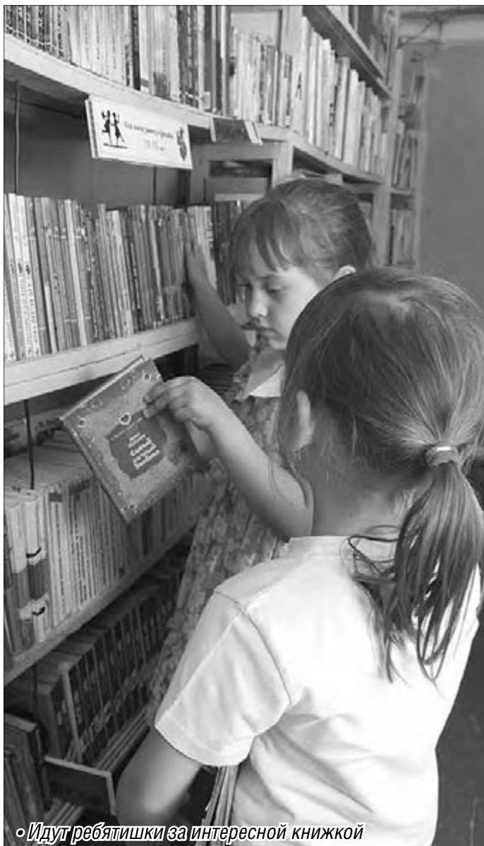
• Идут ребята за интересной книжкой

– Солидный возраст. Наша библиотека стала бабушкой, – шутят сотрудники.