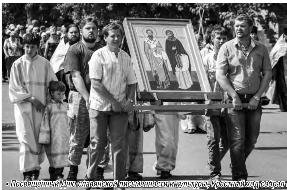
• Посвящённый Дню славянской письменности и культуры, Крестный ход собрал горожан разных возрастов и сословий

В минувшую субботу в Магнитогорске прошёл епархиальный Крестный ход