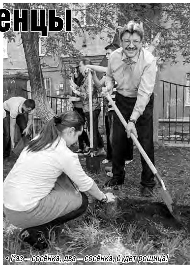
• Раз – сосёнка, два – сосёнка, будет рощица!

Очередь за саженцами на территории гимназии №53 выстроилась с одиннадцати часов утра, хотя по телевидению прошла информация, что организаторы акции «277 тысяч деревьев Челябинской области» в полдень начнут раздавать сосенки организациям и только потом – частным лицам. Но уже к часу не осталось ни одного деревца.