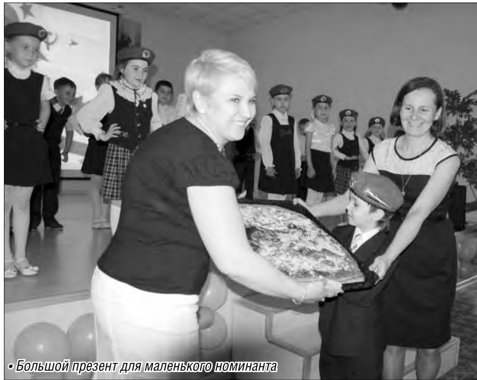
• Большой презент для маленького номинанта

Что же касается собственно проведенного праздника, то чествовали в тот день не только круглых отличников. Награждены были также учащиеся, которые достигли блестящих результатов, защищая честь школы на различных городских со-