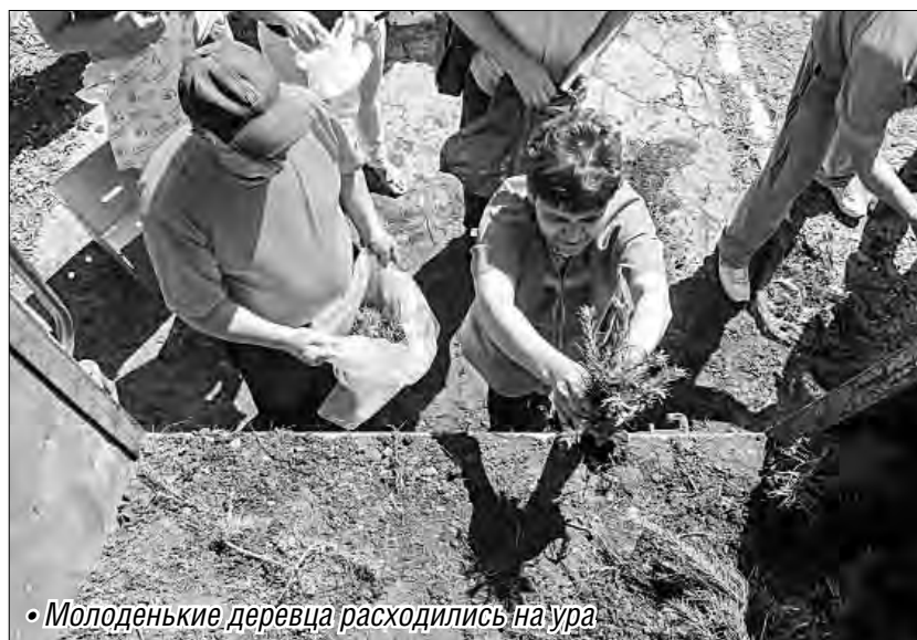
• Молоденькие деревца расходились на ура

«Зелёная» акция с красной символикой всем пришлась по душе