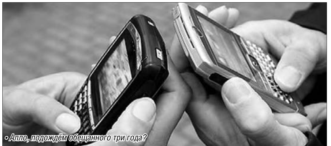
• Алло, подождём обещанного три года?

Ссылаясь на то, что им нужны инвестиции для развития сетей в малонаселенных пунктах, где вложения вряд ли окупятся, сотовые компании выторговали пару лет. И предложили путешественникам тарифы для разговоров в «чужих» городах. Правда, как показывает практика, абоненты забывают вклю-