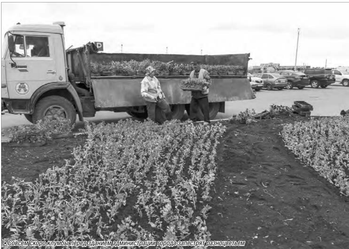
• Совсем скоро клумбы перед зданием администрации города зацветят разноцветьем

Горожан приглашают принять участие в благоустройстве своих районов