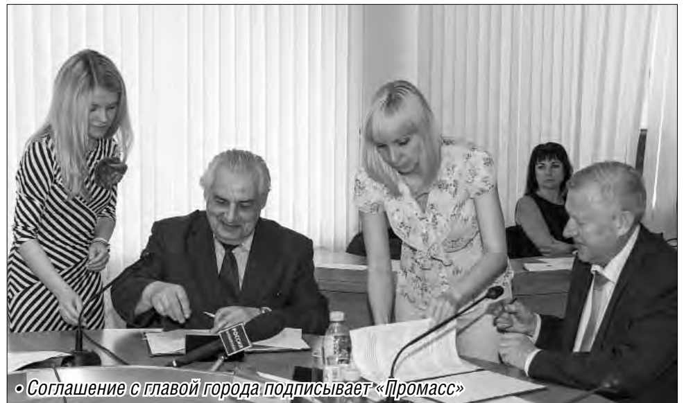
• Соглашение с главой города подписывает «Промасс»

Снятию бюрократических барьеров должно поспособствовать принятое в Магнитогорске постановление «О порядке проведения оценки регулирующего воздействия проектов нормативных правовых актов и их экспертизы, затра-