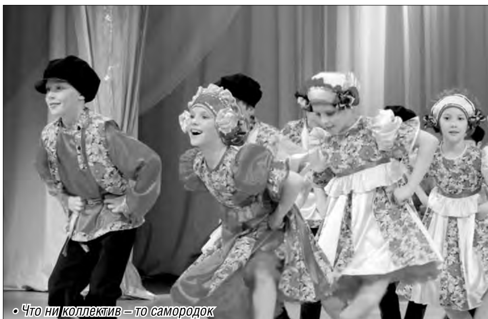
• Что ни коллектив – то самородок

Областные отборочные туры фестиваля народного танца завершены. В течение марта исполнители со всего Южного Урала приезжали в Миасс, Коркино, Касли. В финале более 40 коллективов продемонстрировали свое мастерство в Троицке, Магнитогорске и Челябинске.