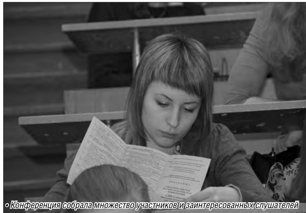
«Конференция собрала множество участников и заинтересованных слушателей»