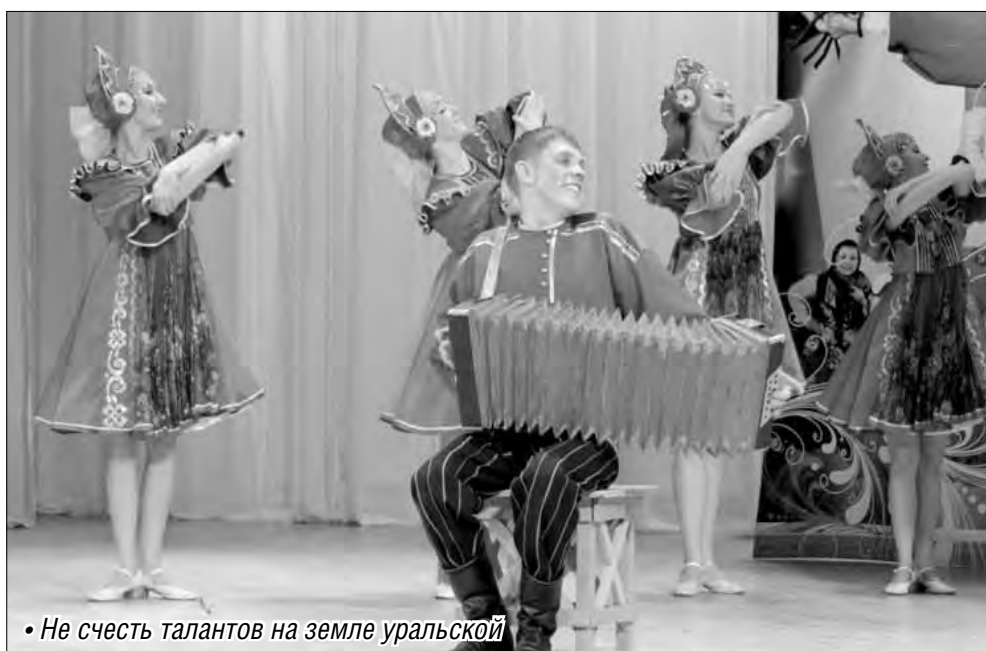
• Не счесть талантов на земле уральской

Магнитогорцы станут участниками Всероссийского этапа фестиваля «Уральский перепляс»