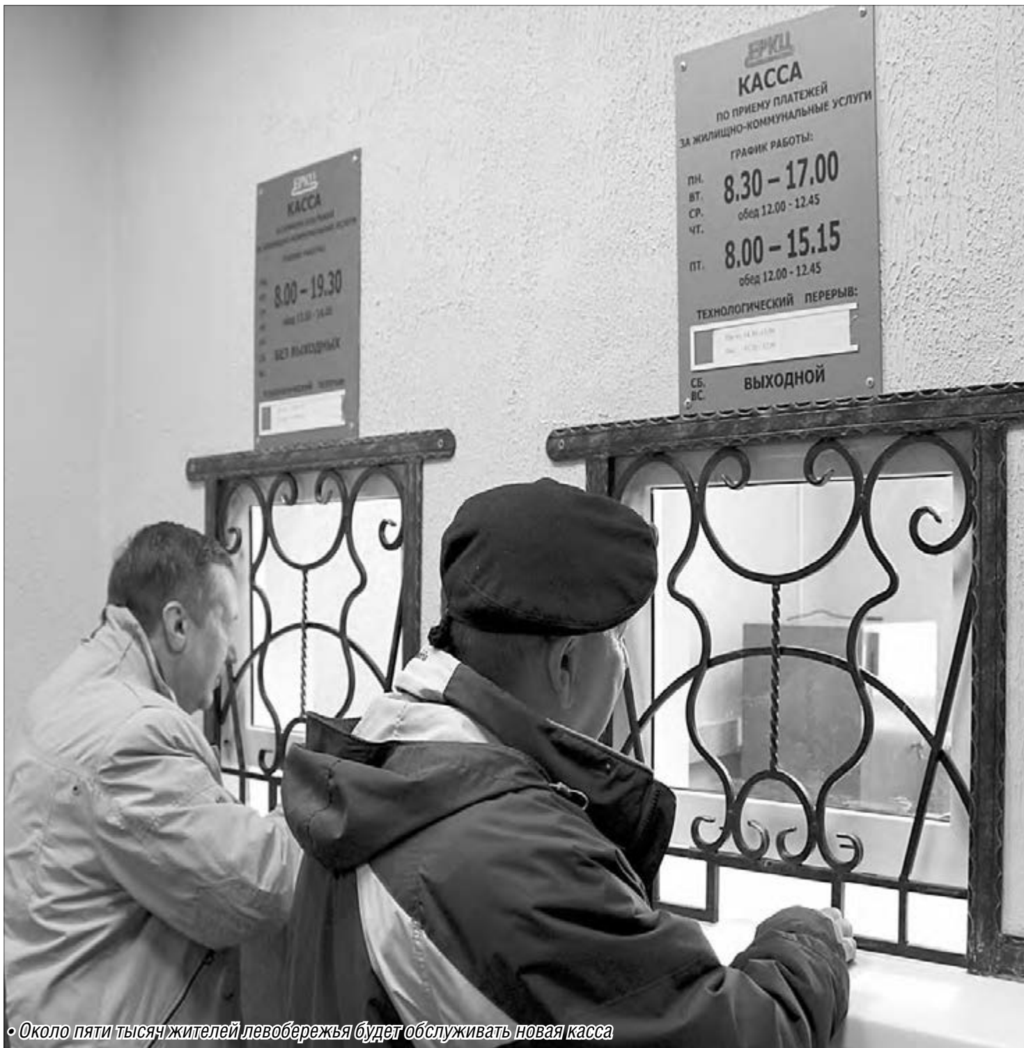
• Около пяти тысяч жителей левобережья будет обслуживать новая касса

В понедельник в левобережье откроется новая касса ЕРКЦ