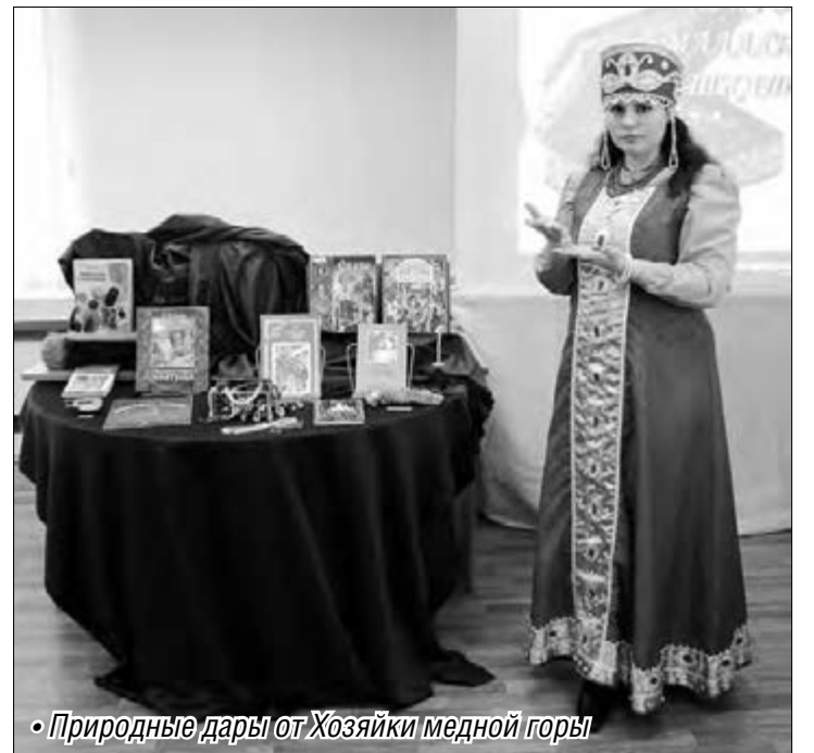
«Природные дары от Хозяйки медной горы»