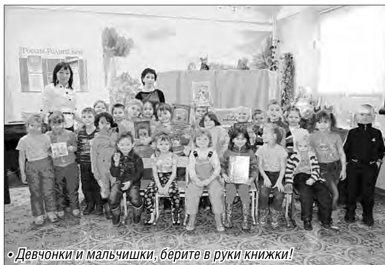
«Девчонки и мальчишки, берите в руки книжки!»