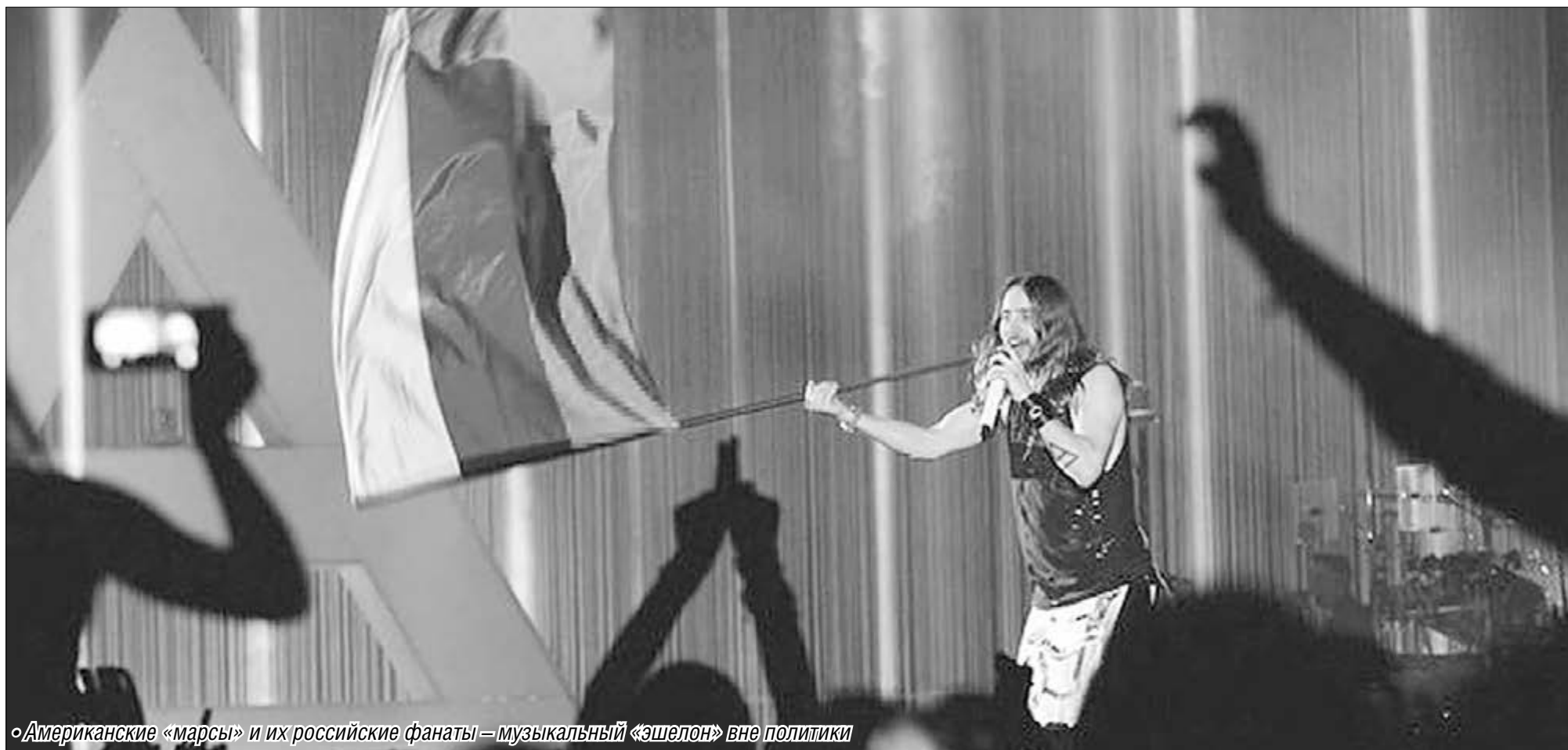
«Американские «марсы» и их российские фанаты – музыкальный «эшелон» вне политики

Тридцать секунд до Красной планеты и полгода – до Москвы