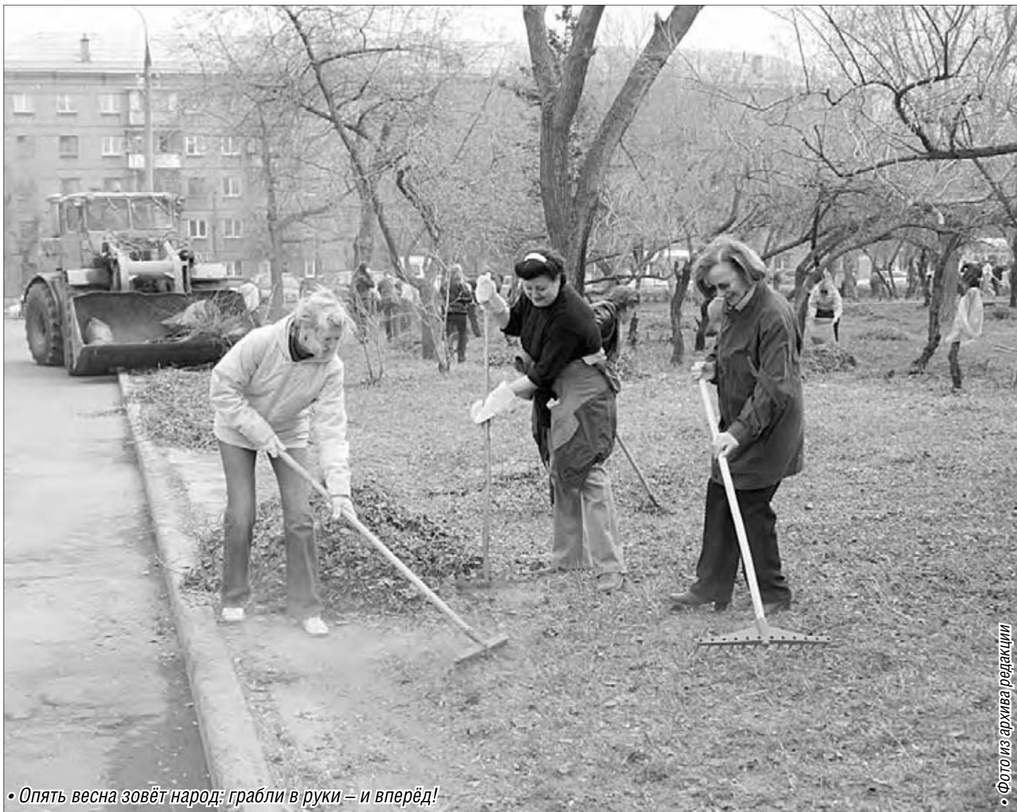
• Опять весна зовёт народ: грабли в руки – и вперёд!

Апрель в городе пройдёт под знаком чистоты