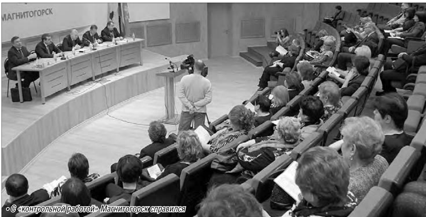
«Контрольной работой» Магнитогорск справился

Государство всё жёстче следит за расходованием бюджетных средств