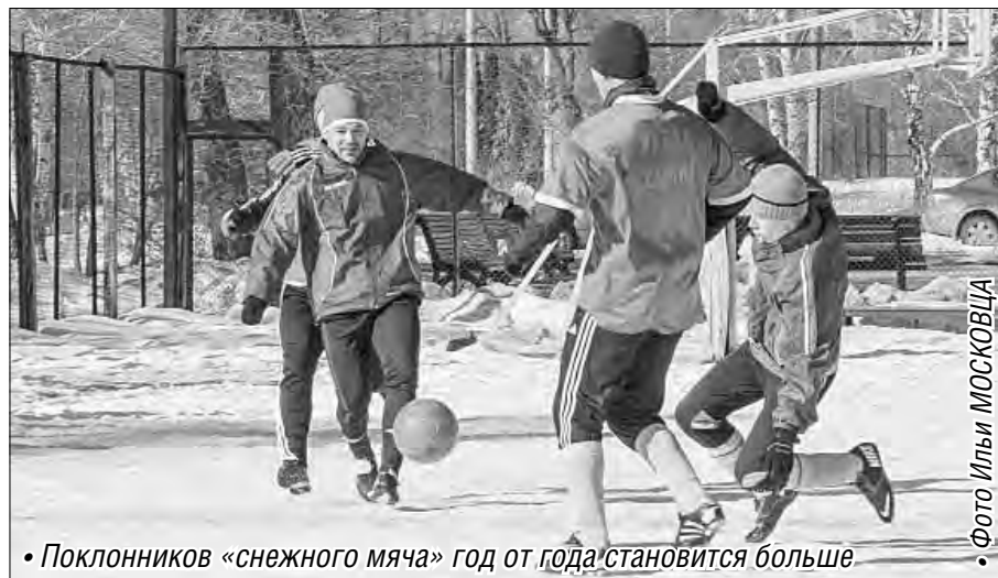
• Поклонников «снежного мяча» год от года становится больше

С тех пор игры проходят на территории этого спортклуба, причем участники массового турнира соревнуются иногда на всех футбольных полях одновременно: бывает, что в день встречаются до 50 команд-участниц. Помимо спортклуба в число организаторов также входят ОАО «ММК» и администрация Ленинского района. За почти двадцатилетнюю историю турнир стал одним из спортивных брендов Магнитки, прочно войдя в календарь массовых зимних спортивных мероприятий в городе. В нынешнем году «Снежный мяч» приурочили к Олимпийским играм в Сочи.