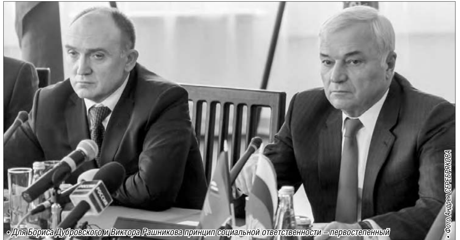
• Для Бориса Дубровского и Виктора Рашникова принцип социальной ответственности – первостепенный