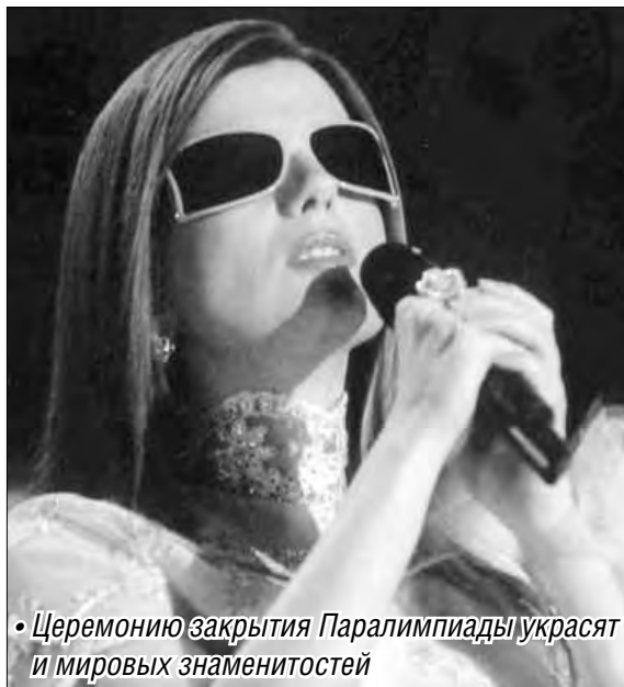
• Церемонию закрытия Паралимпиады украсят выступления российских звезд и мировых знаменитостей

Предстоящая церемония завершает сочинские Игры-2014, позволяя еще раз вспомнить са-