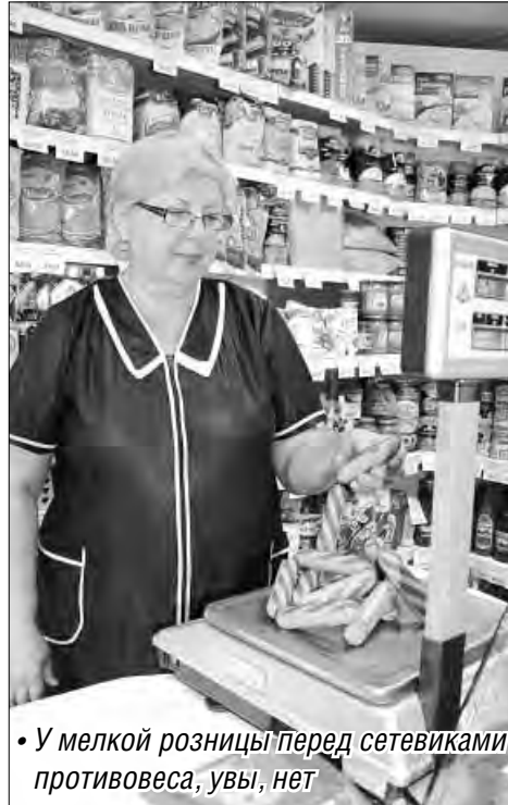
• У мелкой розницы перед сетевиками противовеса, увы, нет

ственных сетей в городе ведется неверно. В него включены и мелкая розница, и оптовая, и специализированная торговля алкогольными напитками и детским питанием. К примеру, в Магнитогорске органы статистики определили долю сетей в 2012 году в 21,8 процента. Даже простое сопоставление по торговым площадям говорит, что цифра некорректна. «Здесь одних продовольственных гипермаркетов известной компании на 400 тысяч населения – четыре штуки, а их всего по стране тридцать. Сюда добавьте еще 36 магазинов формата поменьше, 23 универсама других компаний и 58 алкомаркетов. По нашим расчетам, доля сетей в Магнитогорске достигла