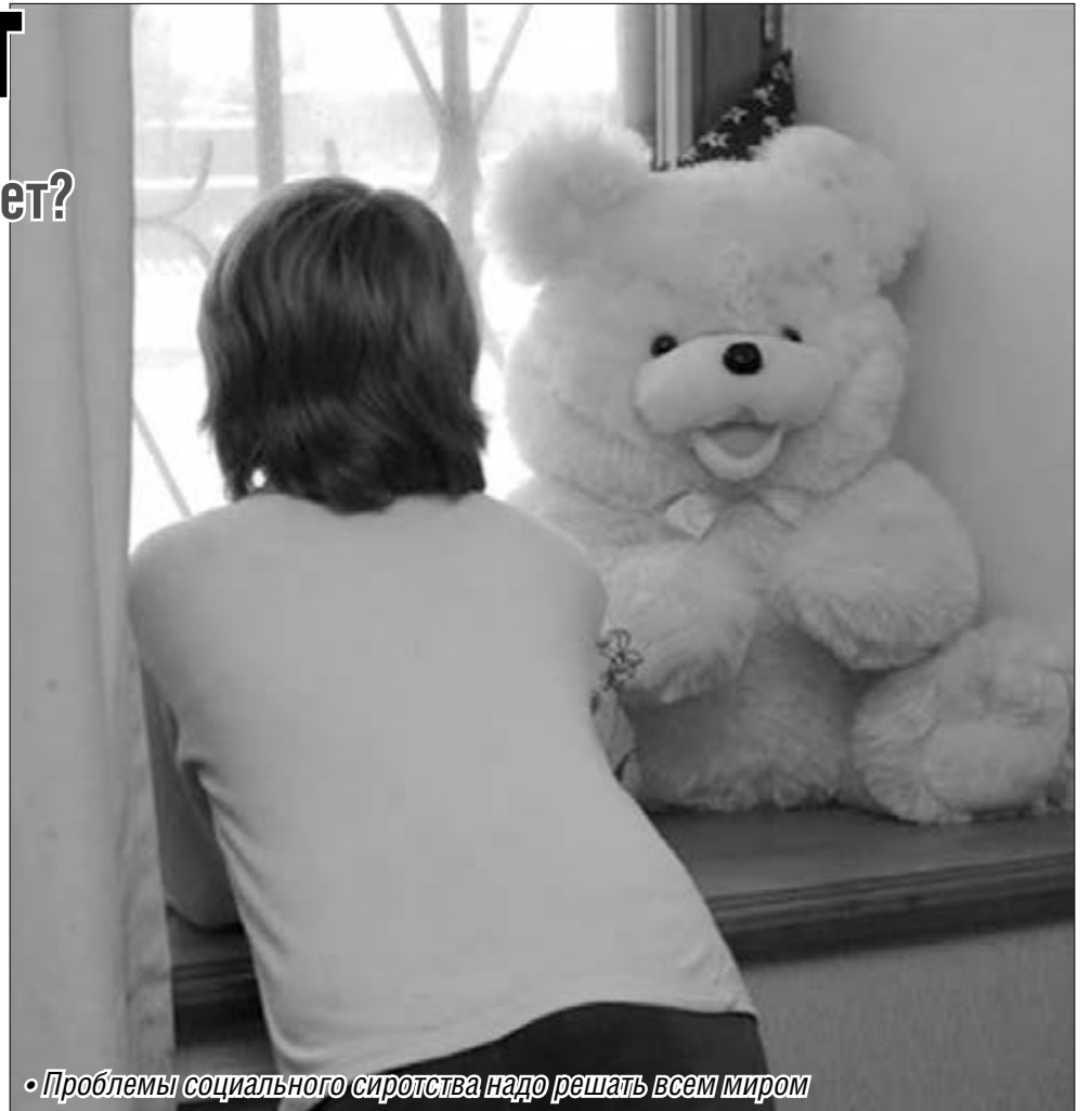
• Проблемы социального сиротства надо решать всем миром