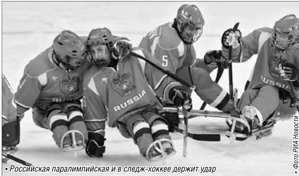
• Российская паралимпийская и в следж-хоккее держит удар

Пандусы, специальные лифты, желтая разметка (она хорошо заметна слабовидящим людям), низкопольные автобусы, удобные банкоматы... Но приятнее все-