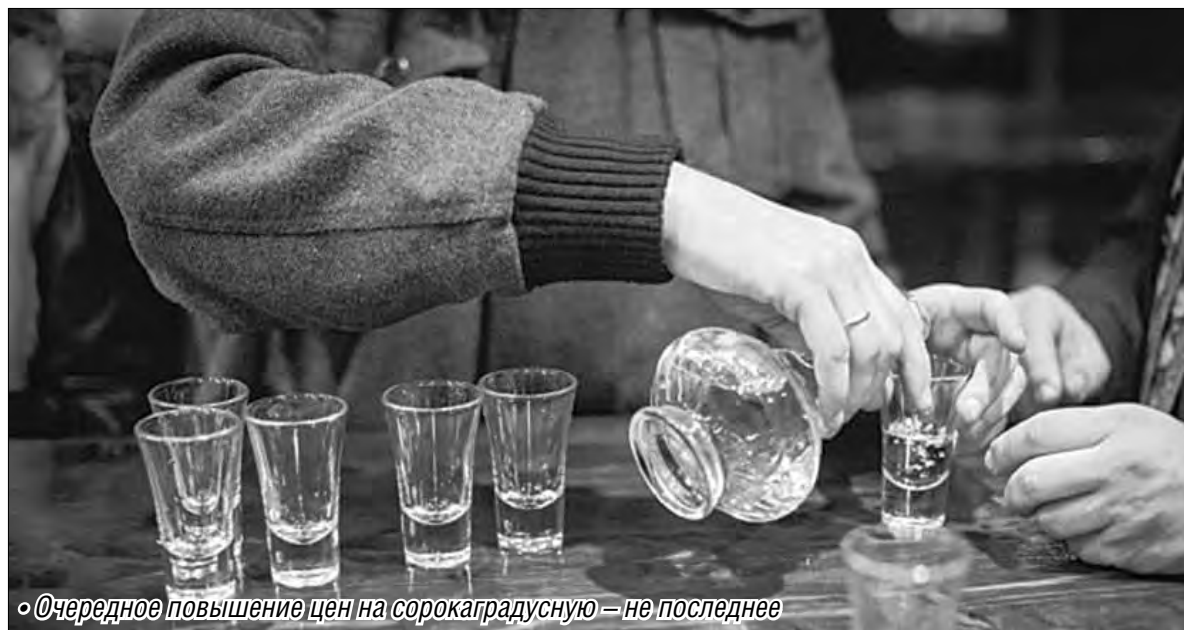
• Очередное повышение цен на сорокаградусную – не последнее

– До ее введения на прилавке стояла легальная водка и нелегальная по бросовой стоимости. После – стоимость легальной и нелегальной водки сравнялась. В результате психологически стал бо-