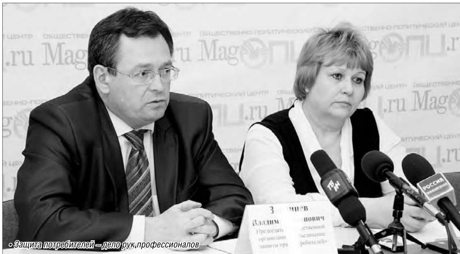
«Защита потребителей – дело рук профессионалов»

15 марта представители Объединения защиты прав потребителей и специалисты Роспотребнадзора отмечают профессиональный праздник