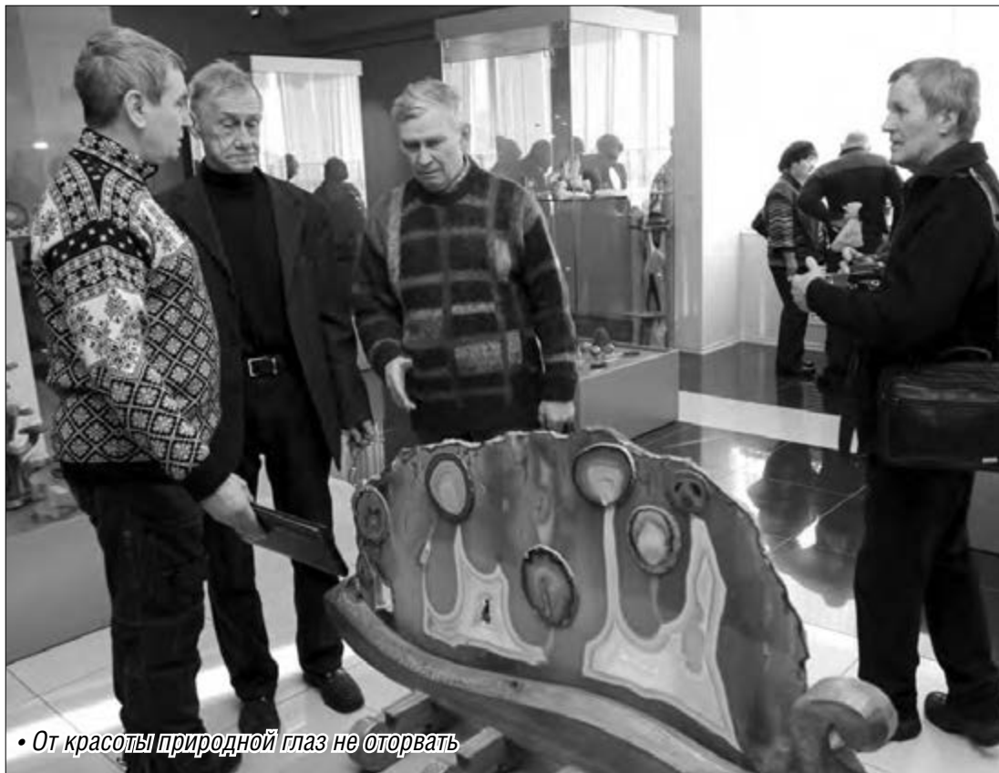
• От красоты природной глаз не оторвать