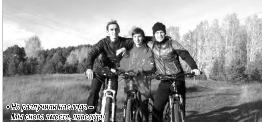
• Не разлучили нас года – Мы снова вместе, навсегда!