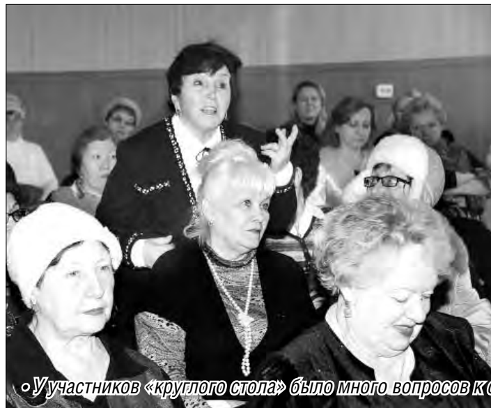
Участников «круглого стола» было много вопросов к специалистам

Острые темы – за «круглым столом». Продолжение следует