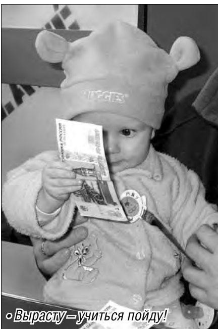
Вырасту – учиться пойду!