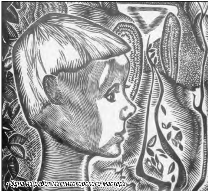
◦ Одна из работ магнитогорского мастера