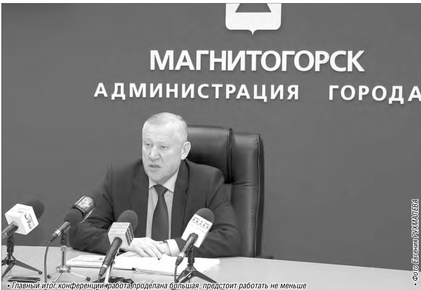
• Главный итог конференции: работа проделана большая, предстоит работать не меньше

Вчера состоялась итоговая пресс-конференция главы города