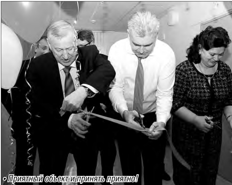
• Приятный объект и принять приятно!

Молодёжи дали «воду», малышам – новые стены