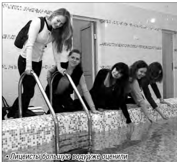
• Лицейсты большую воду уже оценили

В ходе очередного объезда глава города принял участие в торжественном открытии двух реконструированных объектов в образовательных учреждениях