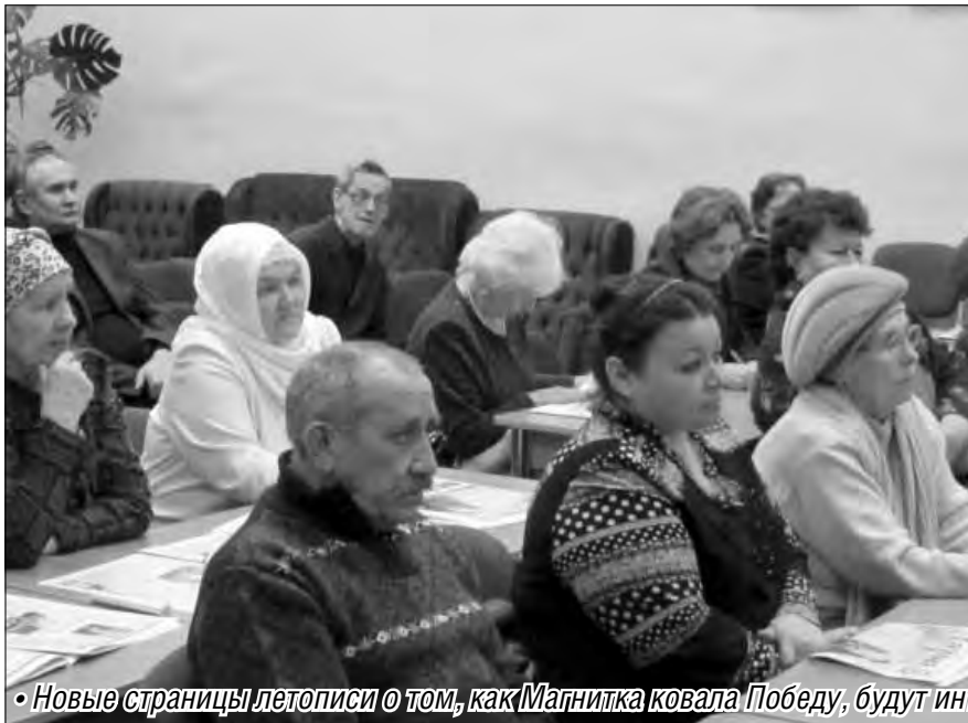
• Новые страницы летописи о том, как Магнитка ковала Победу, будут интересны широкой читательской аудитории

В школы города поступил новый учебник по истории Магнитогорска