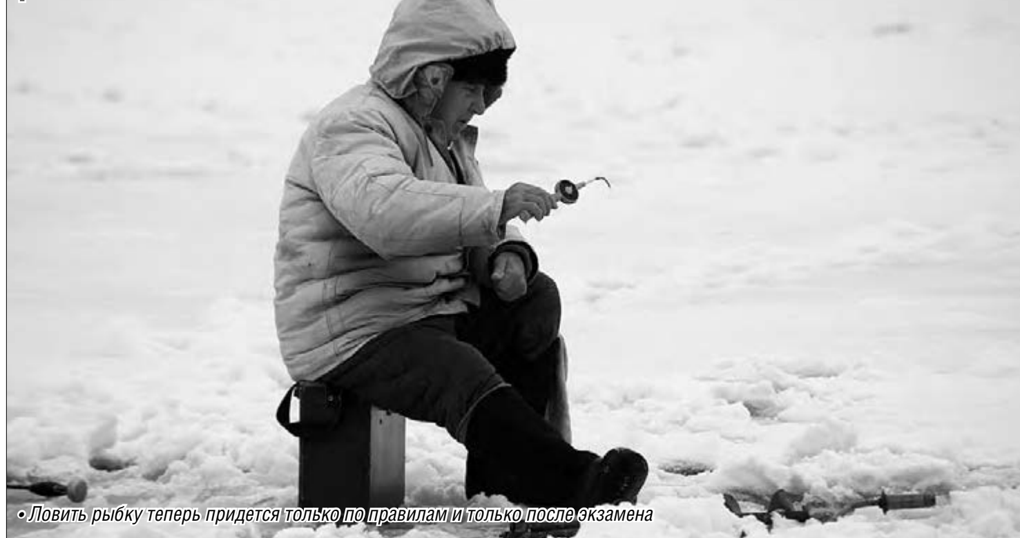
• Ловить рыбку теперь придется только по правилам и только после экзамена

Одним из самых распространенных хобби россиян, бесспорно, является рыбная ловля.